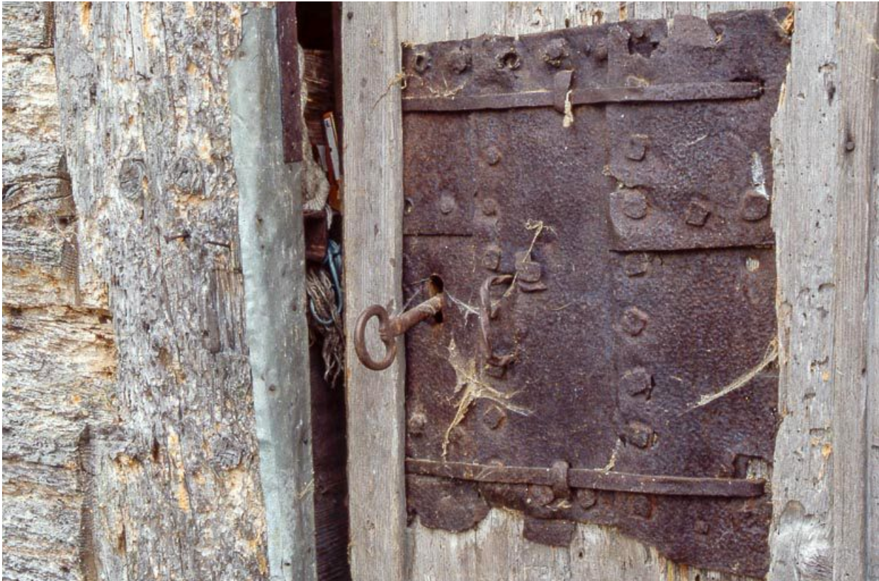
Clef et serrure de la porte du grenier fort.