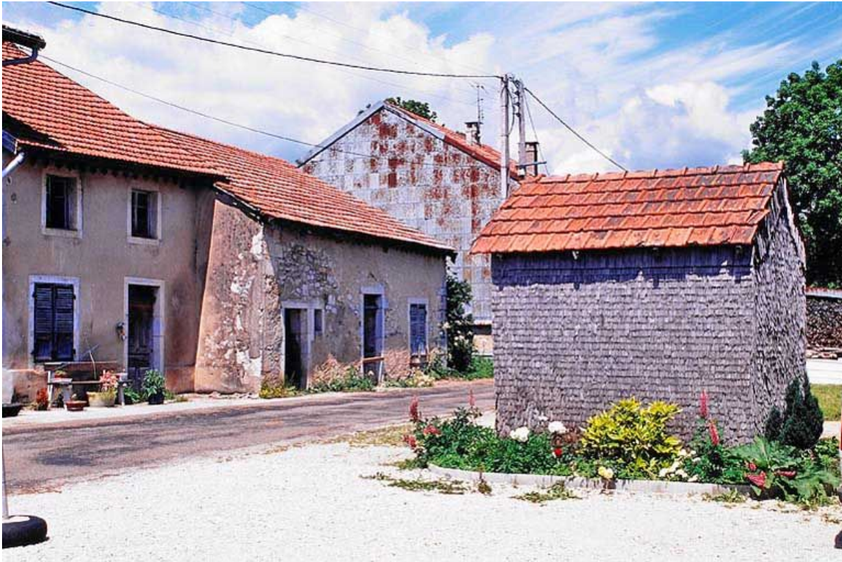
Vue de trois quarts de la façade antérieure et, au premier plan, la resserre. 39, Longchaumois