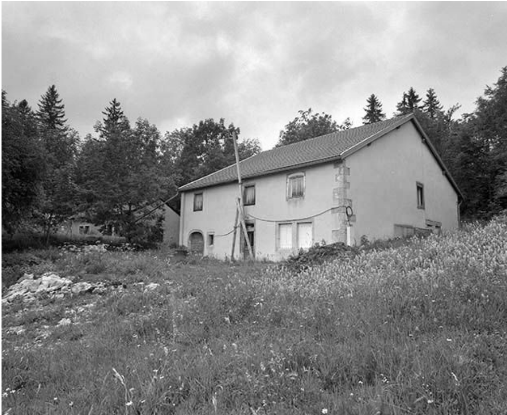
Vue de trois quarts de la façade antérieure et de la face droite.