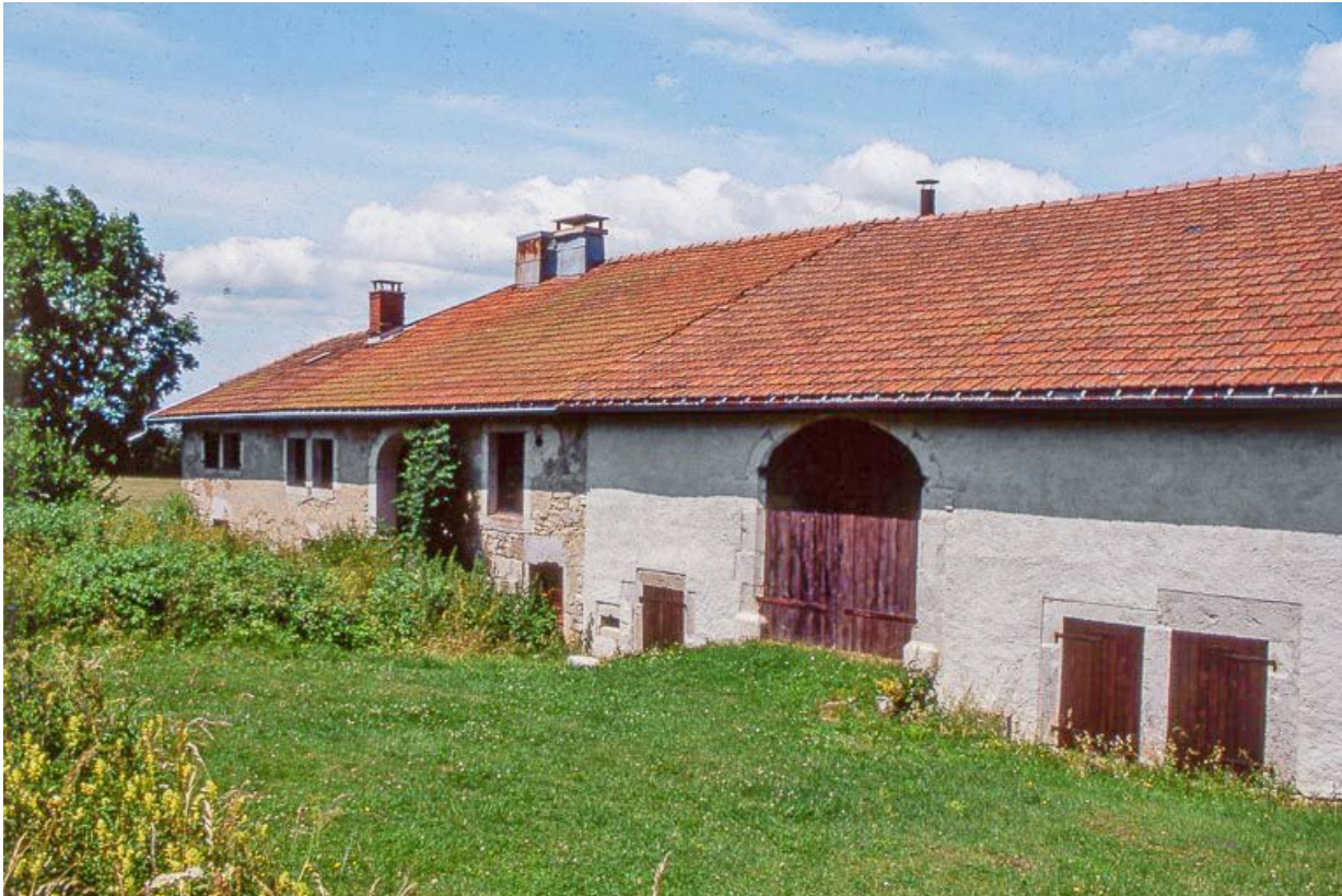
Ferme au hameau de Beauregard, façade postérieure.