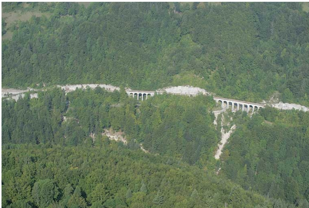
Vue aérienne des deux viaducs, depuis le sud-est. 39, Morbier