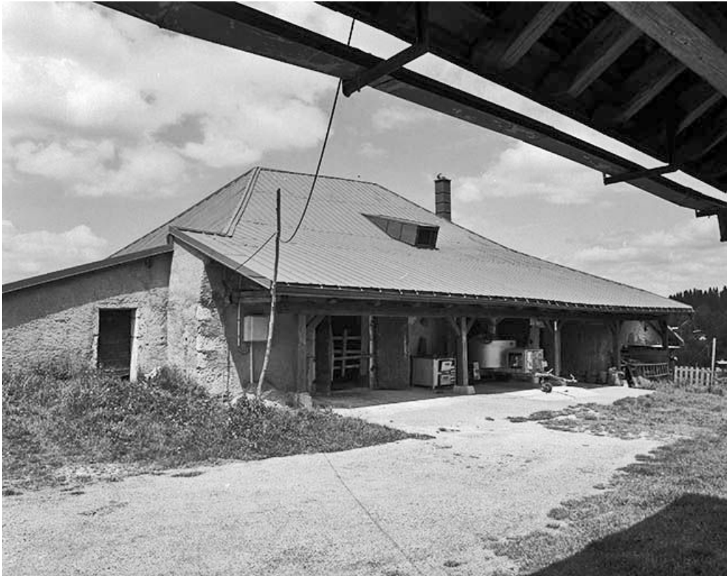
Avant-toit débordant sur la façade antérieure.

39, Les Rousses, lieudit : la Pile dessous