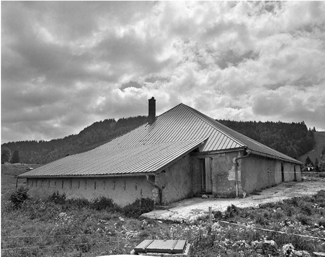
Façade postérieure vue de trois quarts gauche.

39, Les Rousses, lieudit : la Pile dessous