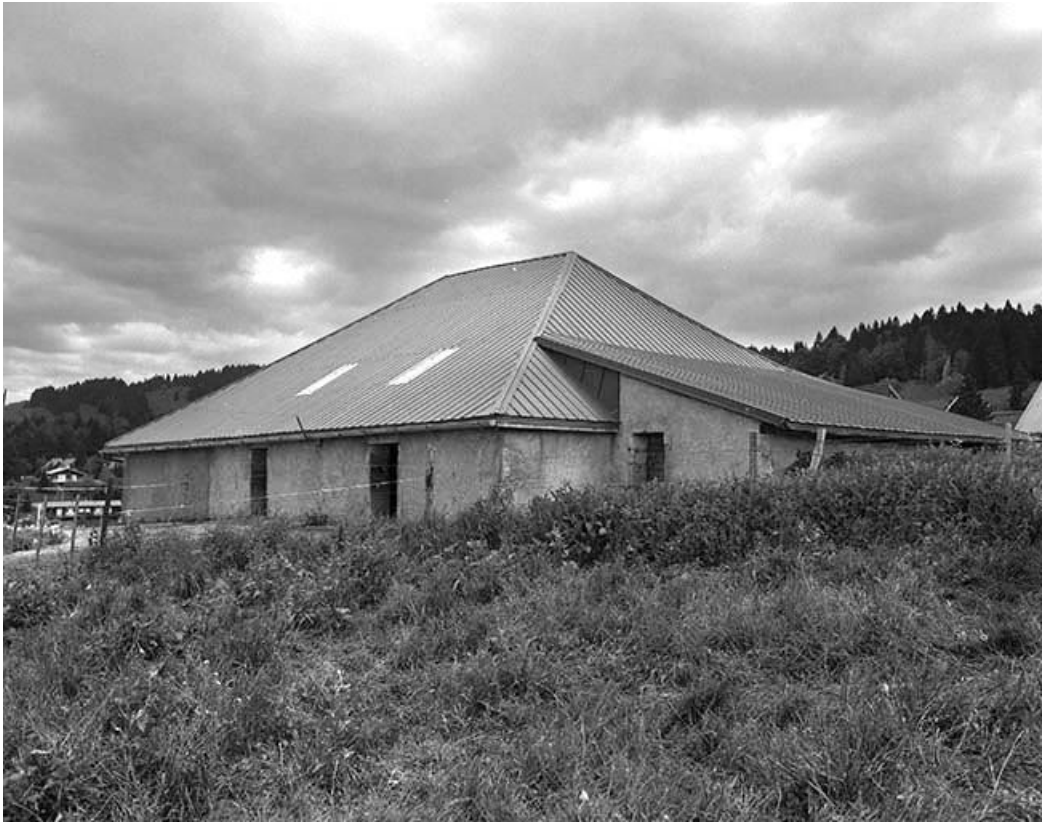
Façade postérieure vue de trois quarts droit.

39, Les Rousses, lieudit : la Pile dessous