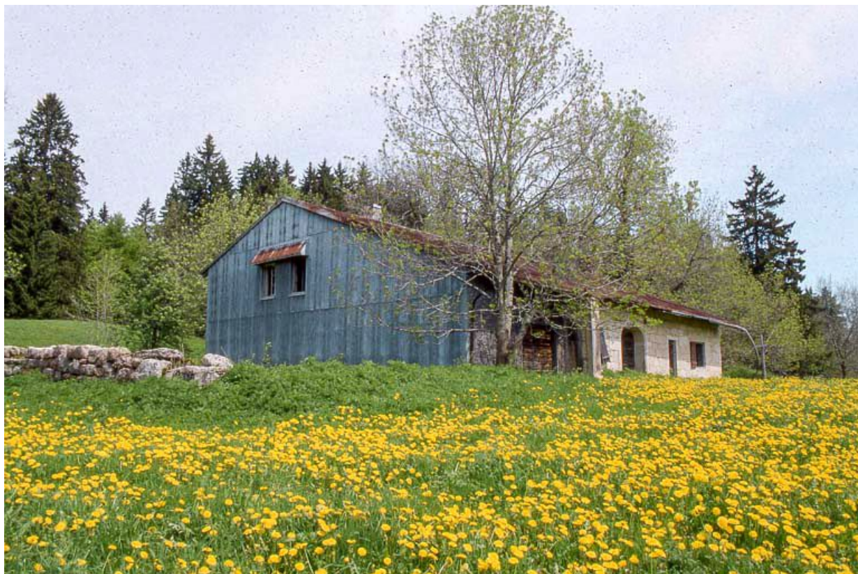
Façade antérieure et face gauche vues de trois quarts.

39, Les Rousses, lieudit : Ferme du Commandant