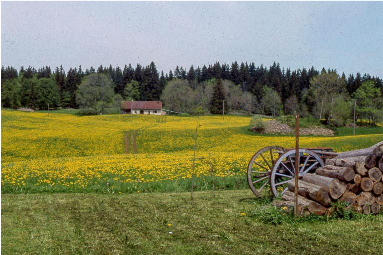
Vue de situation.