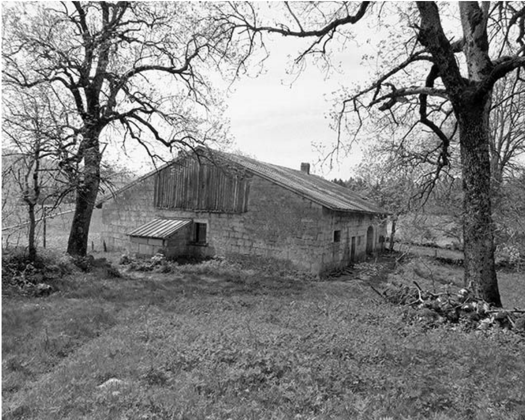
Face droite et façade postérieure vues de trois quarts.

39, Les Rousses, lieudit : Ferme du Commandant