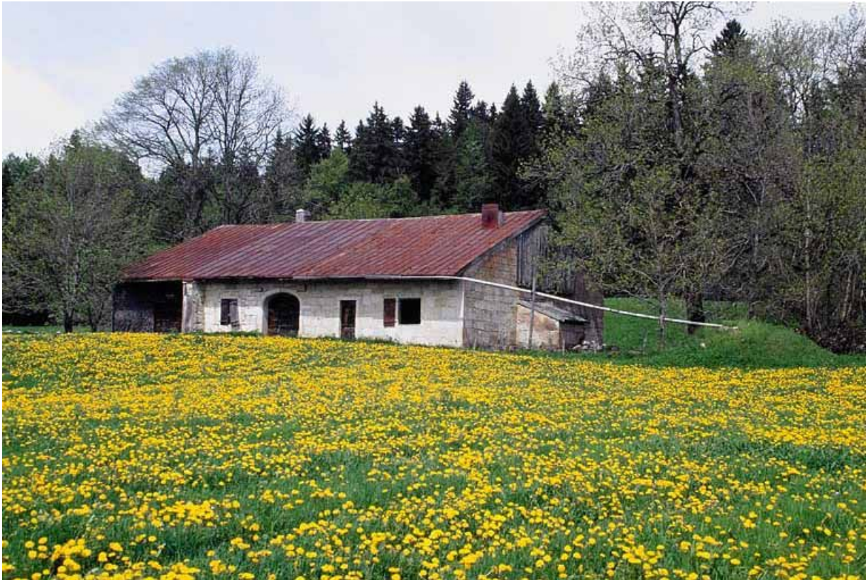
Façade antérieure et face droite vues de trois quarts.

39, Les Rousses, lieudit : Ferme du Commandant