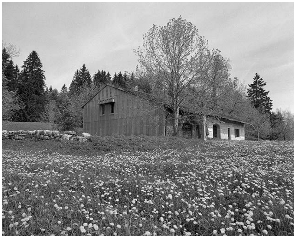
Façade antérieure et face gauche vues de trois quarts.

39, Les Rousses, lieudit : Ferme du Commandant