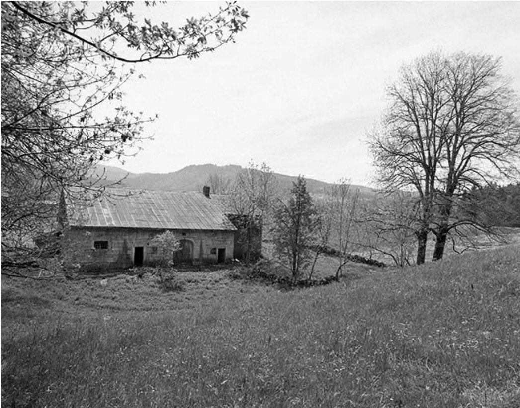
Vue éloignée de la façade postérieure.

39, Les Rousses, lieudit : Ferme du Commandant