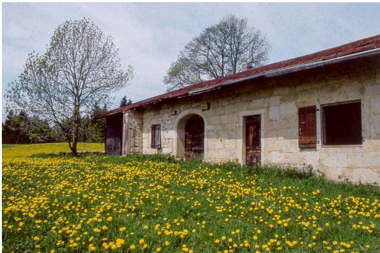
Façade antérieure, vue rapprochée.

39, Les Rousses, lieudit : Ferme du Commandant