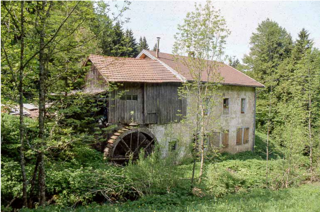
Façade postérieure et roue.

39, Les Rousses Bief Bruyant 514, lieudit : sous les Barres