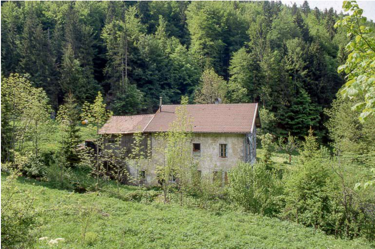
Façade postérieure, vue éloignée.

39, Les Rousses Bief Bruyant 514, lieudit : sous les Barres