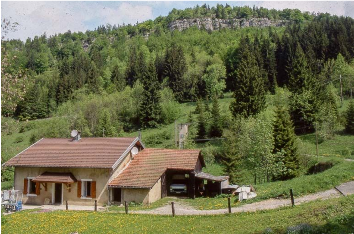
Vue éloignée du bâtiment dans le site, façade antérieure.

39, Les Rousses Bief Bruyant 514, lieudit : sous les Barres