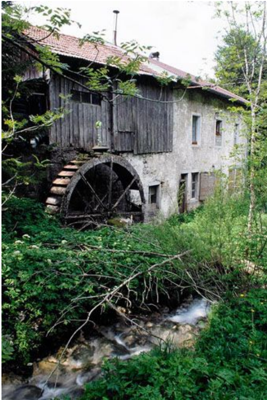
Façade postérieure, roue et bief Bruyant.

39, Les Rousses Bief Bruyant 514, lieudit : sous les Barres