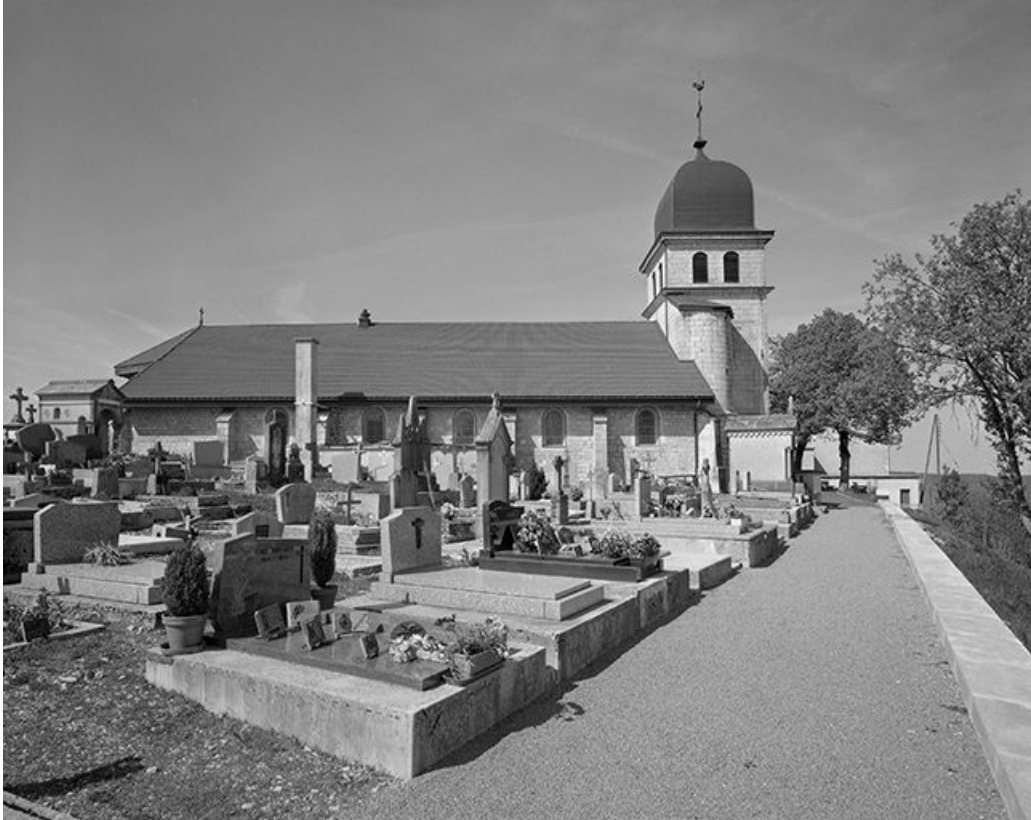
Façade latérale gauche.