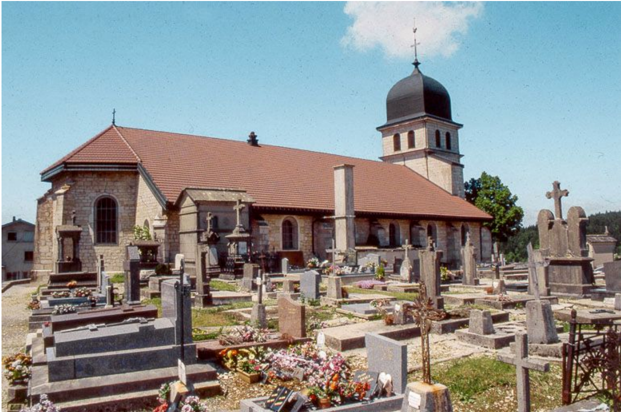
Façade latérale gauche et cimetière.