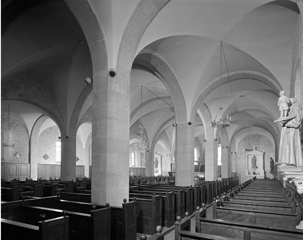
La nef vue de trois quarts.