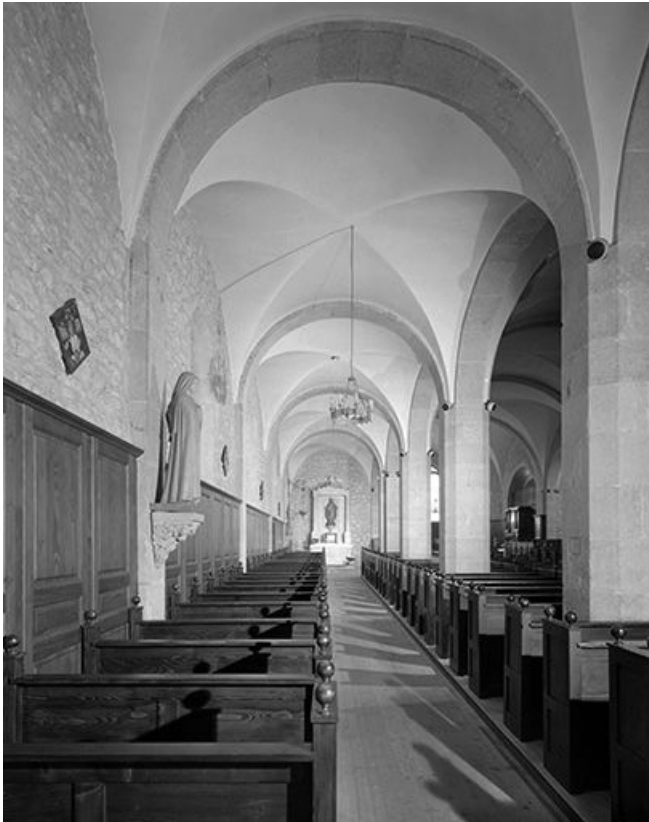
Le bas-côté gauche.