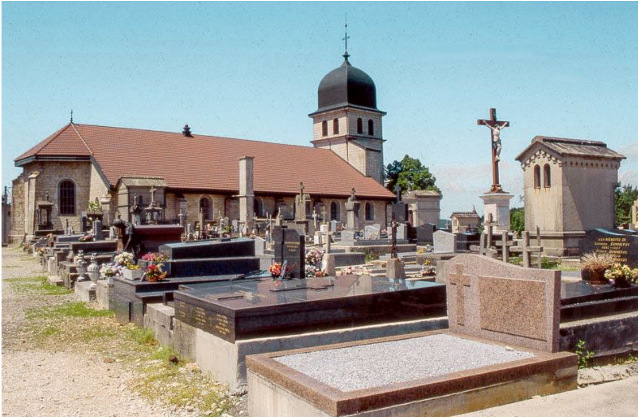
Façade latérale gauche, et au premier plan le cimetière.