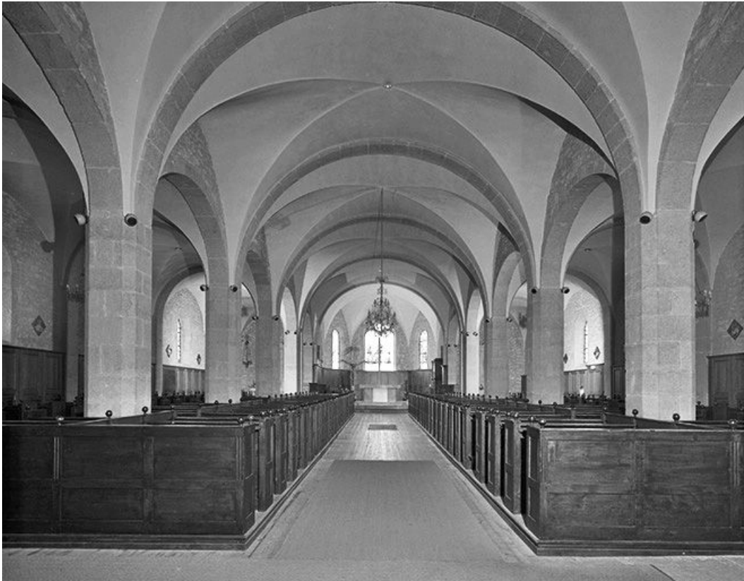
Le vaisseau central vu depuis le porche d'entrée.