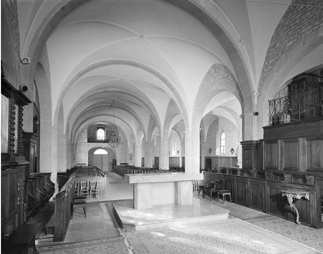
Le vaisseau central vu depuis le chœur.