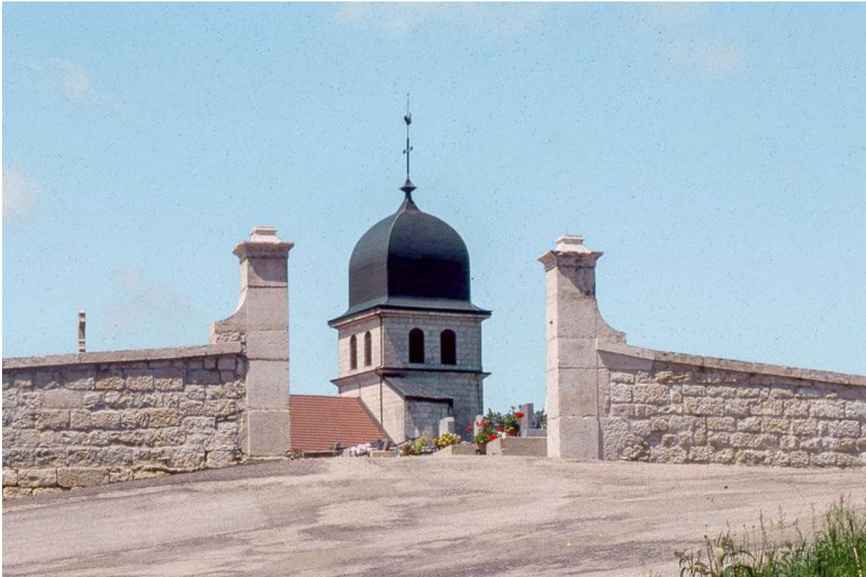
Enclos du cimetière et clocher.