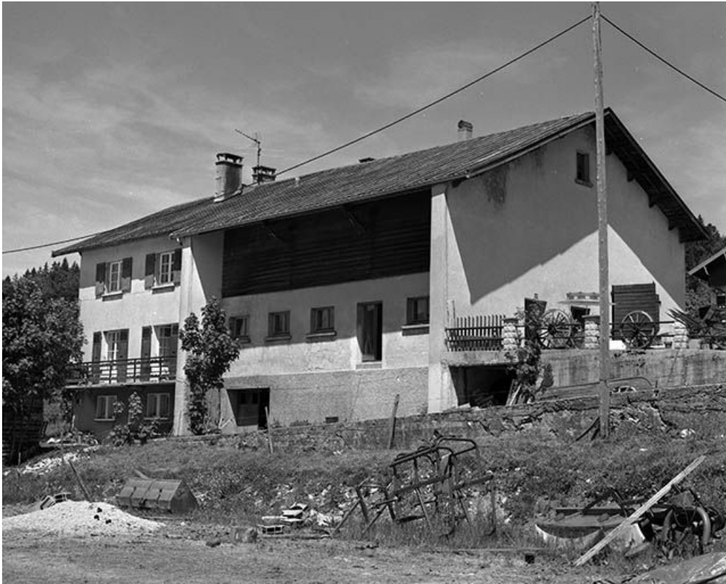
Façade postérieure d'une ferme datant de la reconstruction, vue de trois quarts. 39, Les Rousses