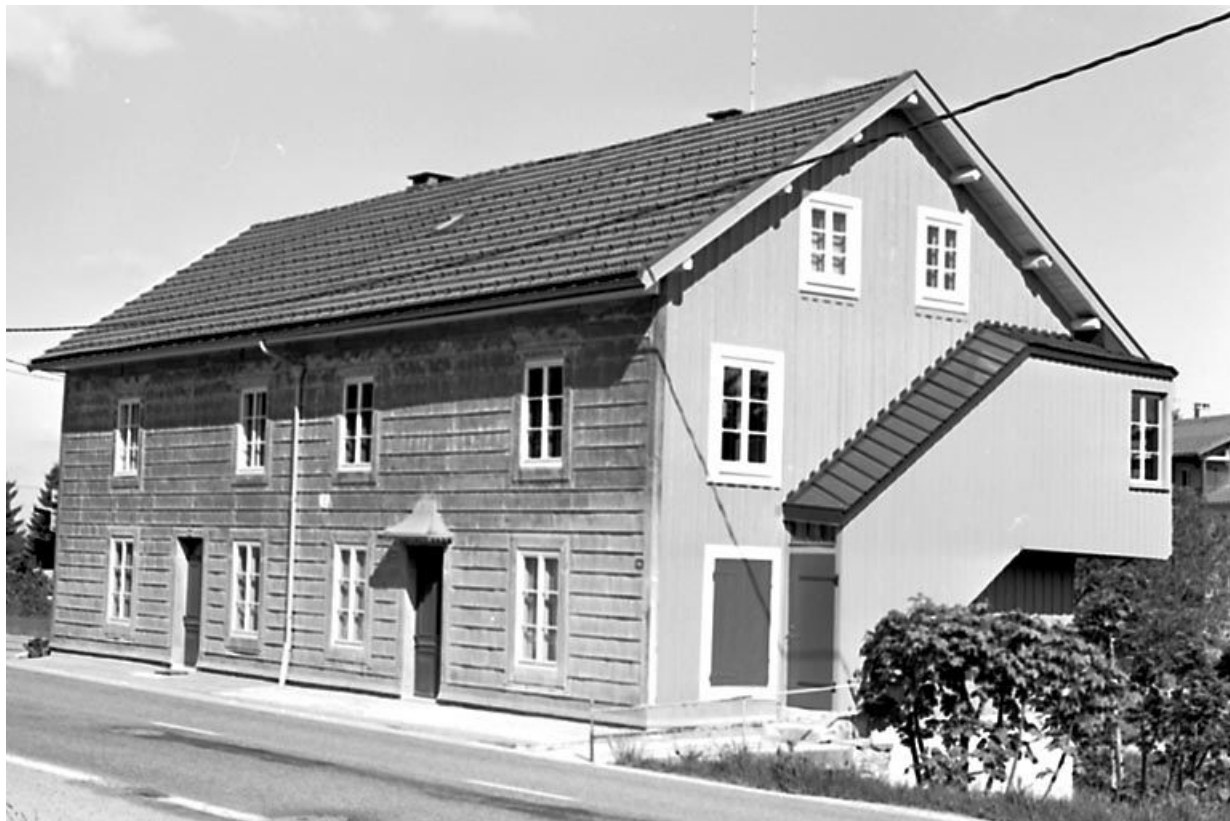
Vue de situation de l'édifice dans la rue.

39, Les Rousses, 501, 509 route du Noirmont