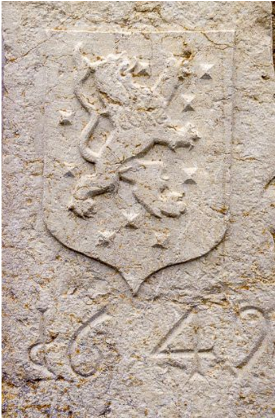
Détail des armoiries.