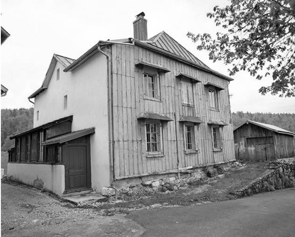
Façades nord et ouest vues de trois quarts.