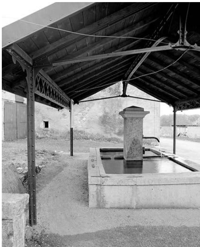
Vue générale du bassin et de la charpente.