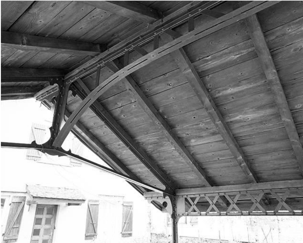
Charpente métallique : faîtage et sablière.