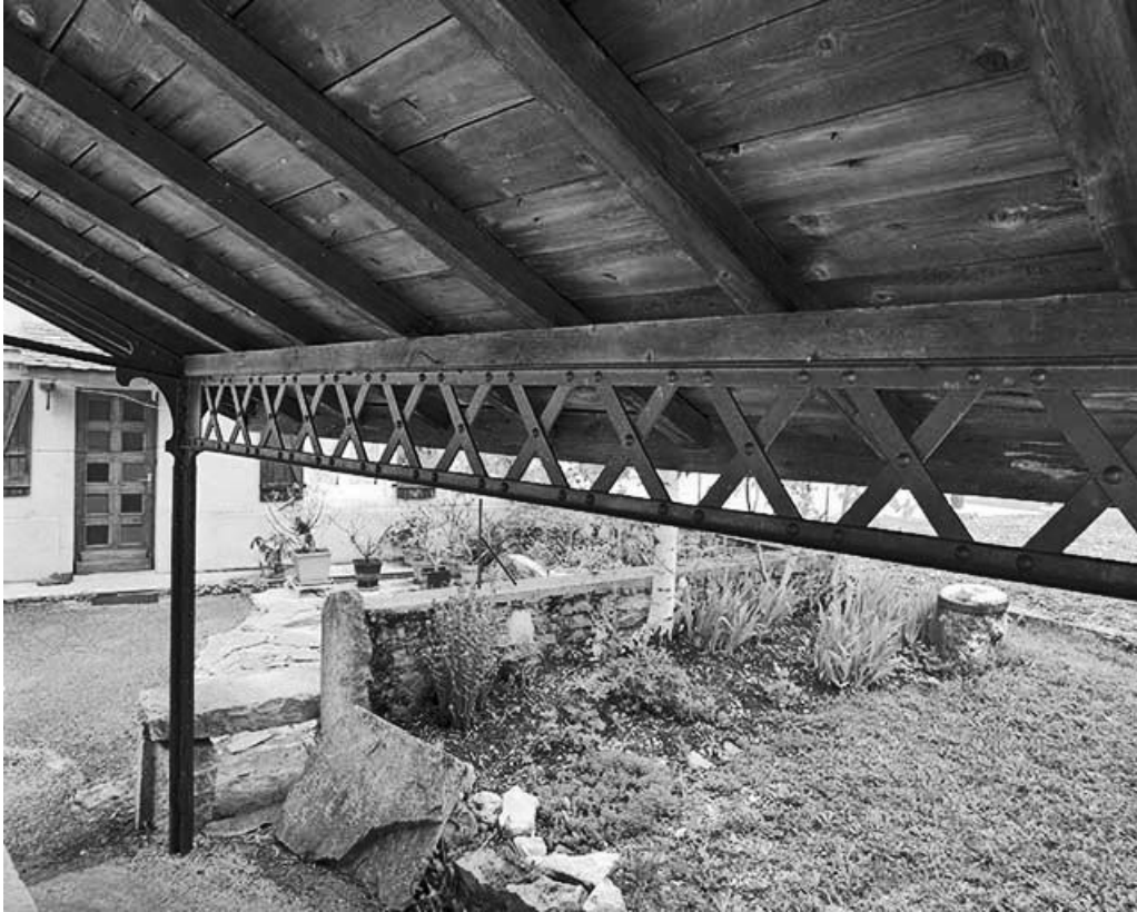
Détail de la panne sablière.