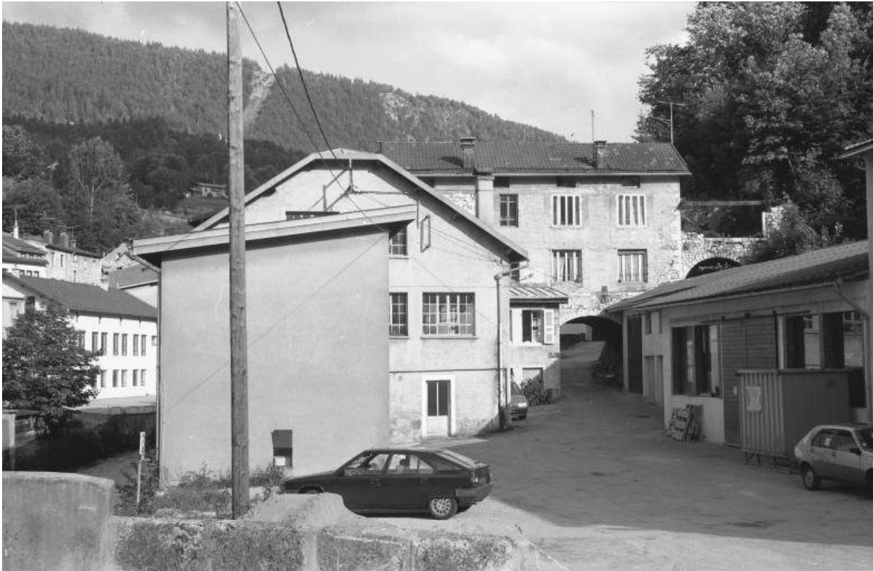
Vue d'ensemble depuis le nord-ouest (aval).