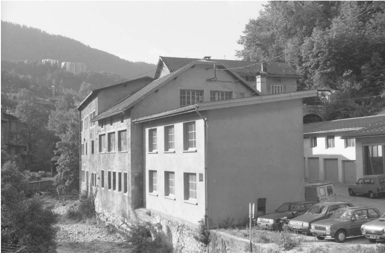
Façade sur la Bienne depuis le nord (aval).