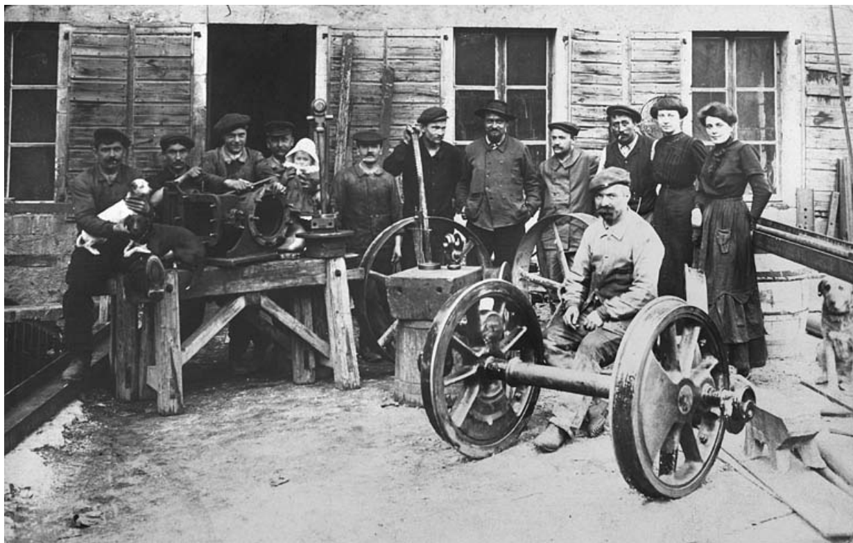
Le personnel de l'usine Benier-Rollet.