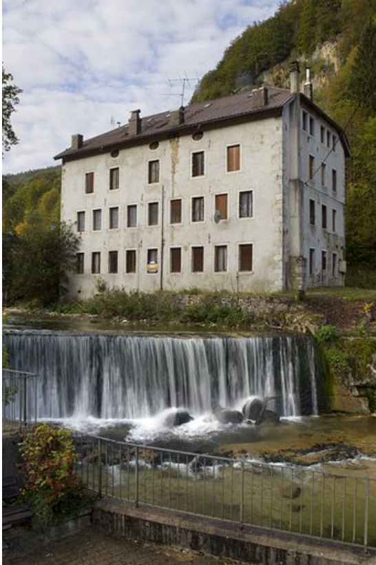
Ancienne usine d'horlogerie Emmanuel Girod puis de matériel d'équipement industriel Benier-Rollet (18 rue Pierre Morel).