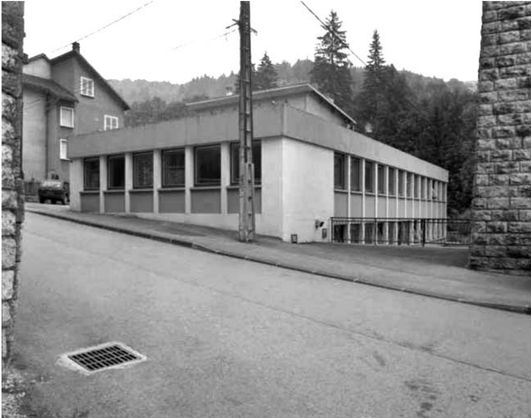
Atelier de fabrication de 1978.