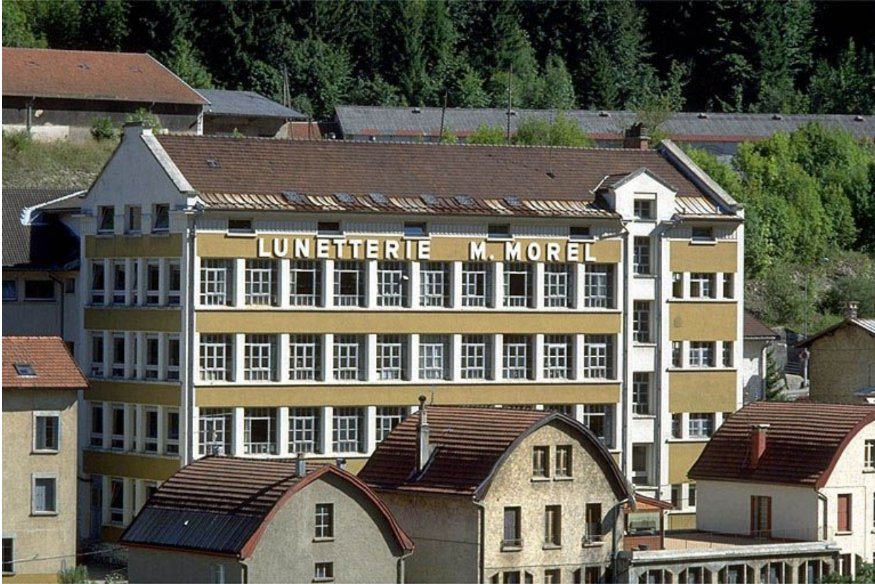
Façade postérieure de l'atelier de 1936.

39, Morez, 18 à 22 avenue Charles de Gaulle