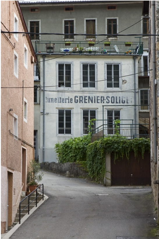
Façade postérieure sur la rue Fenandre.