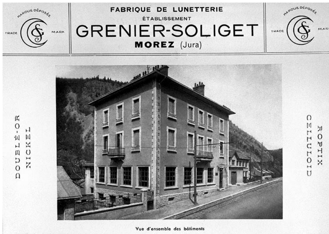
Vue d'ensemble des bâtiments.

Photographie, s.d. [2e quart 20e siècle, vers 1933]. Dans : " Inauguration Officielle de l'Ecole Nationale Victor Bérard " [...], s.l. [Morez] : s.n. [Ecole nationale Victor Bérard], 1933, p. 38.