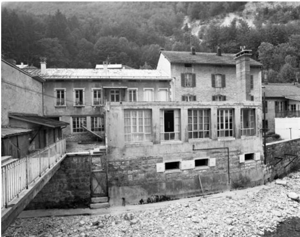
Façade antérieure de l'usine sur la rue de la République.