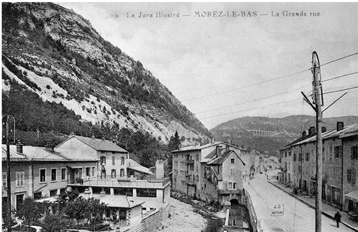
Le Jura Illustré - Morez-le-Bas - La Grande rue.