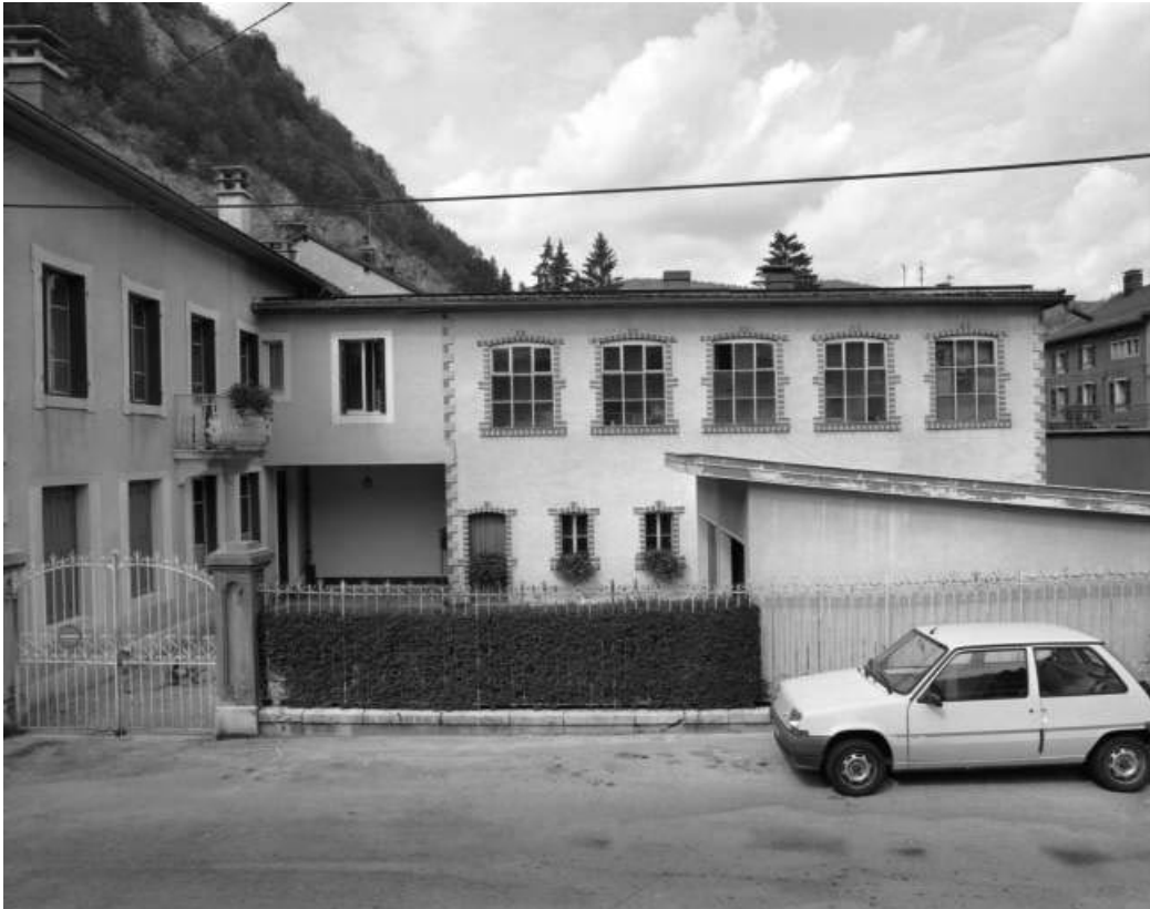
Atelier de fabrication désaffecté près du logement patronal.