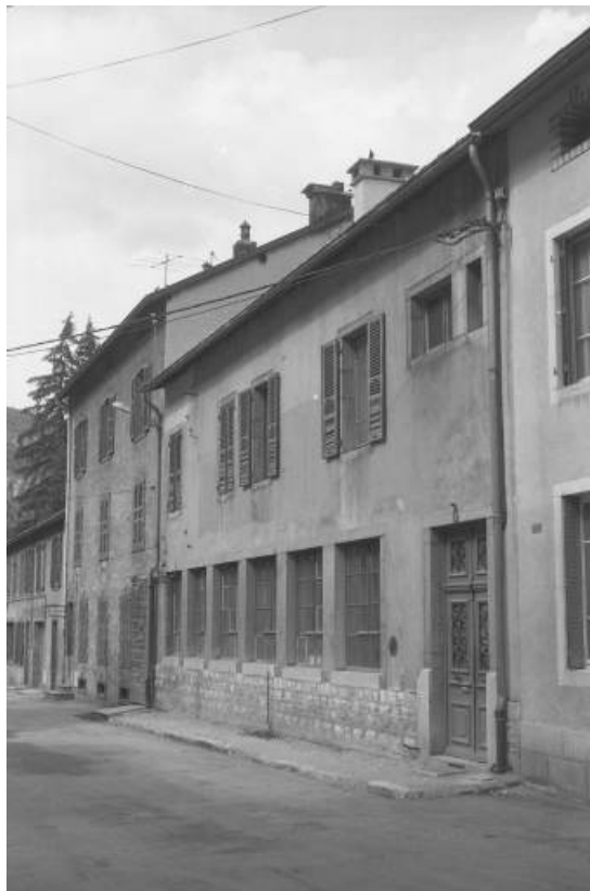
Façade de l'usine sur la rue de l'Industrie.