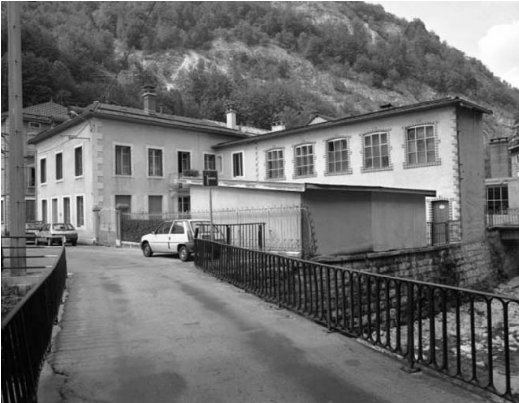
Vue d'ensemble du logement patronal, depuis le pont de la rue du Casino. 39, Morez, 11 rue de l' Industrie