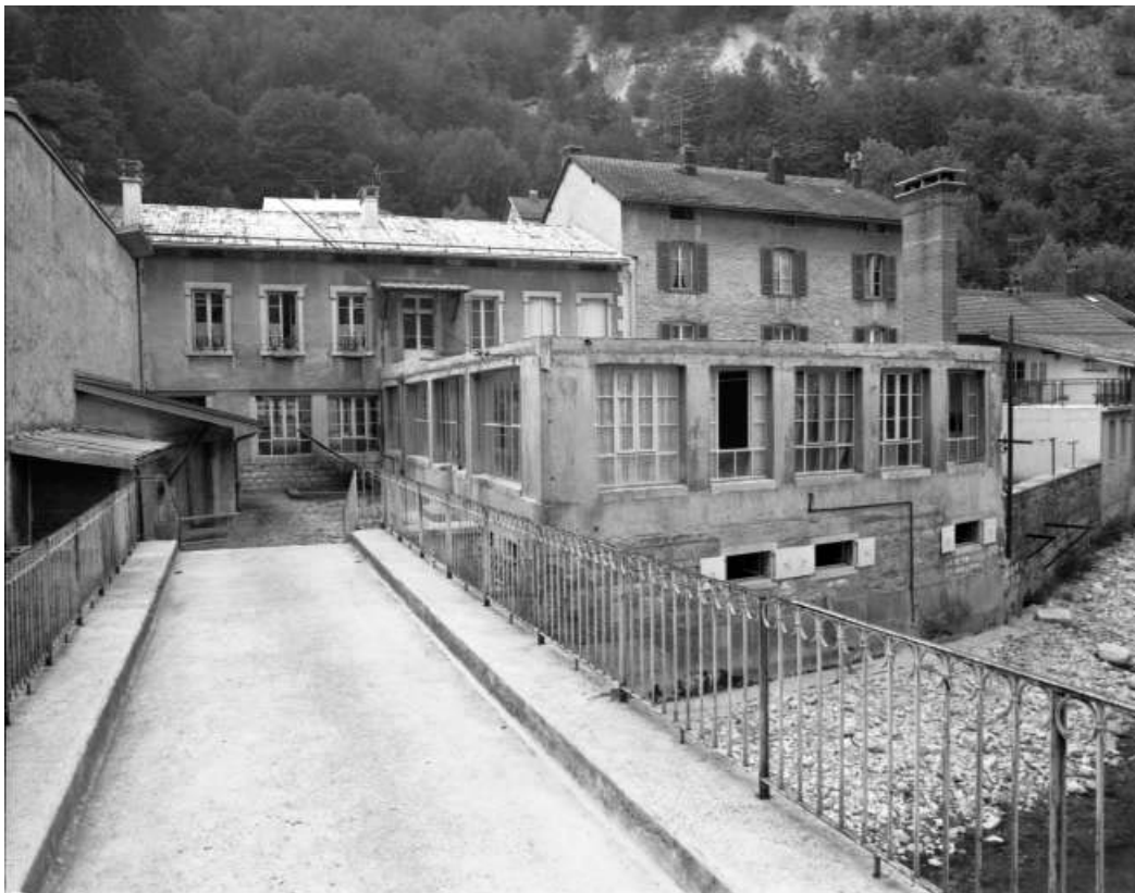
Façade antérieure de l'usine sur la rue de la République et passerelle sur la Bienne.