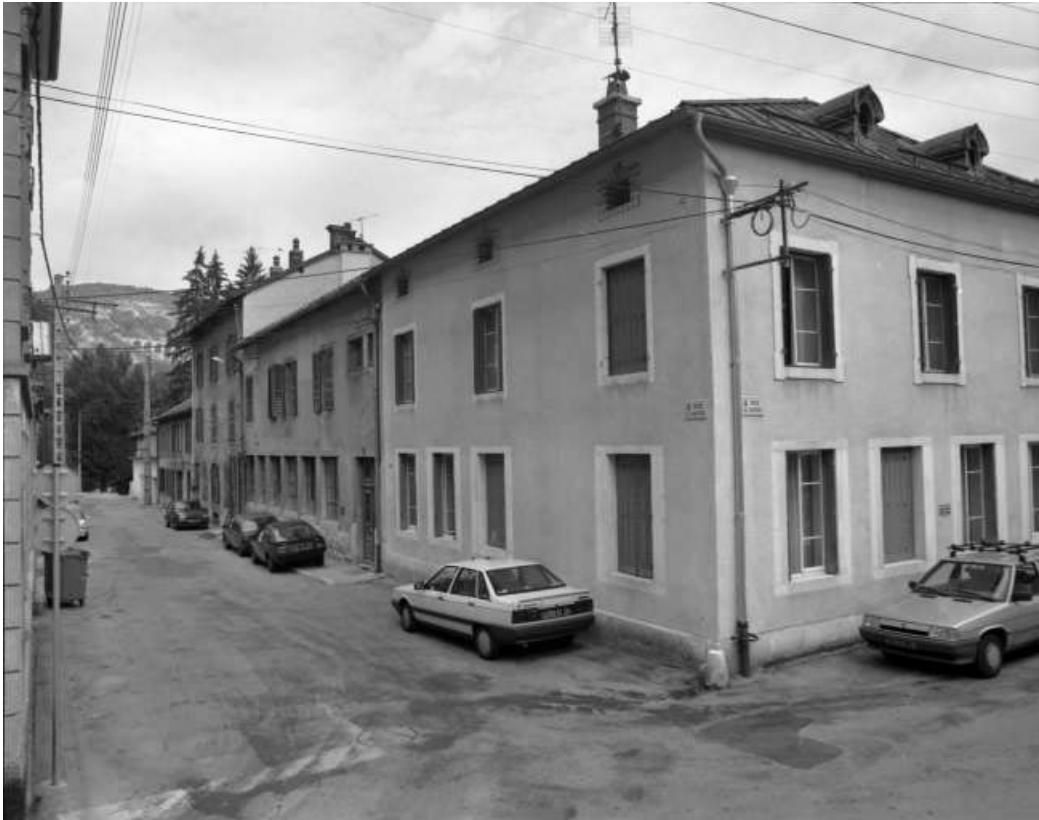
Vue d'ensemble à l'angle des rues de l'Industrie et du Casino.