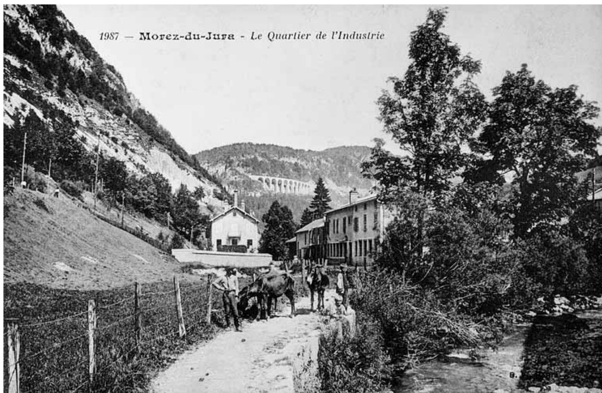
Morez-du-Jura - Le Quartier de l'Industrie.