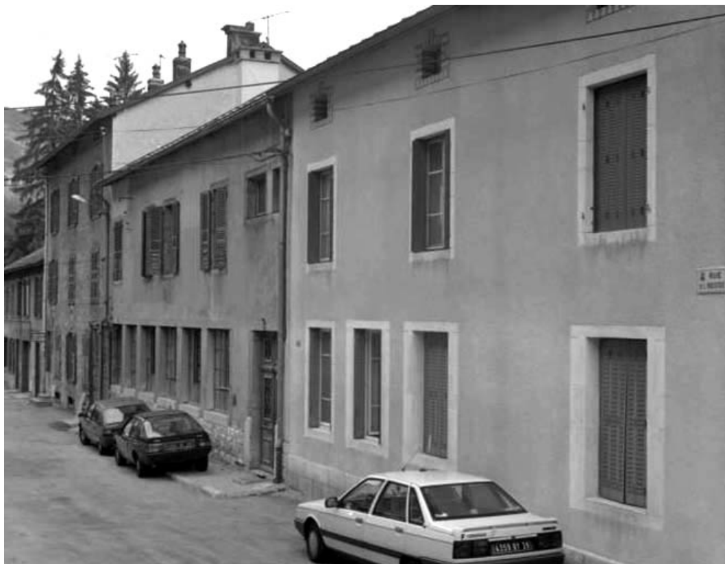
Façades sur la rue de l'Industrie.