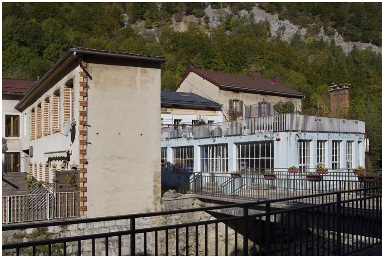
Vue d'ensemble depuis la rue de la République.