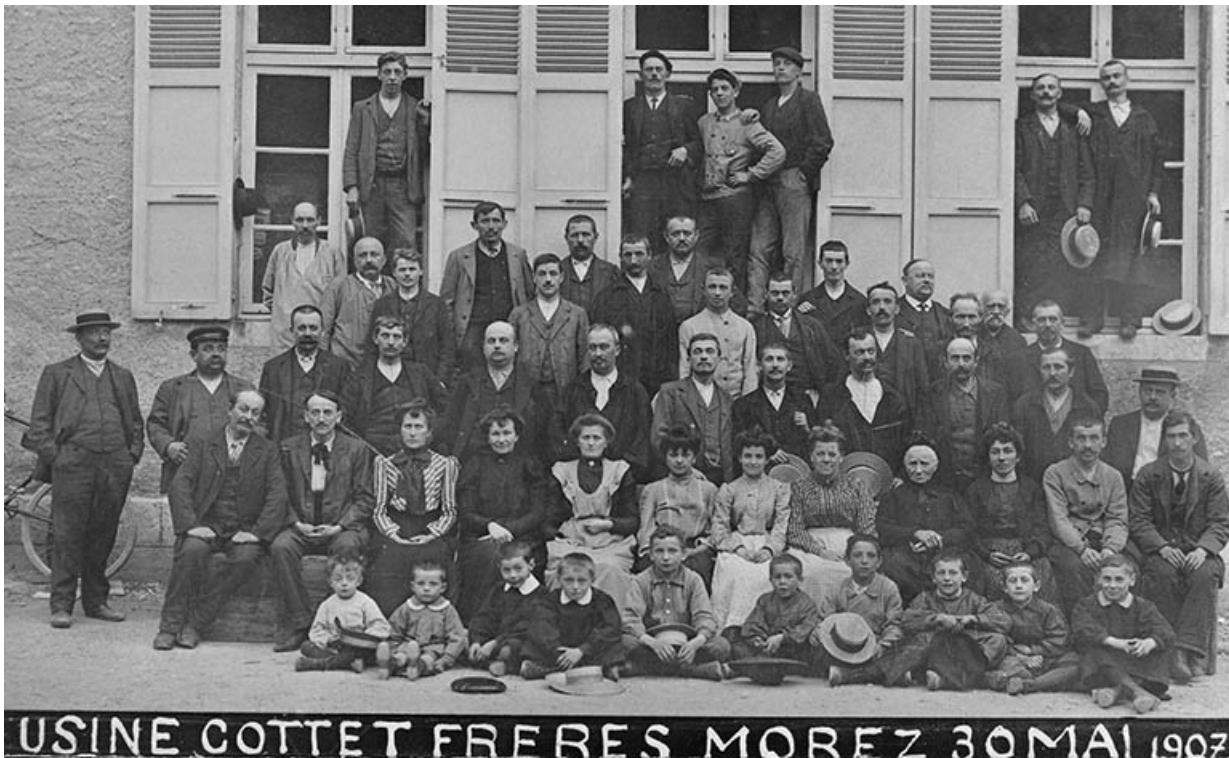
Usine Cottet frères. Morez. 30 mai 1907. 39, Morez, 18 rue Pasteur