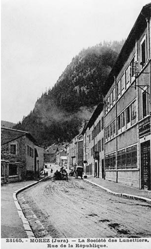
Morez (Jura) - La Société des Lunettiers. Rue de la République.

39, Morez, 194 à 198 rue de la République