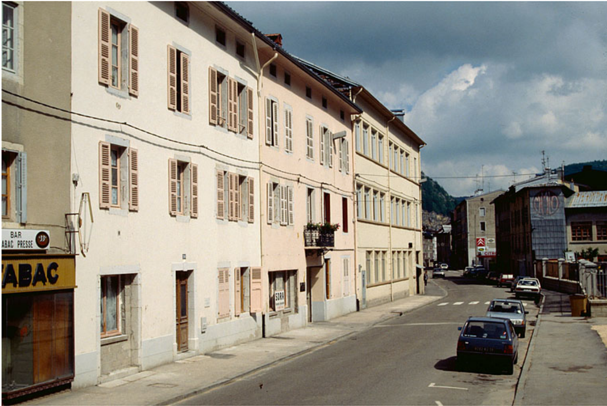
Façade antérieure des bâtiments sur rue. 39, Morez, 194 à 198 rue de la République