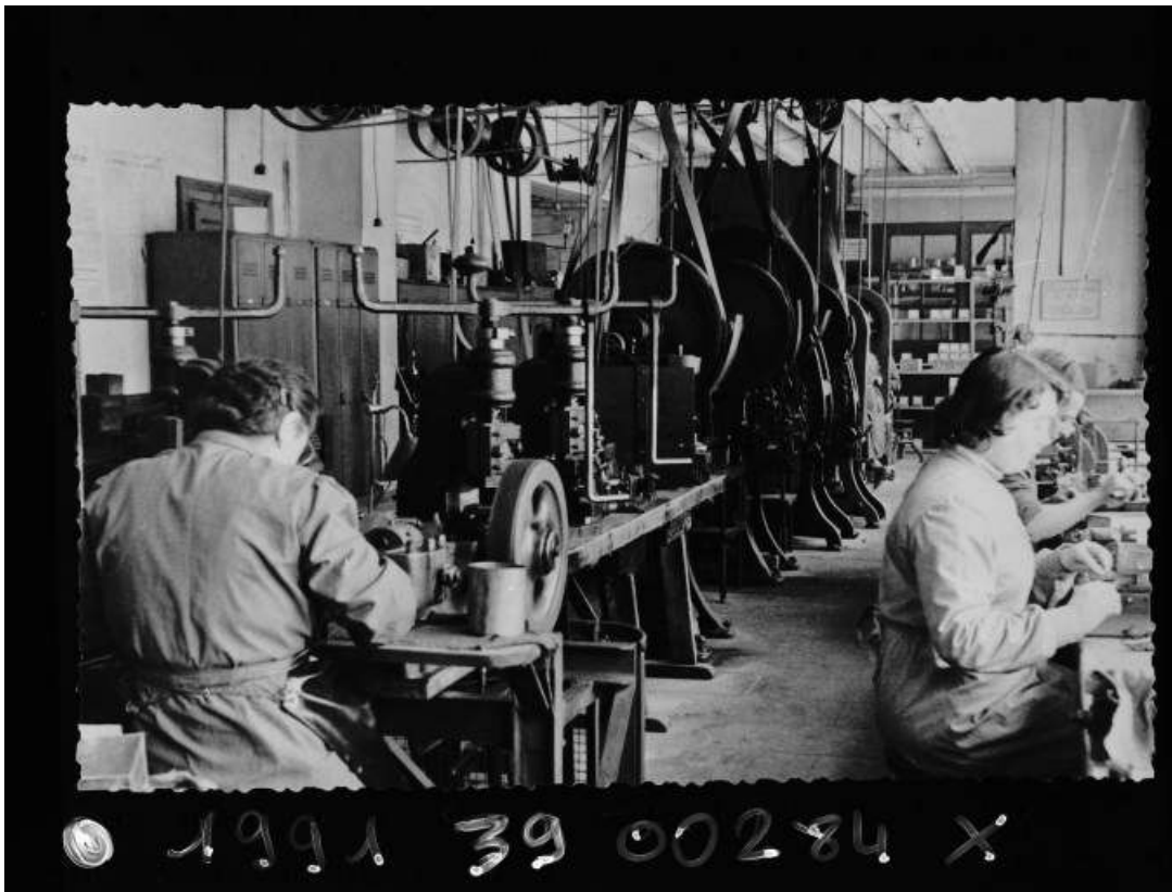
Atelier des apprêts : fabrication de composants de lunettes.

39, Morez, 194 à 198 rue de la République