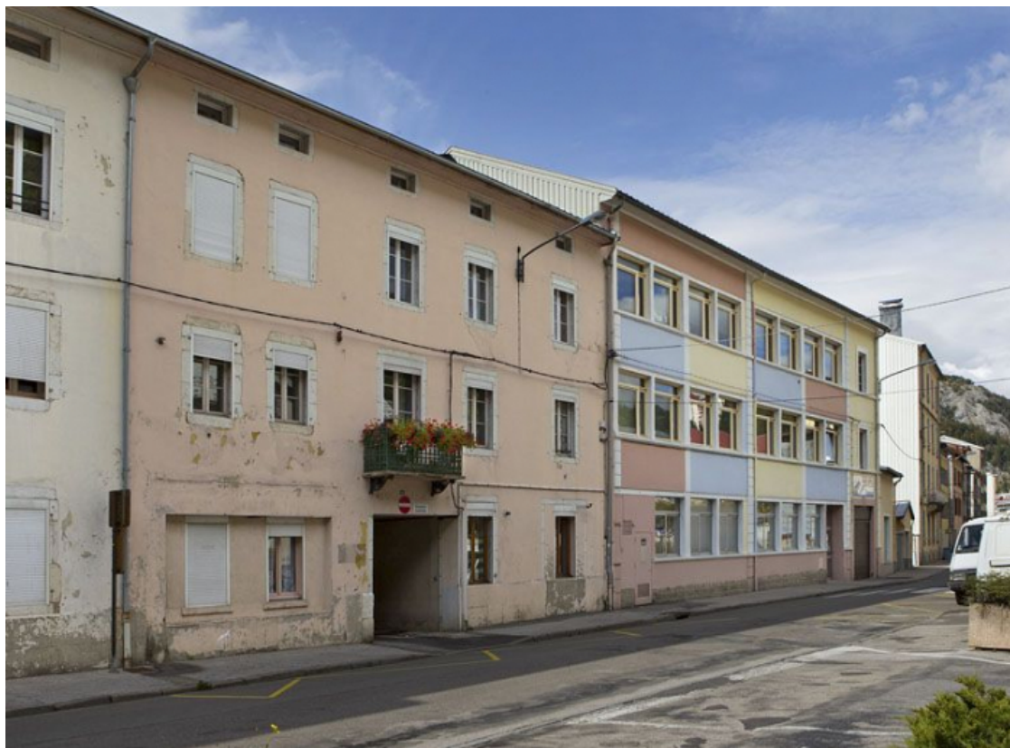
Ancienne usine de lunetterie de la Société des Lunetiers (194 à 198 rue de la République).

39, Morez, 194 à 198 rue de la République