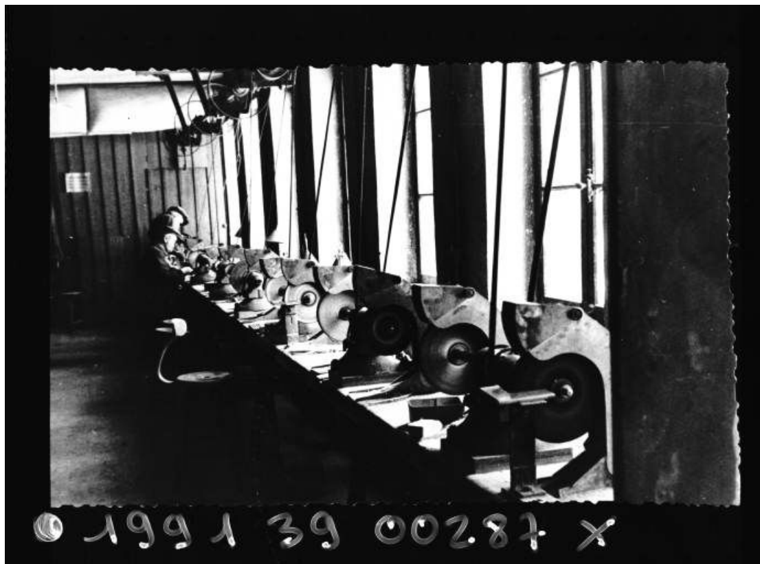
Polissage des lunettes au tampon.

39, Morez, 194 à 198 rue de la République