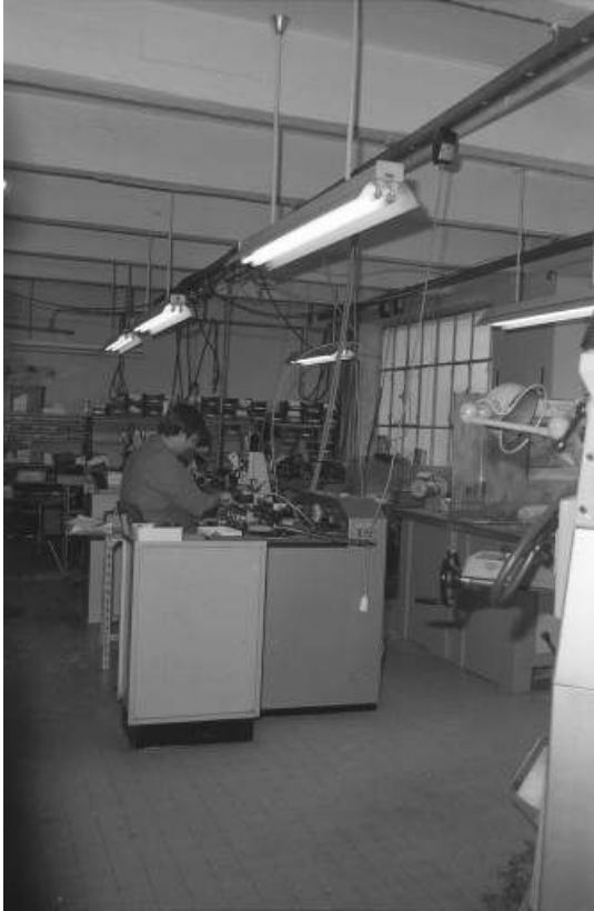
Intérieur d'un atelier dans le bâtiment d'origine.