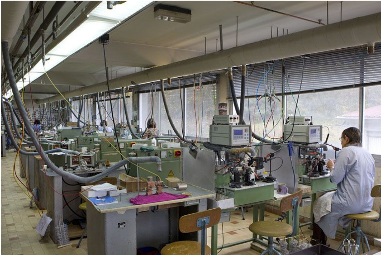
Usine de lunetterie Albin Paget : intérieur d'un atelier de soudage. 39, Morez, 15 rue Emile Zola