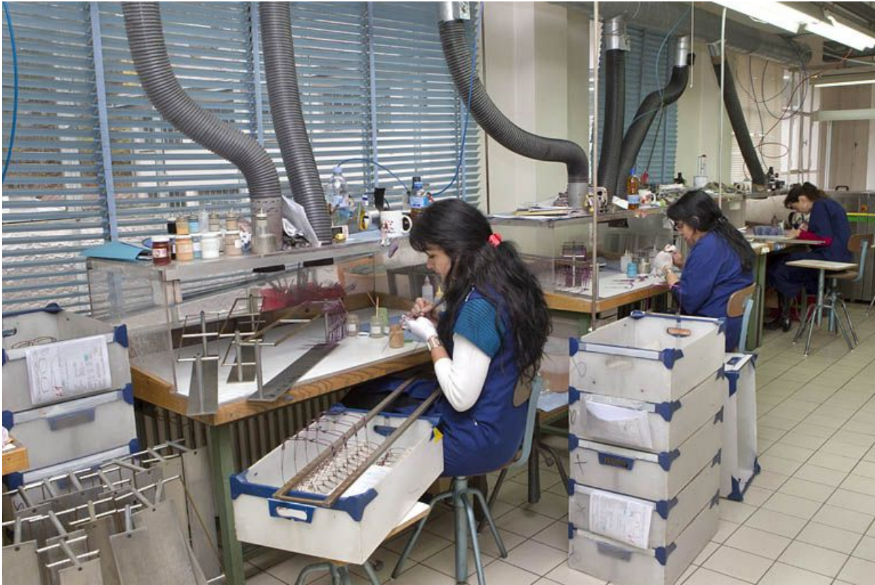
Usine de lunetterie Albin Paget : décoration de branches de lunettes.