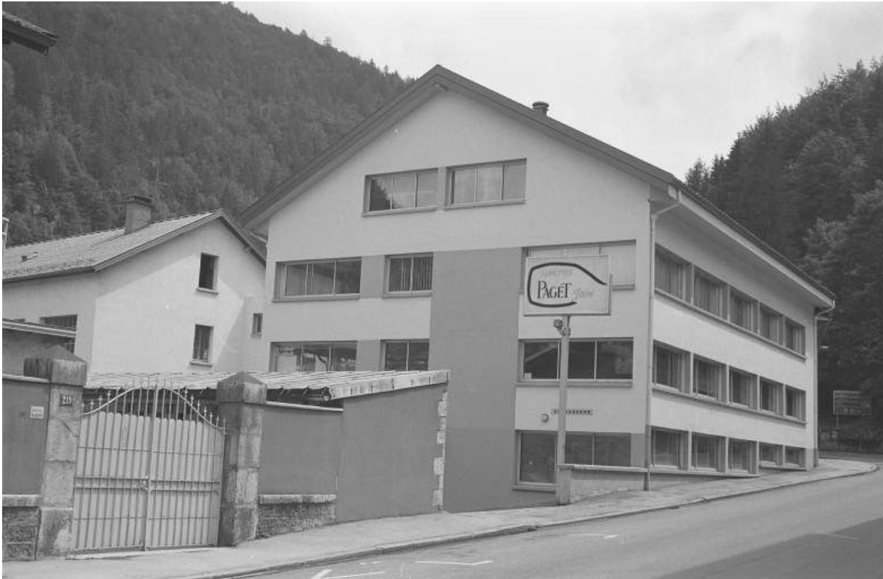
Façades postérieure et latérale droite des bureaux.