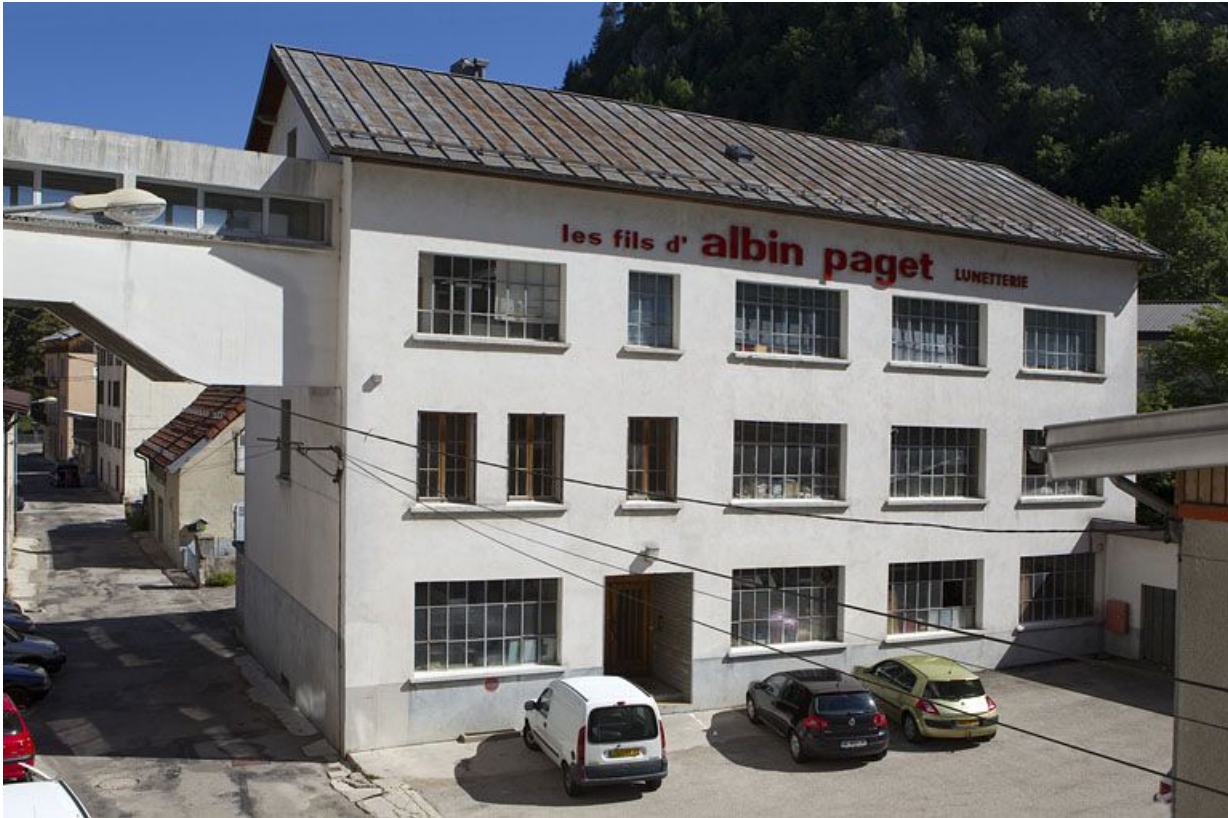
Usine de lunetterie Albin Paget (15 rue Emile Zola et 221 rue de la République).