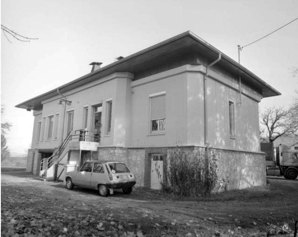
Façade postérieure vue de trois quarts droite.