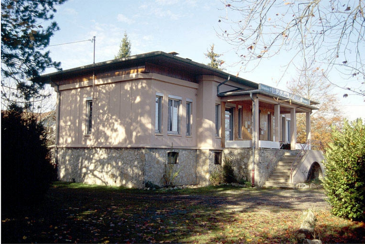
Façade antérieure vue de trois quarts gauche.