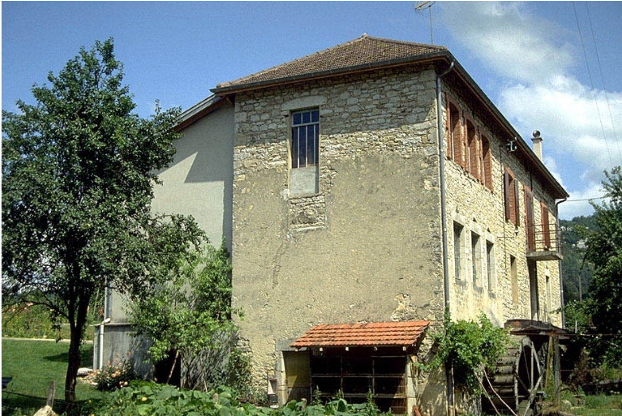
Façades postérieure et latérale droite.