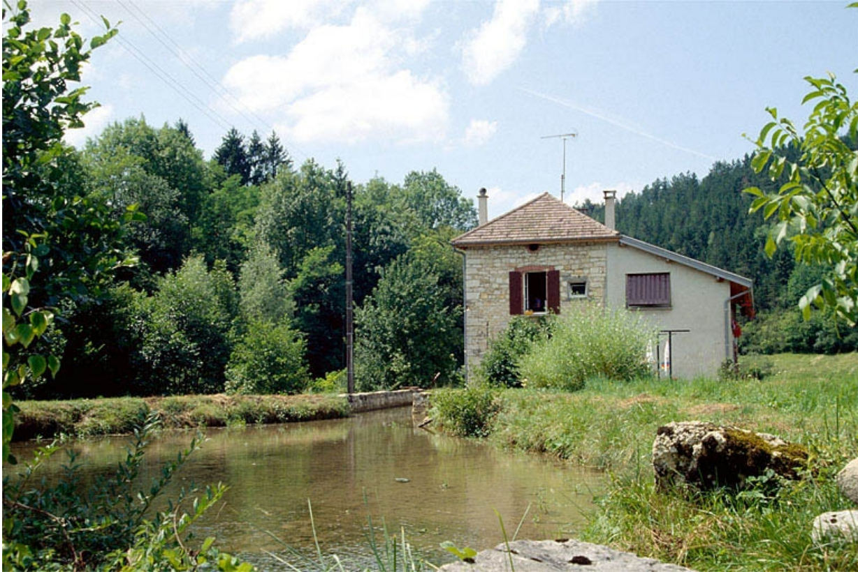
Bassin de retenue et façade latérale gauche.