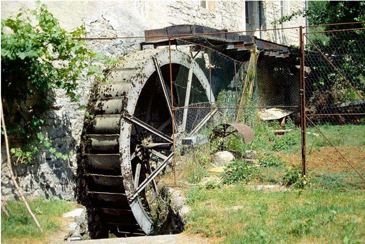
Roue en dessus et conduite d'amenée.