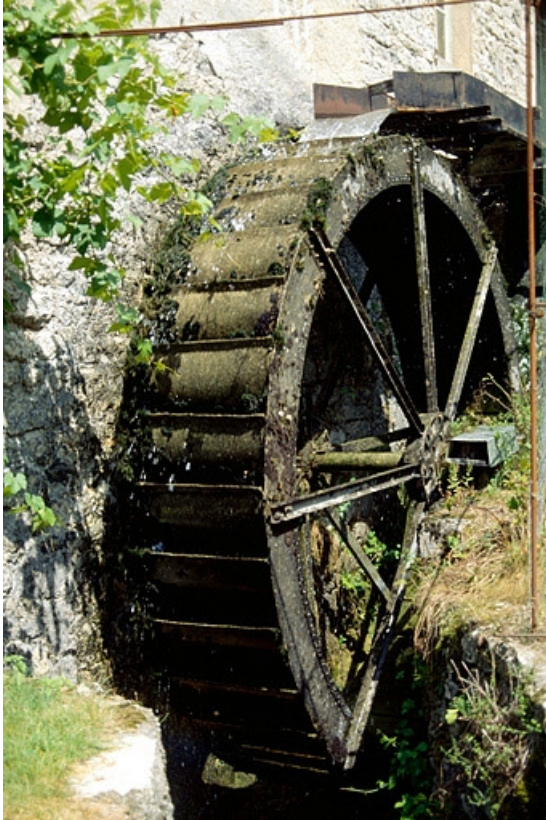
Roue en dessus.