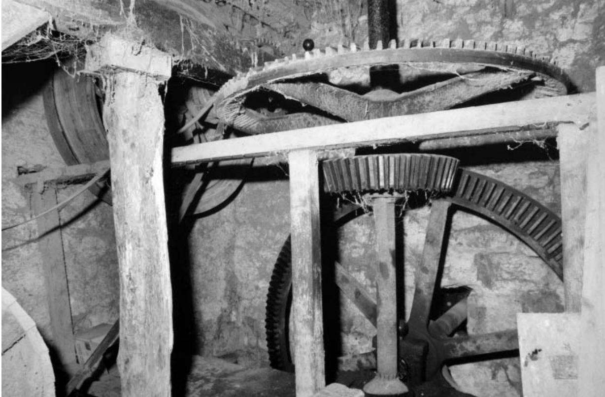
Transmission de la roue en dessus.