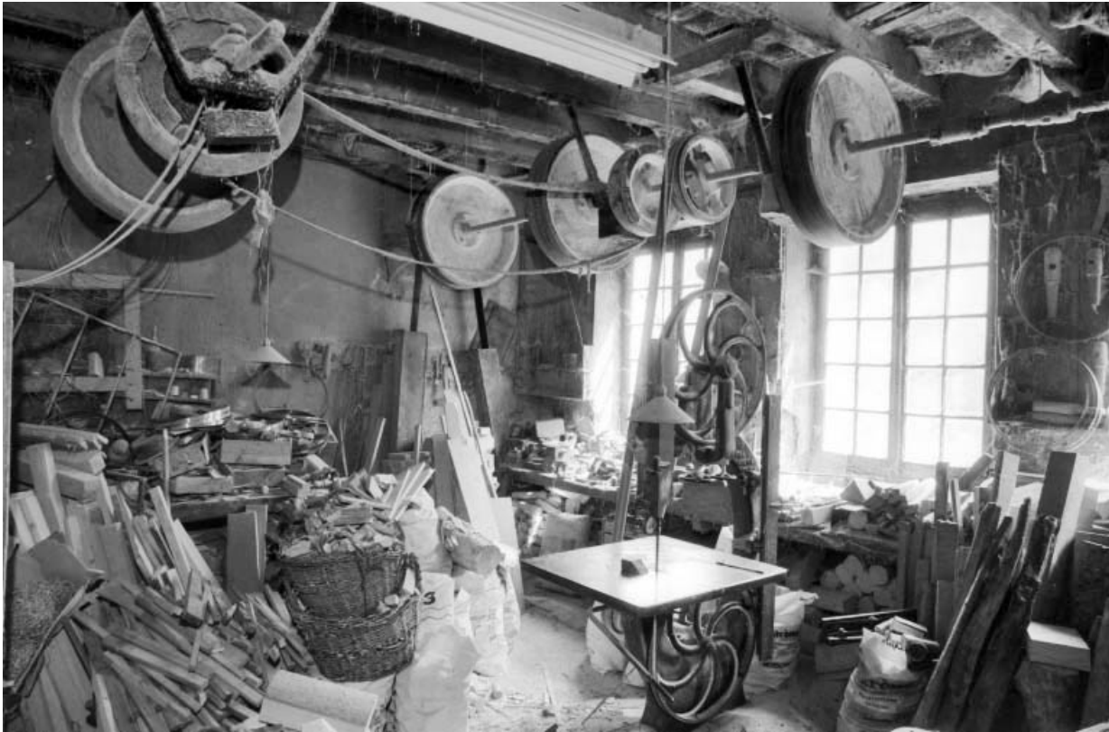
Intérieur de l'atelier de tournerie.