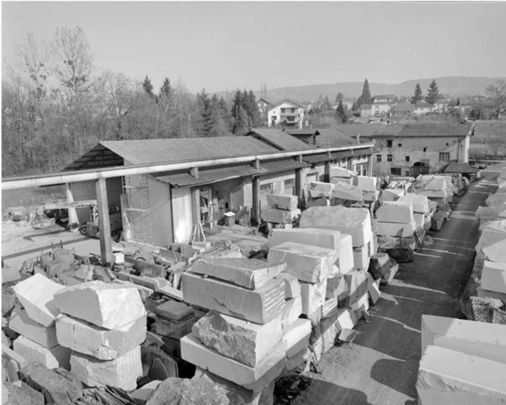
Vue d'ensemble des bâtiments depuis l'ouest.