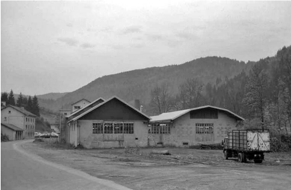
Vue d'ensemble de la façade postérieure.