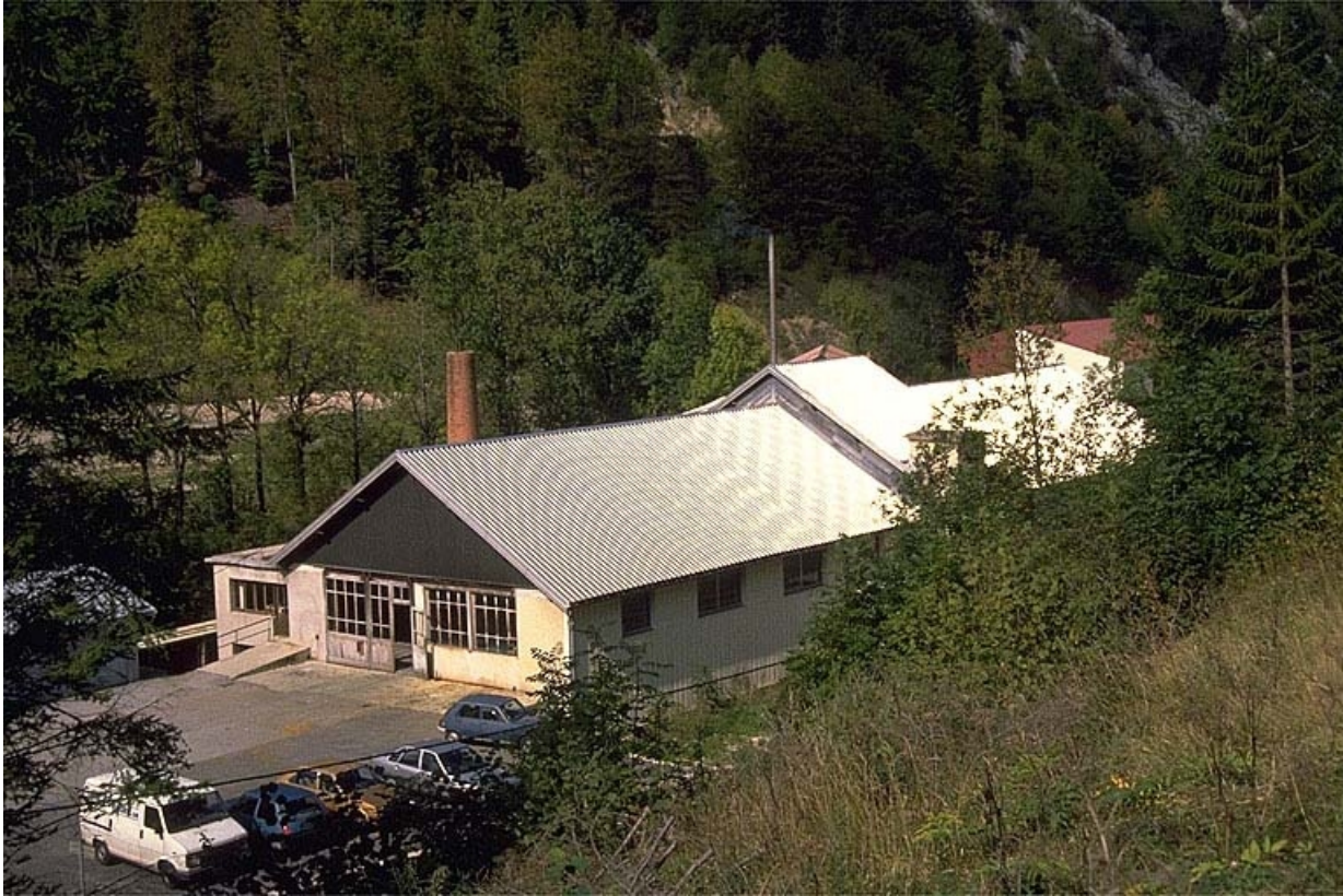
Vue plongeante sur la façade antérieure.