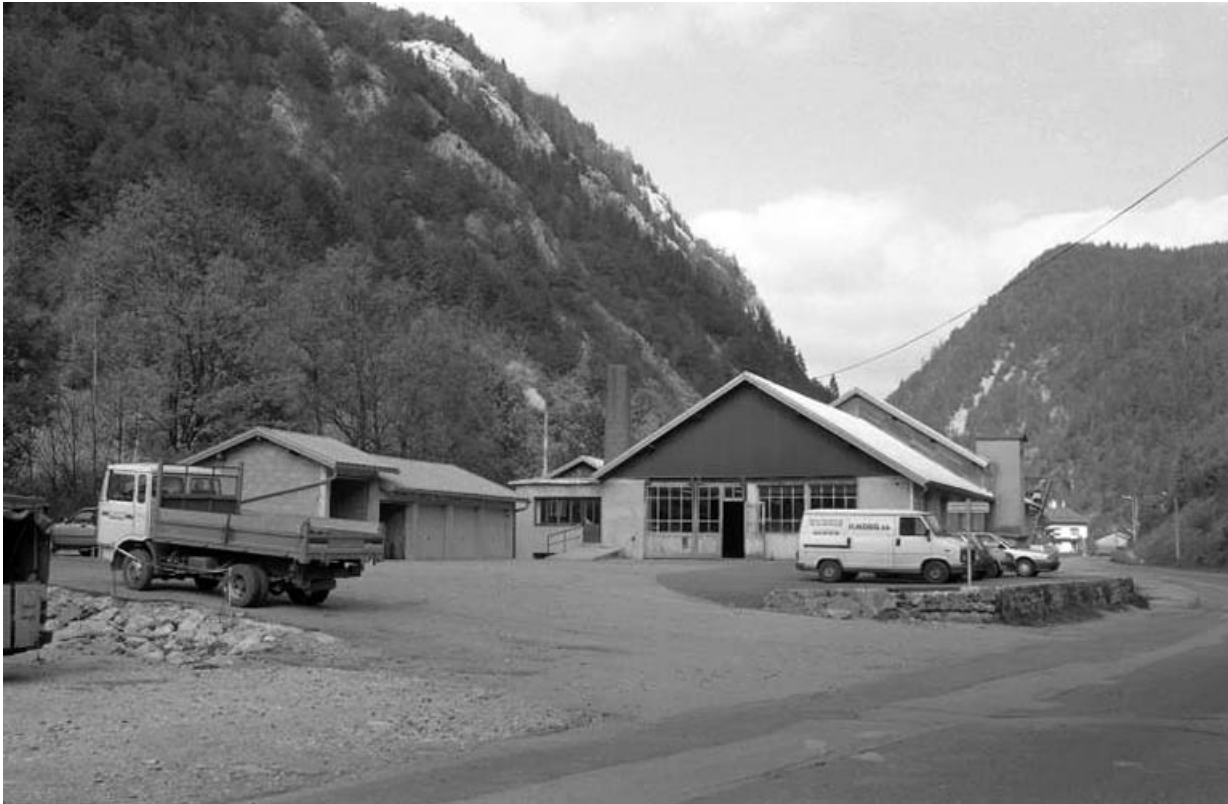
Vue d'ensemble de la façade antérieure.