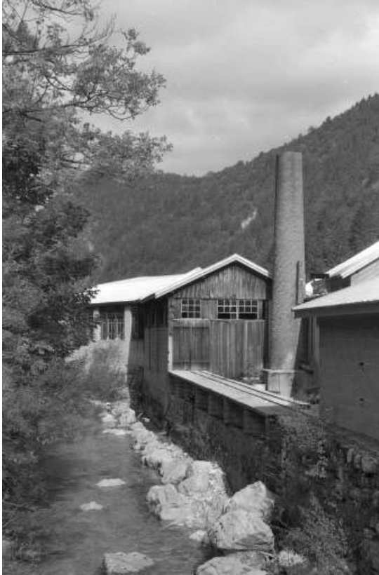
Cheminée d'usine et cours d'eau.