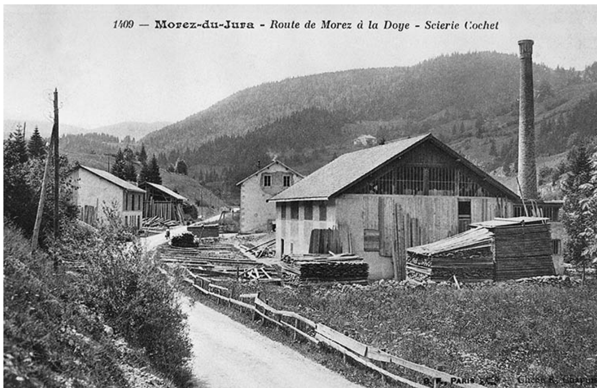
Morez-du-Jura - Route de Morez à la Doye - Scierie Cochet.