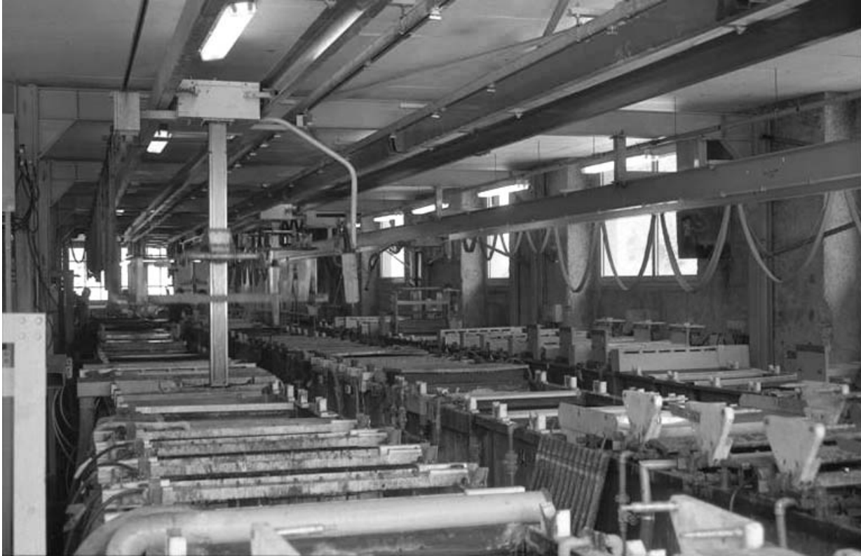
Intérieur de l'atelier de fabrication.