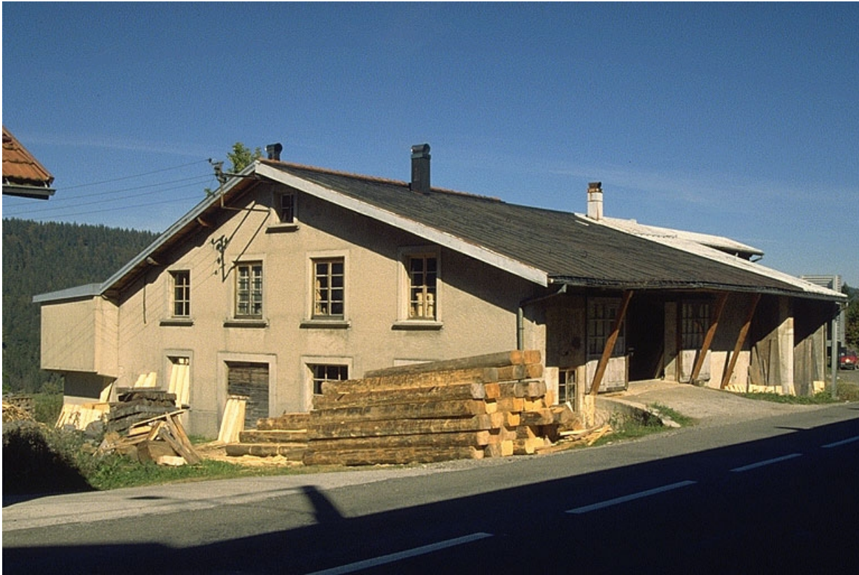
Scierie vue de trois quarts gauche.