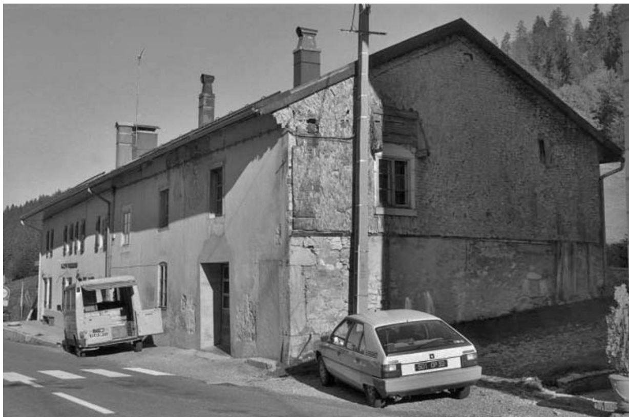
Atelier de montage.