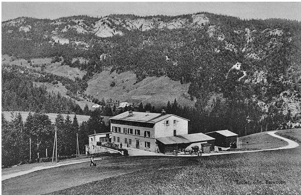
[Vue d'ensemble depuis l'est]. 39, Prémanon, lieudit : les Rivières