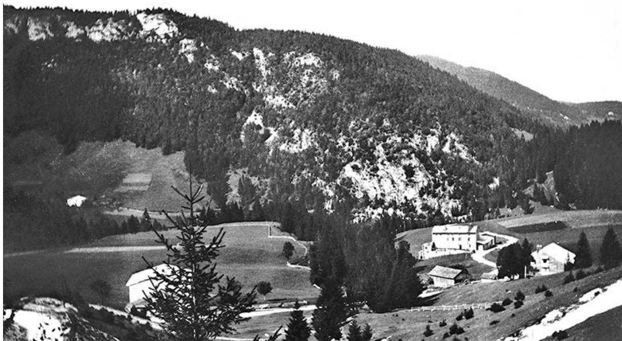
[L'usine vue depuis la route de Prémanon].