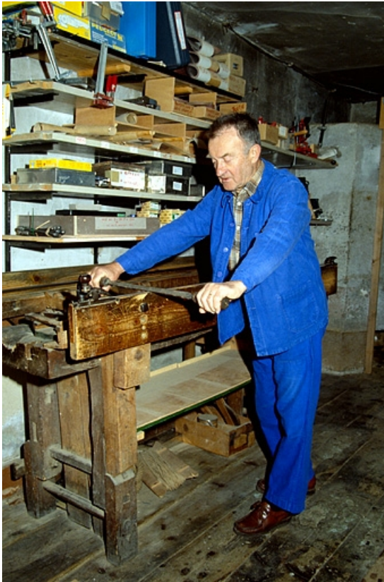
Décapage d'une bande de métal (sur le banc à racler). 39, Longchaumois Grande Rue 26