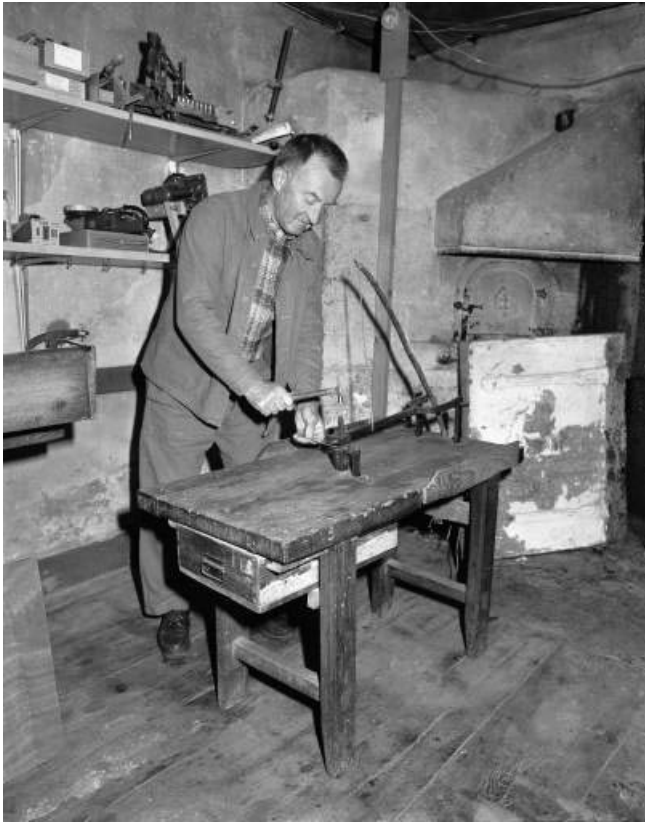
Poinçonnage d'une lame.