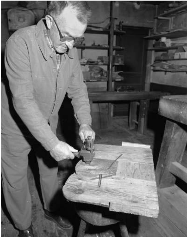
Mise au gabarit du "clou".