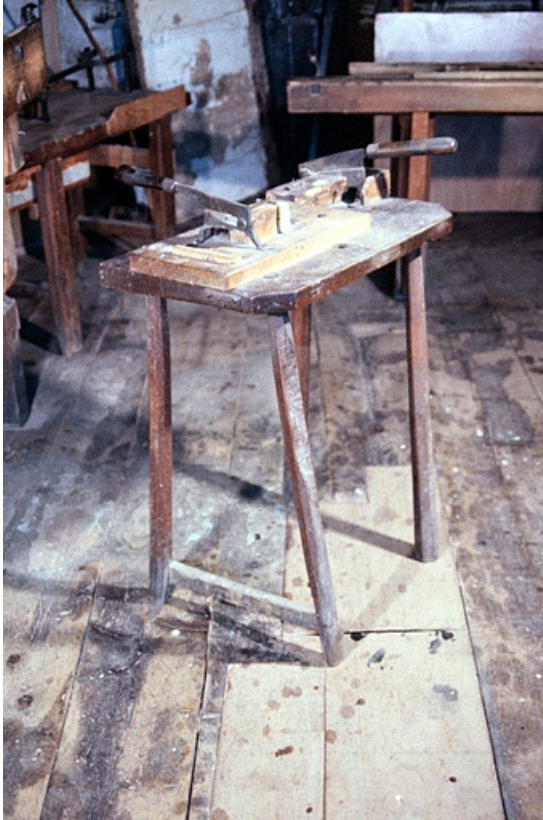
Banc à couper la première lame.