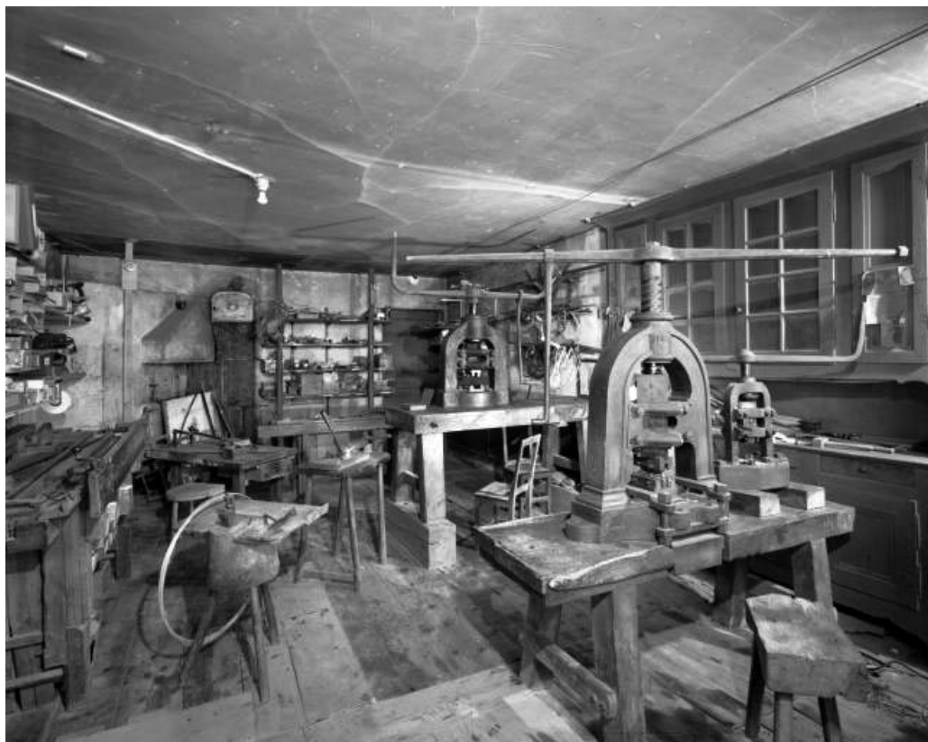
Intérieur de l'atelier de fabrication.