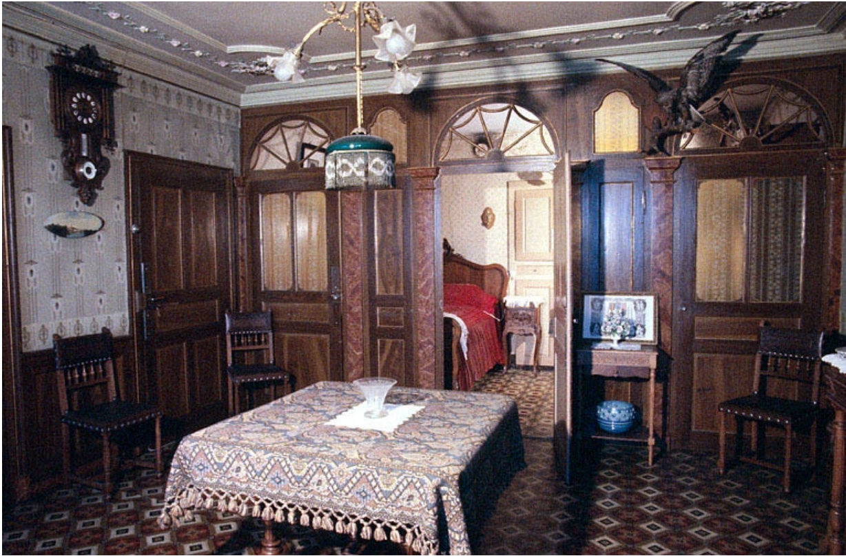
Salle de réception et alcôve.