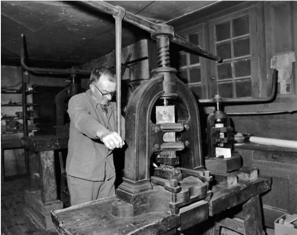
estampage d'une bande de métal.