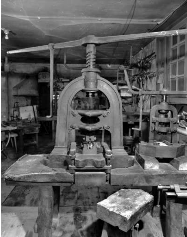
Détail de la grande presse à vis à balancier et de son poinçon. 39, Longchaumois Grande Rue 26