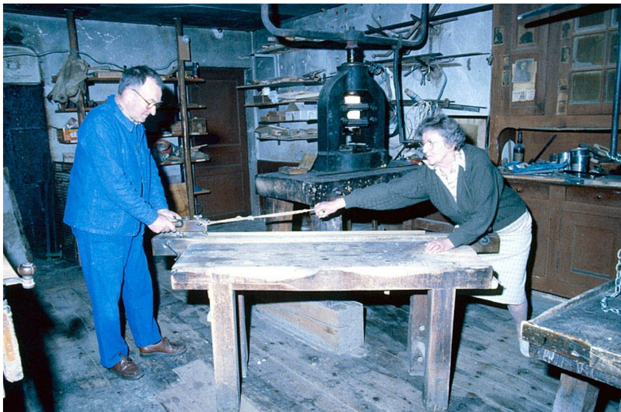
Découpage d'une bande de métal.