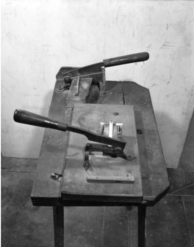
Vue plongeante sur le banc à couper la première lame.