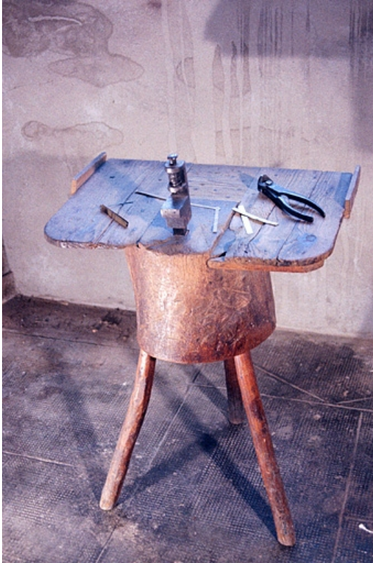
Banc à clouer.