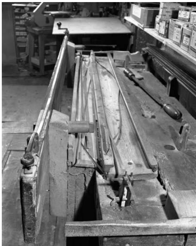
Banc à racler : système de fixation de la lame à gauche, système d'ébarbage au premier plan.