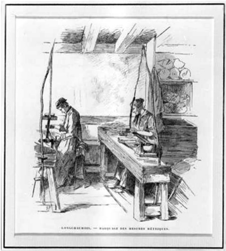
Longchaumois. - Marquage des mesures métriques.