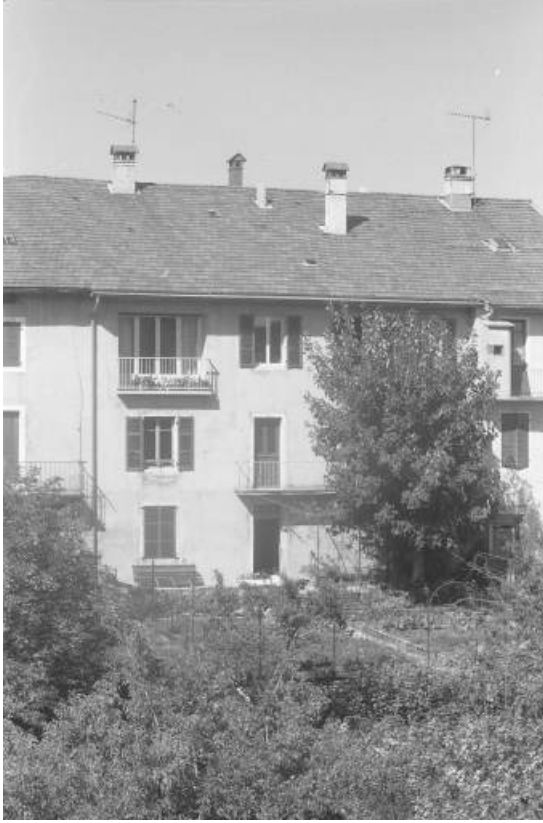
Vue rapprochée de la façade postérieure.