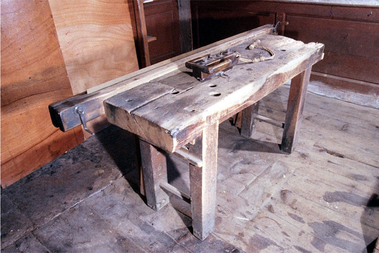
Banc à découper et son "rabot".