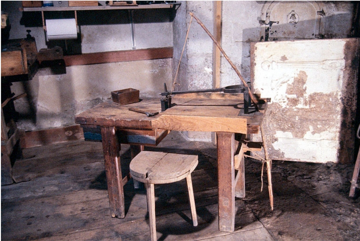
Banc à poinçonner.