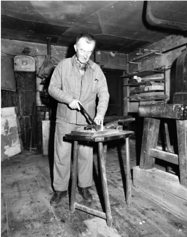
Coupage de la première lame.