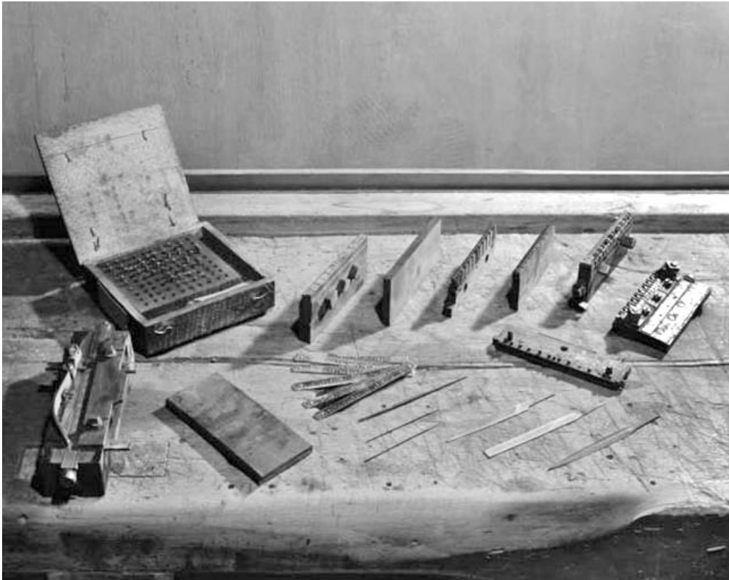
Poinçons à différents stades de fabrication.