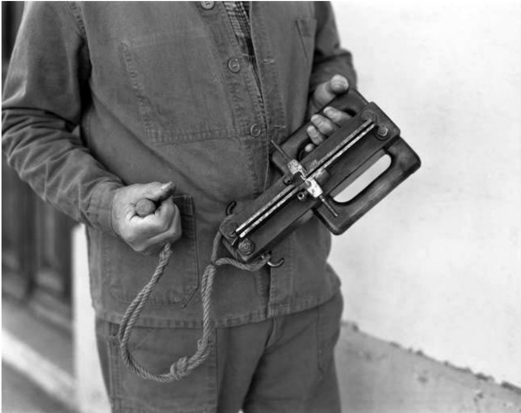
"Rabot" à découper, face inférieure.