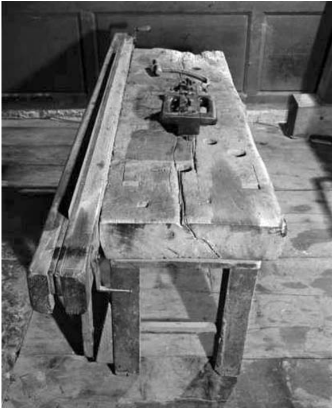
Vue plongeante sur le banc à découper.