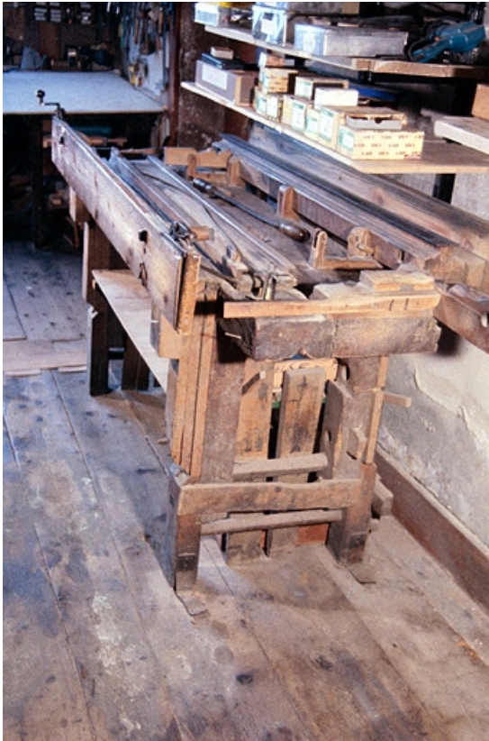
Banc à racler vu de trois quarts droite.