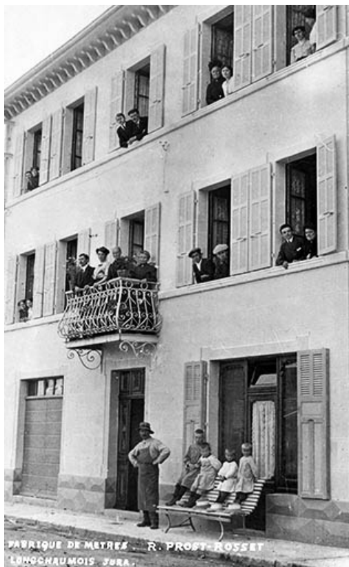
Fabrique de mètres R. Prost-Rosset. Longchaumois Jura.