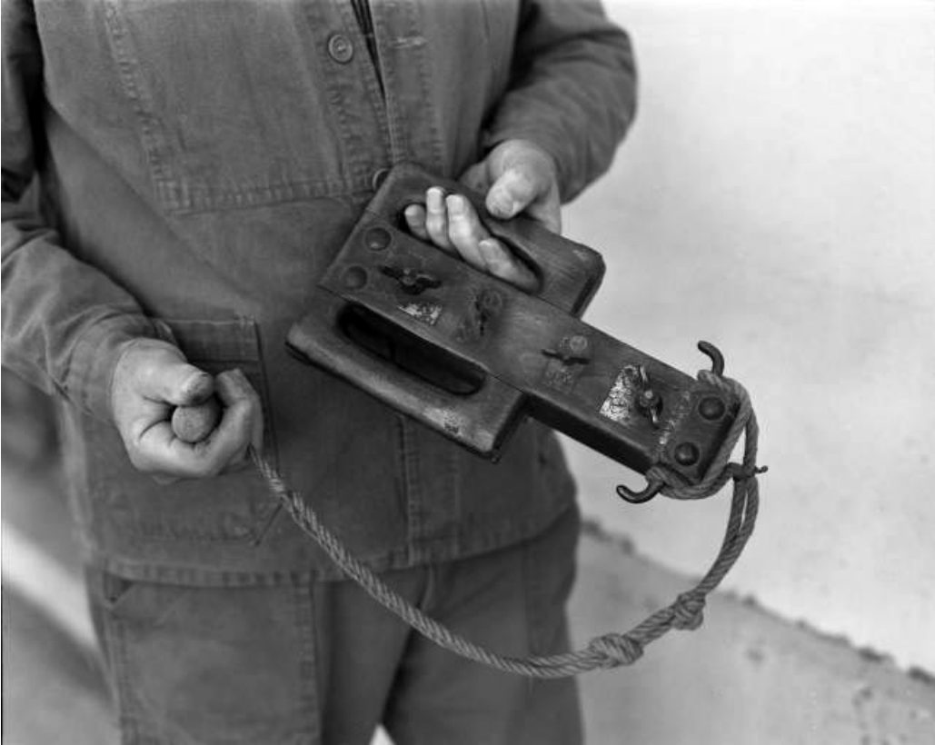
"Rabot" à découper, face supérieure.