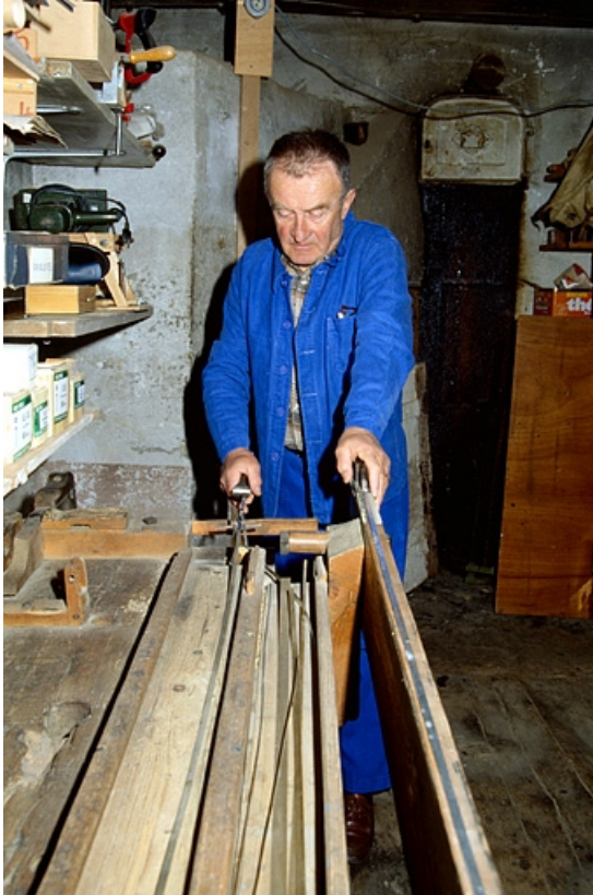
Ebarbage d'une bande de métal (sur le banc à racler).