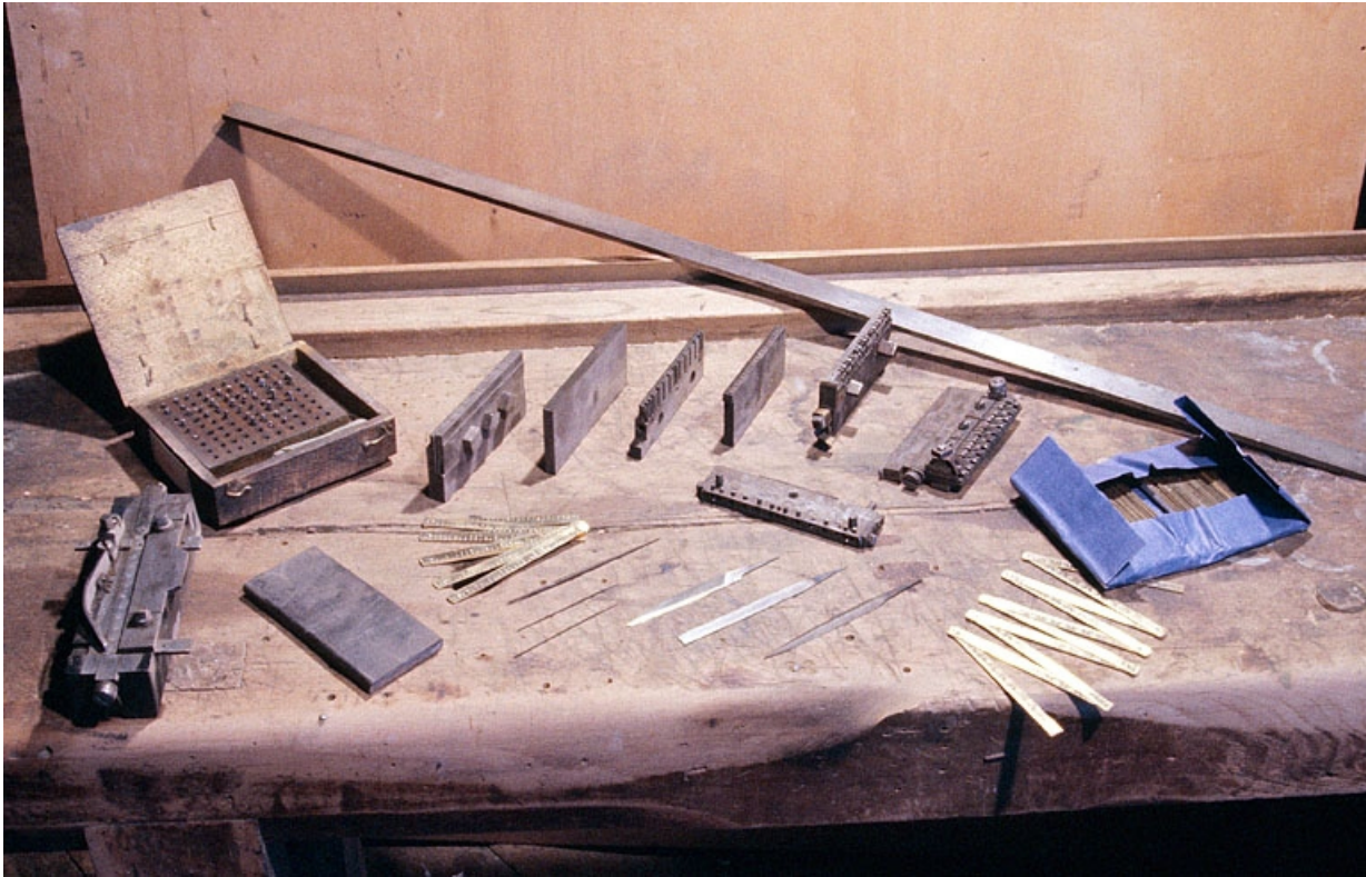
Poinçons, mètre-étalon et mètres pliants.