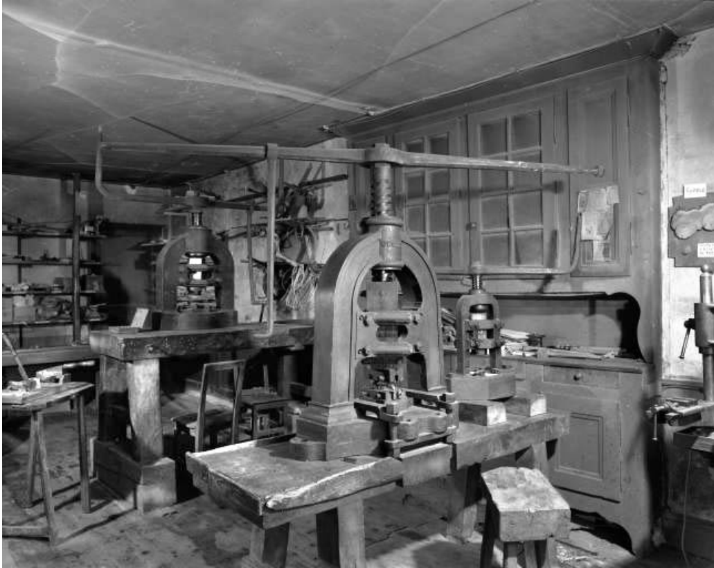
Presses à vis à balancier.