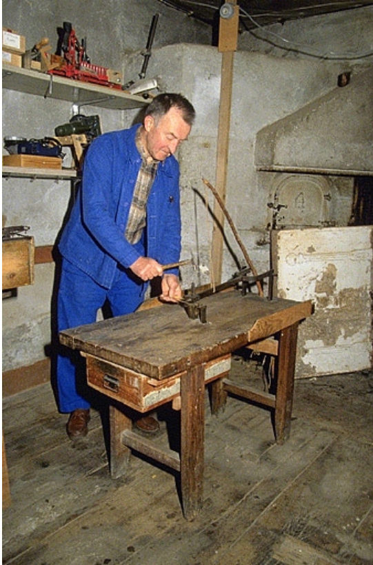
Poinçonnage d'une lame.