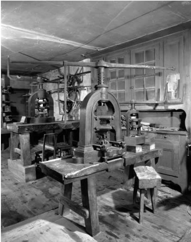
Grande presse à vis à balancier, vue de trois quarts.