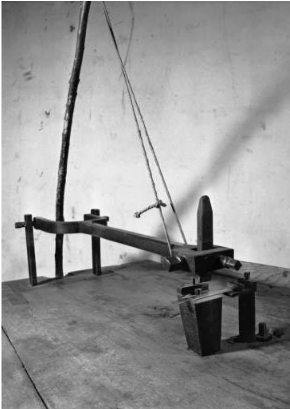
Banc à poinçonner : système de poinçonnage.