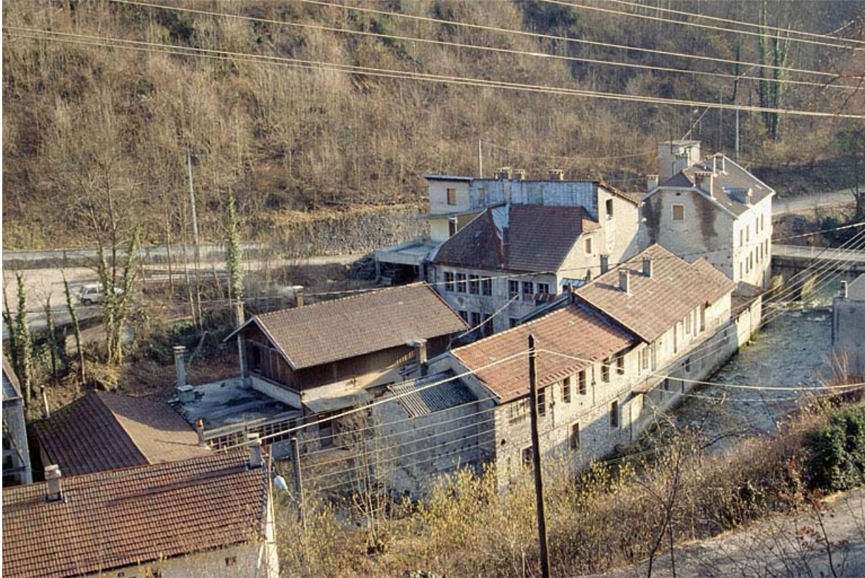
Vue d'ensemble plongeante depuis le nord-ouest.

39, Saint-Claude, 1, 3 rue du Moulin Neuf