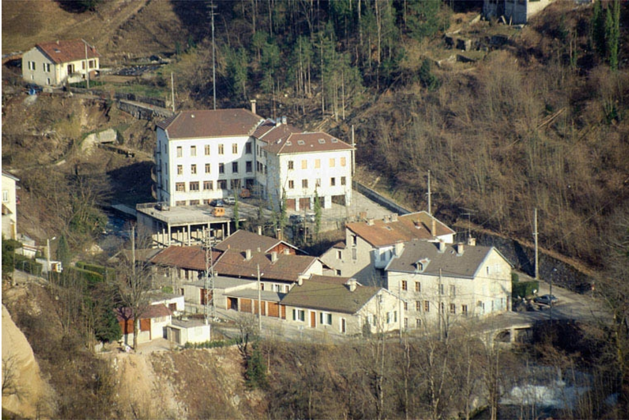
Vue d'ensemble plongeante depuis l'ouest.