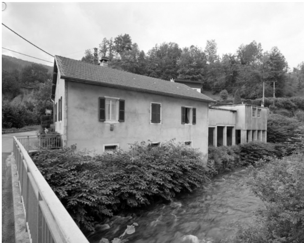
Façade sur l'Abîme de la maison et des remises à automobile.

39, Saint-Claude, 1, 3 rue du Moulin Neuf