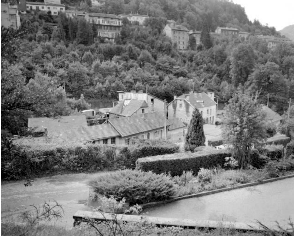
Vue d'ensemble plongeante depuis le nord-ouest.

39, Saint-Claude, 1, 3 rue du Moulin Neuf