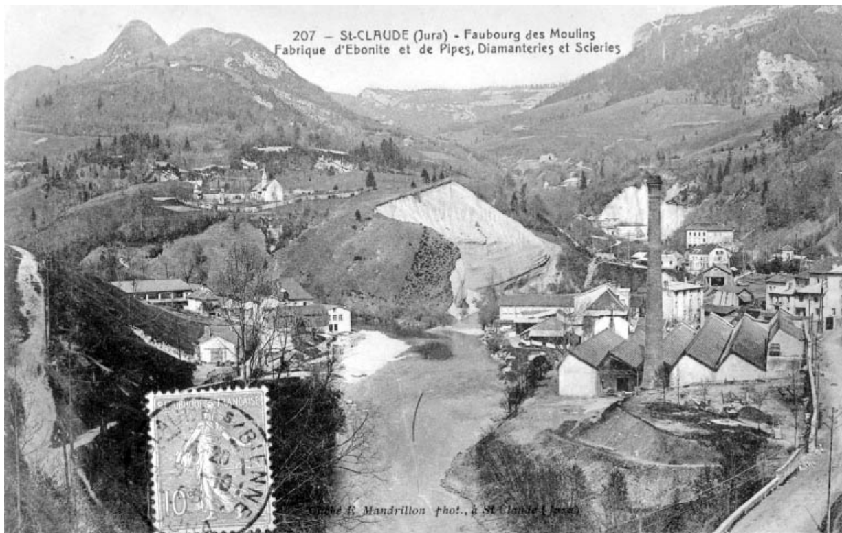
St-Claude (Jura) - Faubourg des Moulins. Fabrique d'Ebonite et de Pipes, Diamanteries et Scieries.

39, Saint-Claude, 2 à 8 rue du Faubourg des Moulins