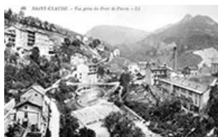
Saint-Claude. - Vue prise du Pont de Pierre.

39, Saint-Claude, 2 à 8 rue du Faubourg des Moulins