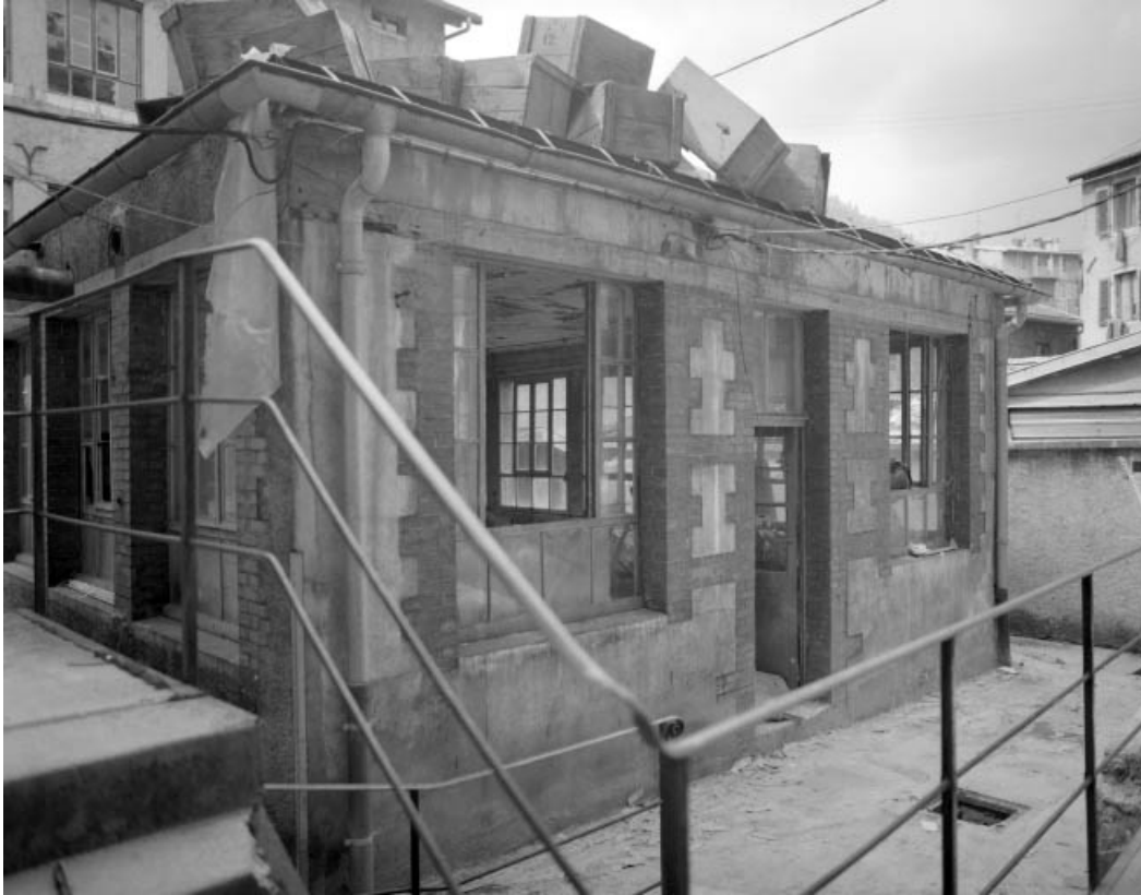
Atelier dans la cour : façade antérieure.

39, Saint-Claude, 4, 8, 10 rue du Faubourg Marcel