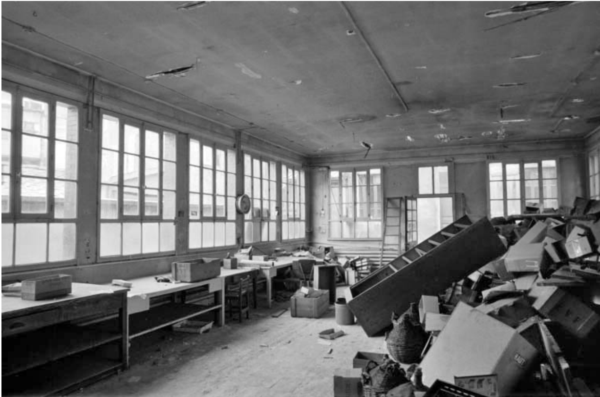
Atelier dans la cour : intérieur.

39, Saint-Claude, 4, 8, 10 rue du Faubourg Marcel