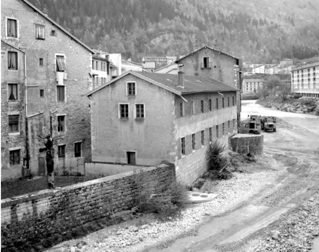
Séchoir à ébauchons : façades postérieure et latérale gauche.

39, Saint-Claude, 4, 8, 10 rue du Faubourg Marcel