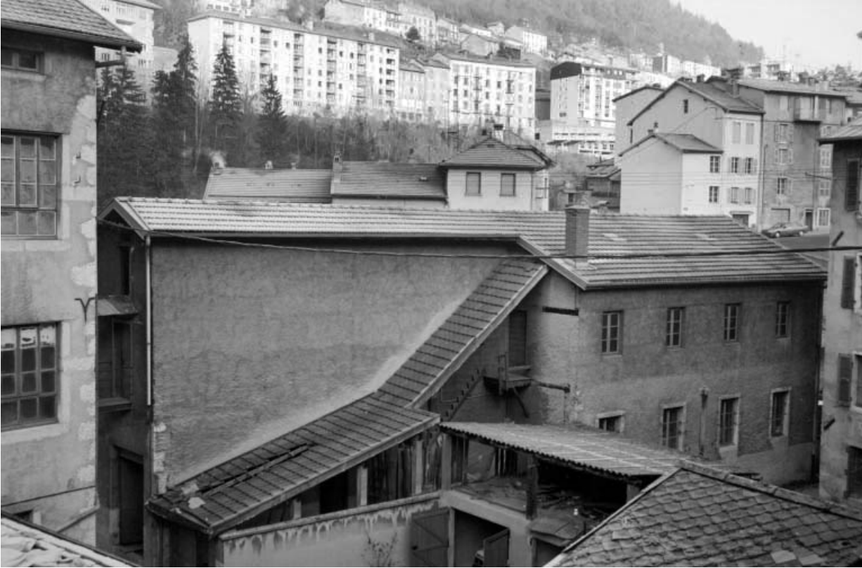
Séchoir à ébauchons : façade latérale droite. 39, Saint-Claude, 4, 8, 10 rue du Faubourg Marcel