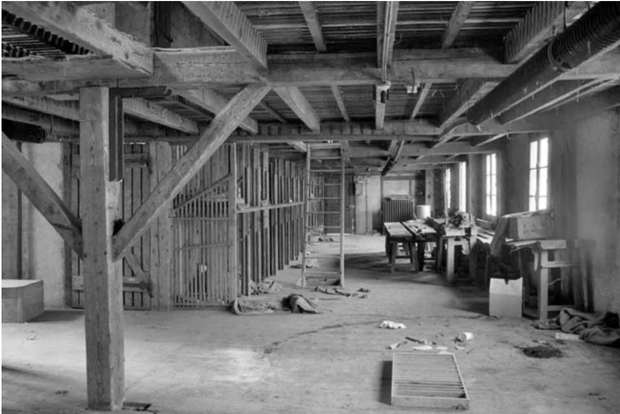
Séchoir à ébauchons : intérieur d'un atelier au rez-de-chaussée.

39, Saint-Claude, 4, 8, 10 rue du Faubourg Marcel