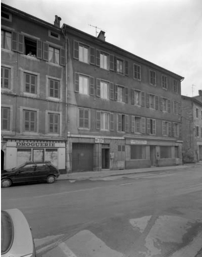
Immeuble : façade antérieure.

39, Saint-Claude, 4, 8, 10 rue du Faubourg Marcel