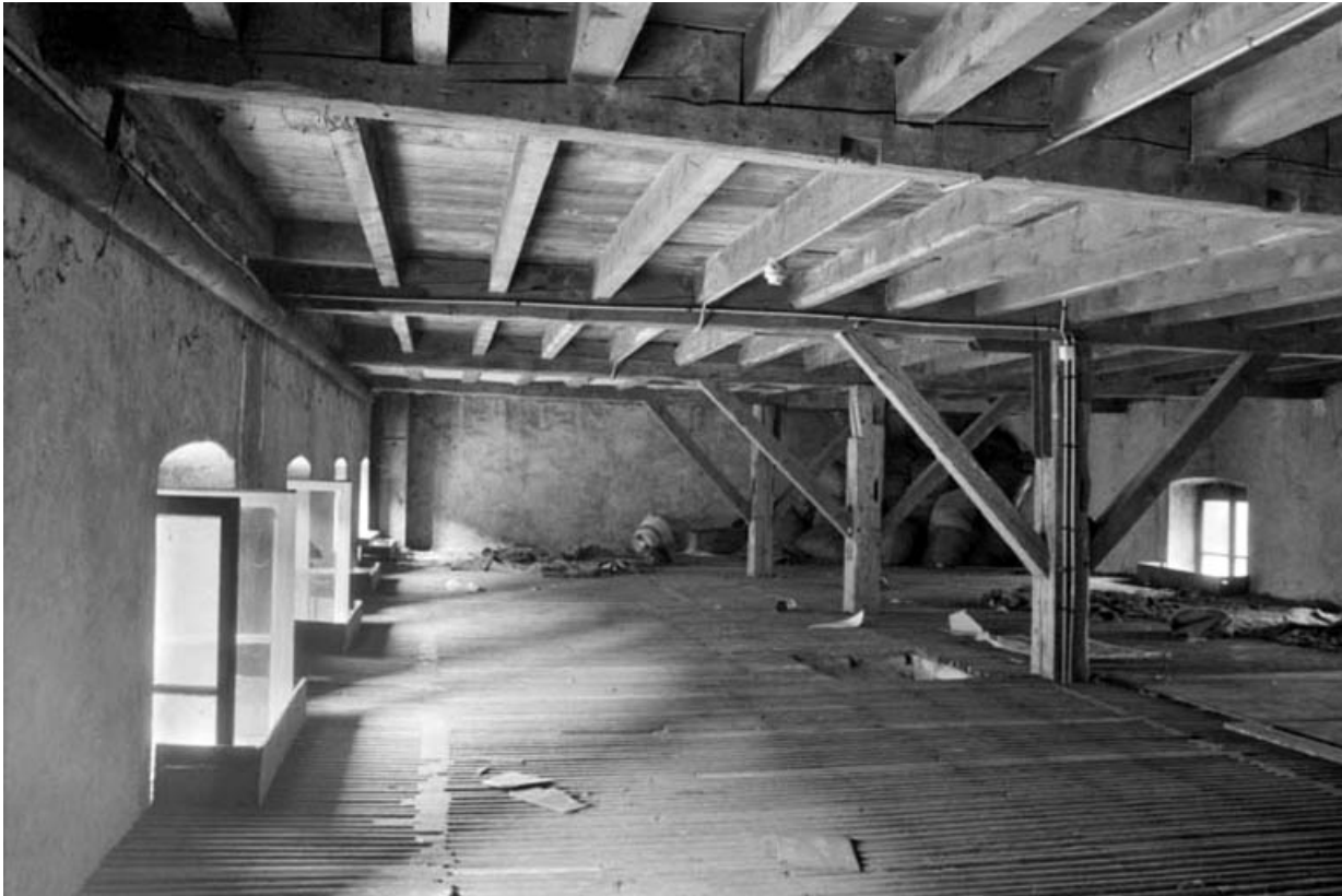
Séchoir à ébauchons : intérieur d'un niveau de séchage.

39, Saint-Claude, 4, 8, 10 rue du Faubourg Marcel