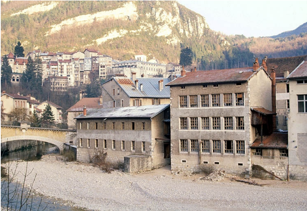
Séchoir à ébauchons et atelier de fabrication : façade postérieure.

39, Saint-Claude, 4, 8, 10 rue du Faubourg Marcel