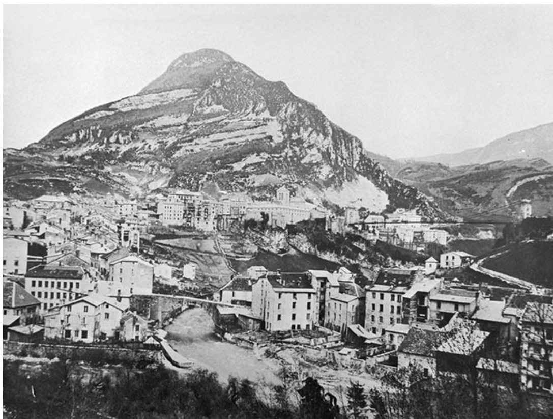
Vue d'ensemble du quartier avant la construction de l'usine.

39, Saint-Claude, 4, 8, 10 rue du Faubourg Marcel