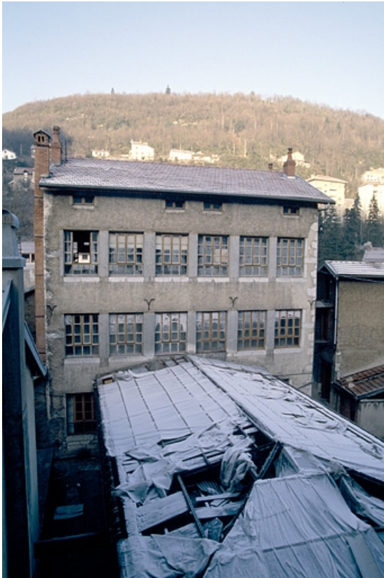
Atelier de fabrication : façade antérieure.

39, Saint-Claude, 4, 8, 10 rue du Faubourg Marcel