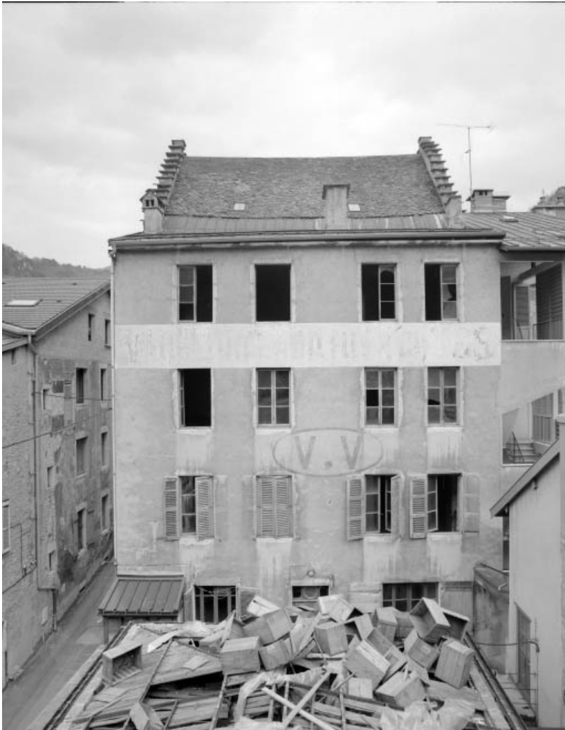
Immeuble : façade postérieure.

39, Saint-Claude, 4, 8, 10 rue du Faubourg Marcel