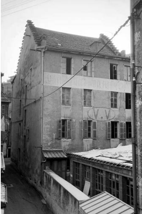
Immeuble : façade postérieure de trois quarts gauche.

39, Saint-Claude, 4, 8, 10 rue du Faubourg Marcel