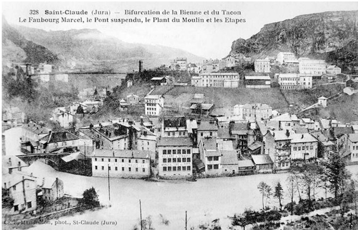
Saint-Claude (Jura) - Bifurcation de la Bienne et du Tacon. Le Faubourg Marcel, le Pont suspendu, le Plant du Moulin et les Etapes. 39, Saint-Claude, 4, 8, 10 rue du Faubourg Marcel

Carte postale, s.d. [1er quart 20e siècle, entre 1901 et 1911], par Mandrillon, E. (photographe). Lieu de conservation : Archives communales, Saint-Claude