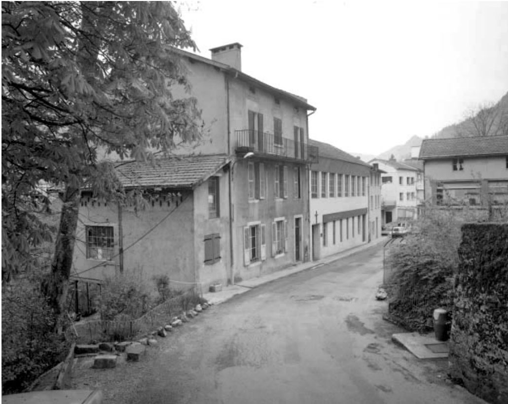
Façade antérieure de trois quarts gauche.