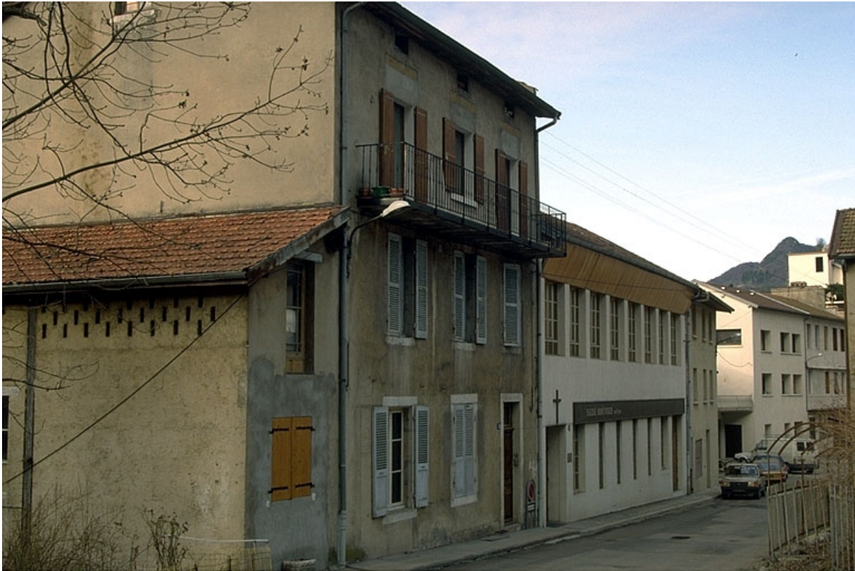
Façade antérieure de trois quarts gauche.