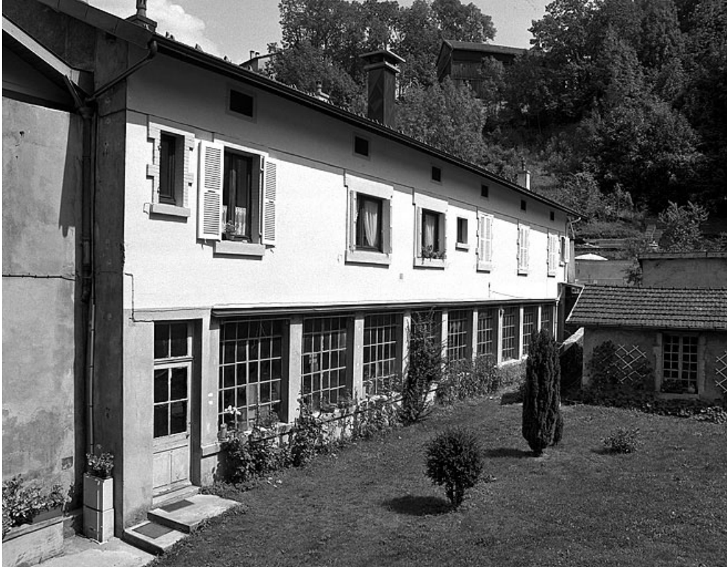
Façade antérieure de l'atelier de fabrication, de trois quarts gauche.

39, Saint-Claude, 41 rue du Faubourg Marcel