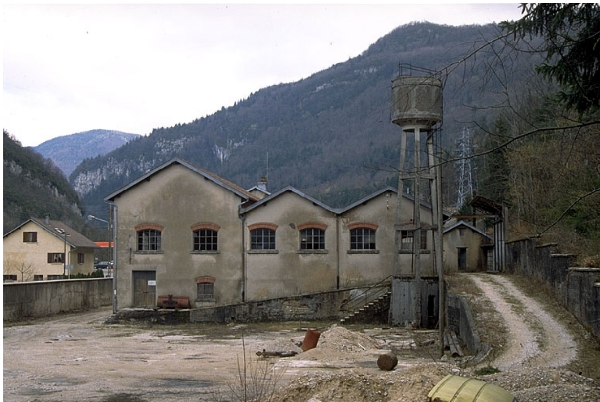
Cour, atelier de fabrication et château d'eau.