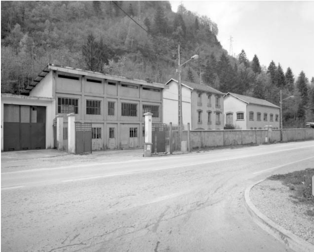
Vue d'ensemble des façades sur la route de Lyon.

39, Saint-Claude, 13 route de Lyon, lieudit : la Patience