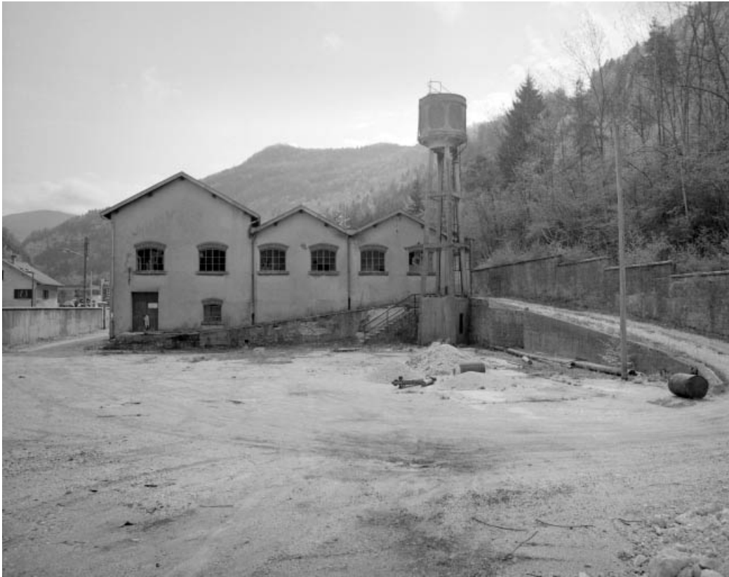
Cour, atelier de fabrication et château d'eau.

39, Saint-Claude, 13 route de Lyon, lieudit : la Patience