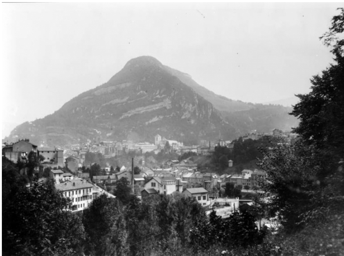
[Vue d'ensemble de la centrale depuis l'ouest].