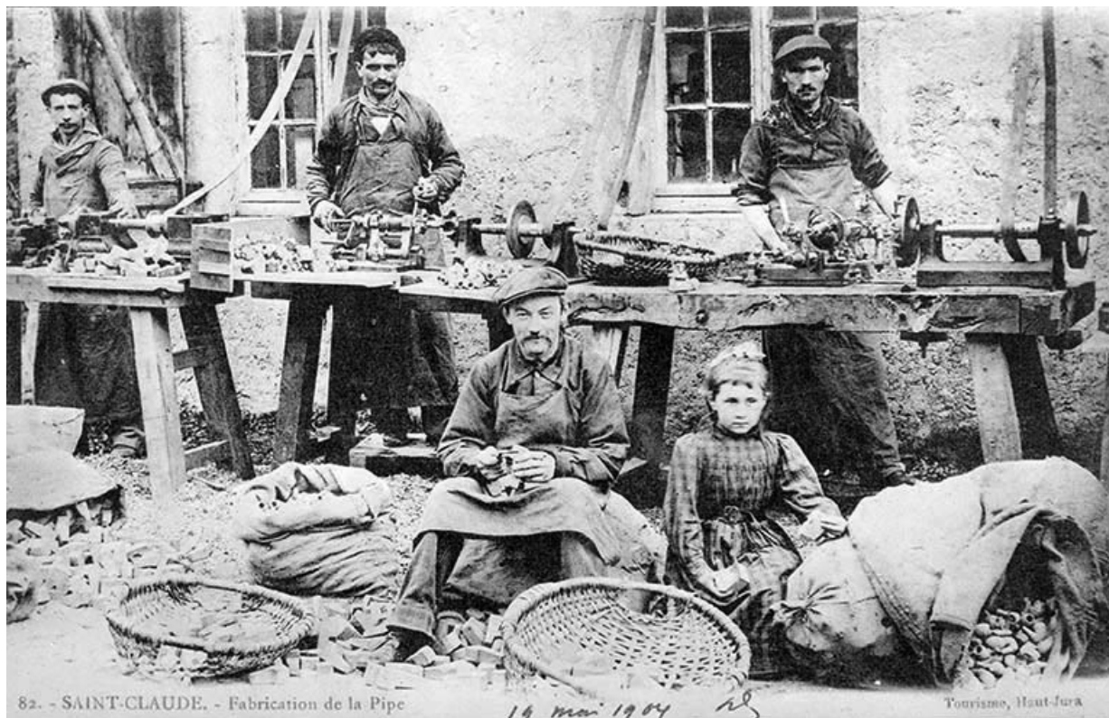
Saint-Claude. - Fabrication de la Pipe.

Carte postale, s.d. [limite 19e siècle 20e siècle, avant 1904]. Lieu de conservation : collection particulière