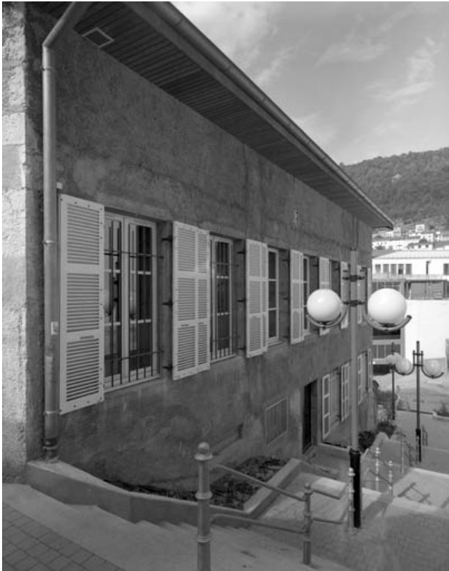
Bâtiment des bureaux vu de trois quarts gauche.

39, Saint-Claude, 3, 5 passage de la Cheneau