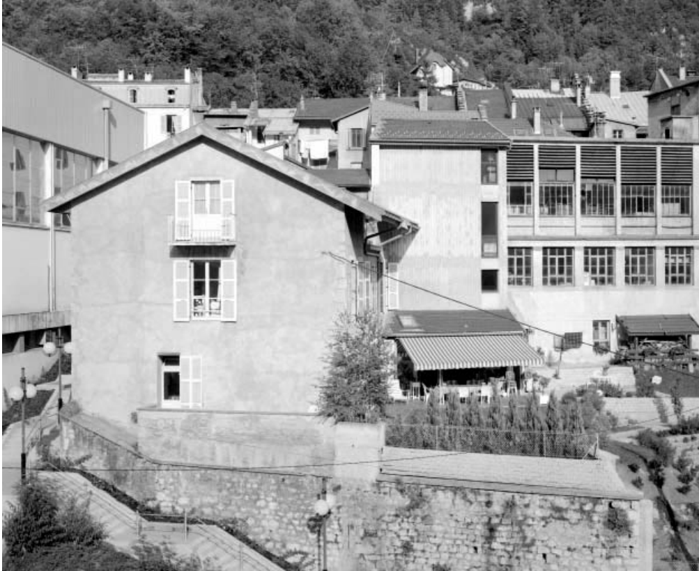
Bâtiment des bureaux et atelier de fabrication nord.

39, Saint-Claude, 3, 5 passage de la Cheneau