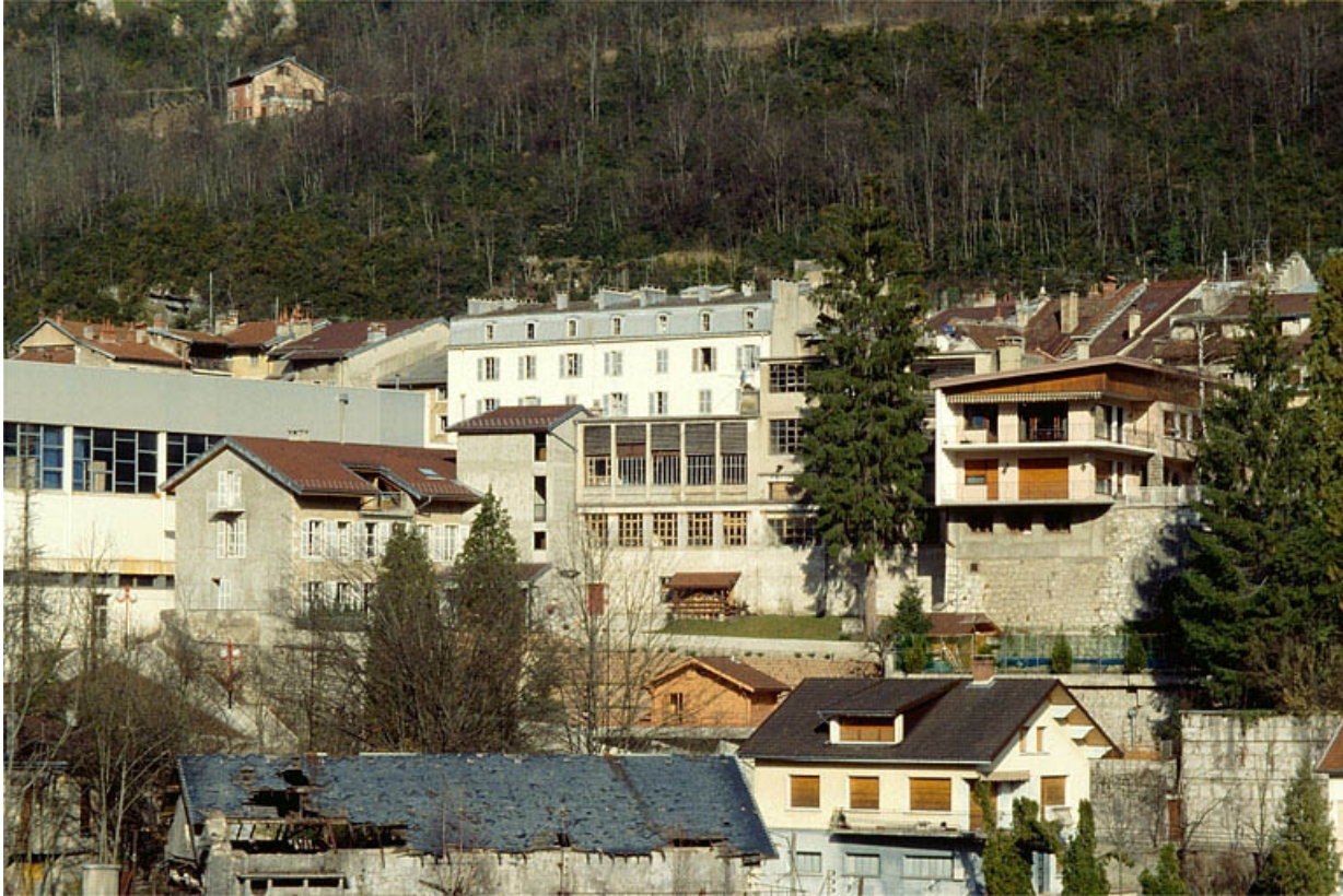
Vue d'ensemble depuis l'ouest.

39, Saint-Claude, 3, 5 passage de la Cheneau