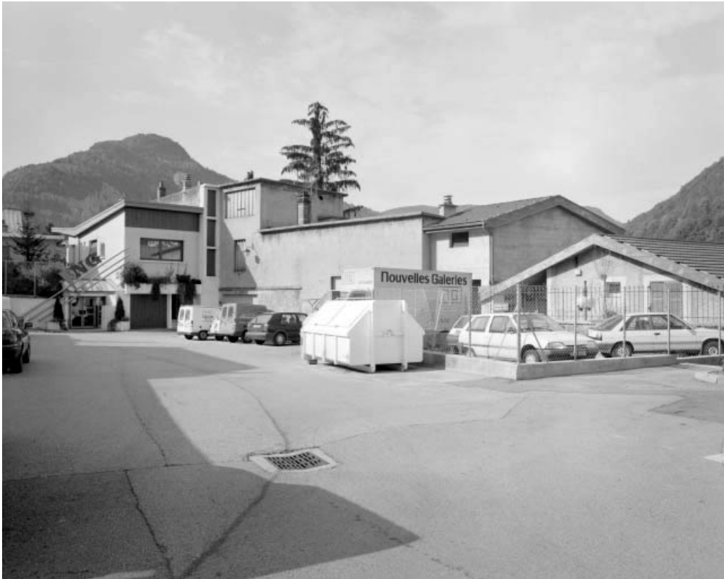
Façade orientale des bâtiments.

39, Saint-Claude, 3, 5 passage de la Cheneau