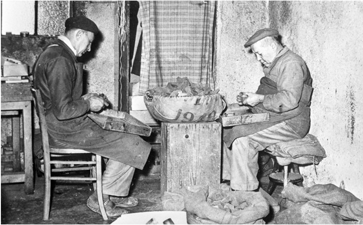
[Triage des ébauchons].

Photographie, s.d. [3e quart 20e siècle, années 1960].