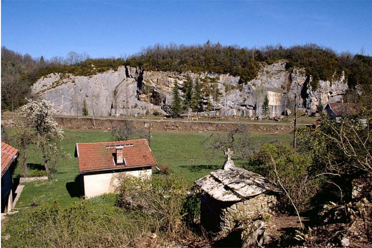
Vue d'ensemble du site depuis l'ouest.