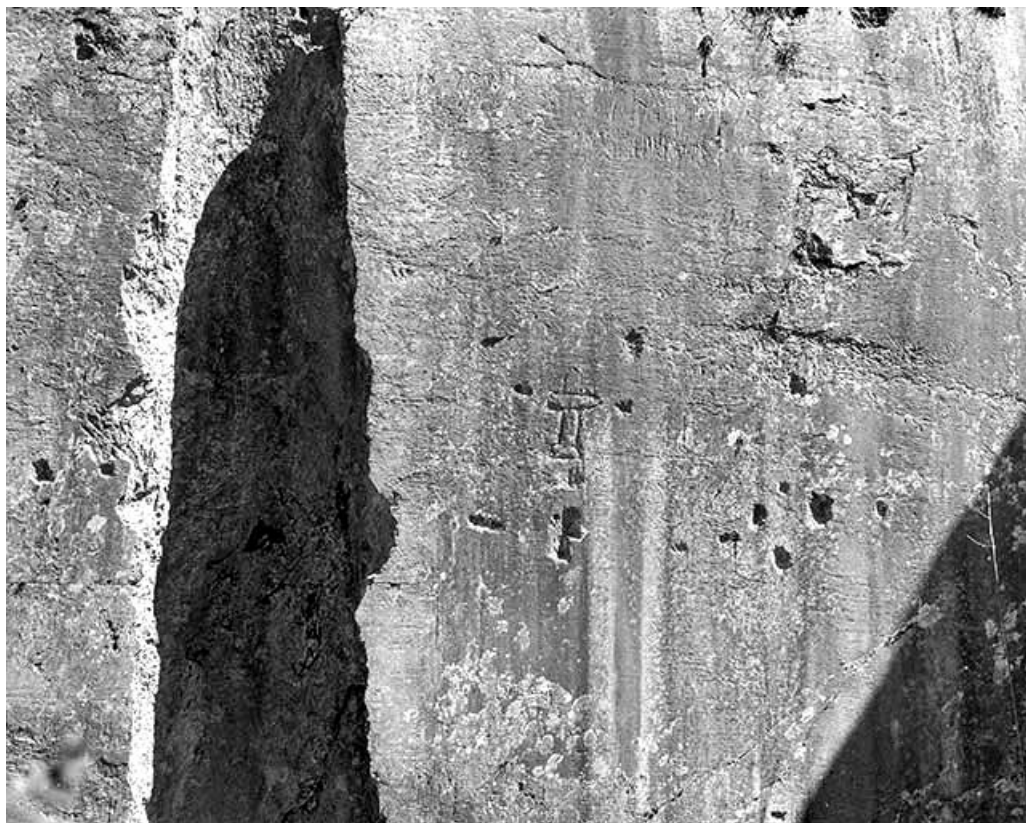
Carrière, partie nord : croix gravées dans la paroi.