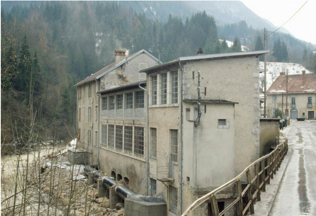
Façade de l'usine sur le Flumen.

39, Villard-Saint-Sauveur, lieudit : le Martinet