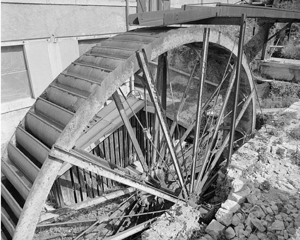
Détail de la roue hydraulique.

39, Villard-Saint-Sauveur, lieudit : Montbrillant