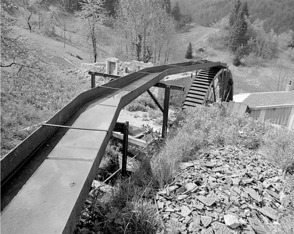
Canal d'amenée métallique et roue hydraulique.

39, Villard-Saint-Sauveur, lieudit : Montbrillant