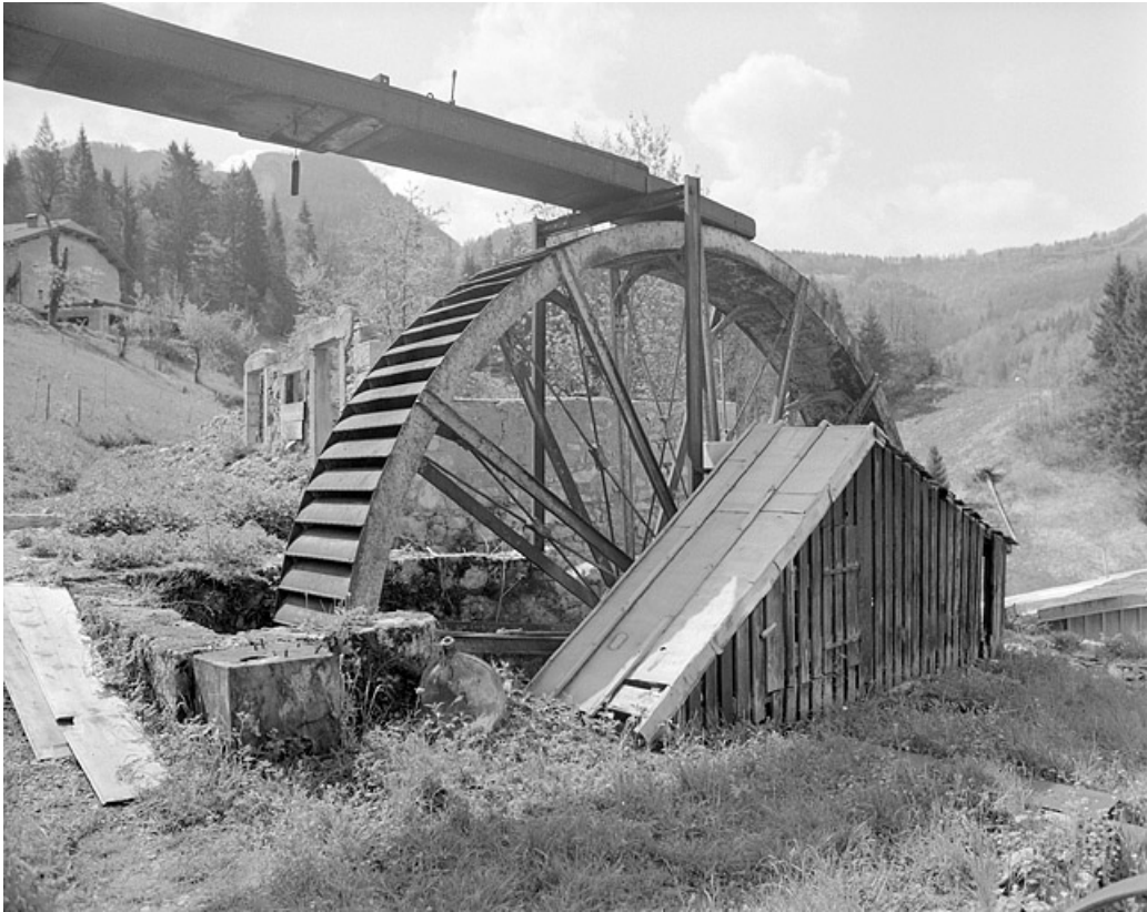
Roue hydraulique et abri du renvoi d'angles.

39, Villard-Saint-Sauveur, lieudit : Montbrillant