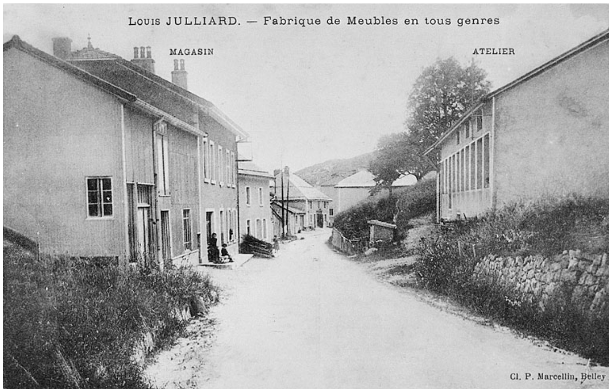
Louis Julliard. - Fabrique de meubles en tous genres. 39, Septmoncel place Dalloz