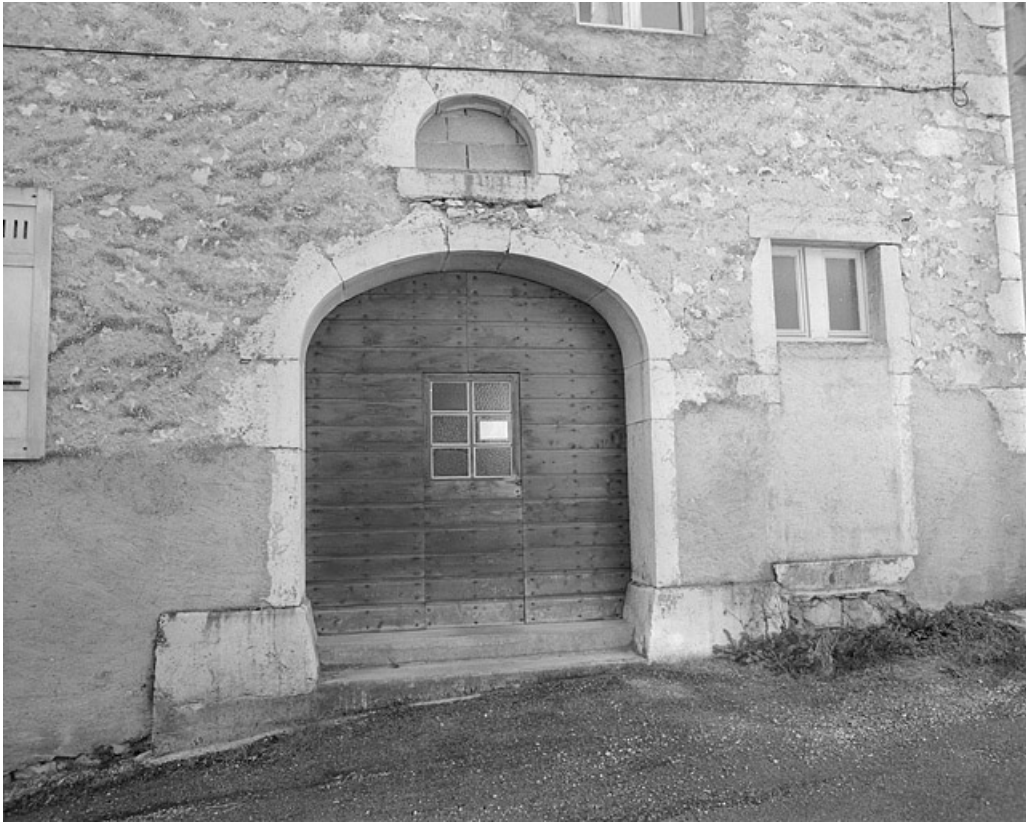
Bureau : porte dans le mur pignon nord-ouest.