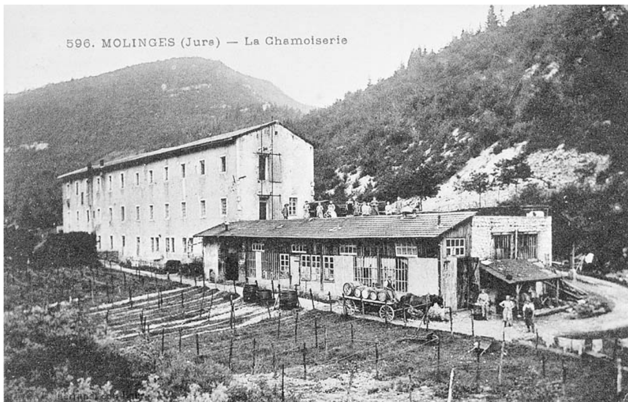
Molinges (Jura) - La Chamoiserie.