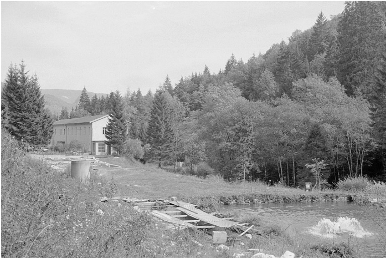
Vue d'ensemble depuis le sud-ouest.