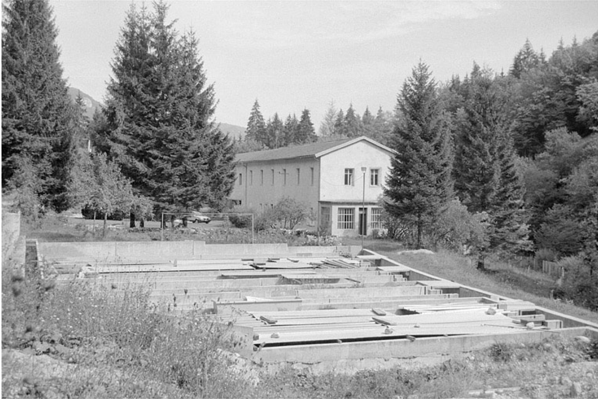
Bassins et bâtiment, depuis le sud-ouest.