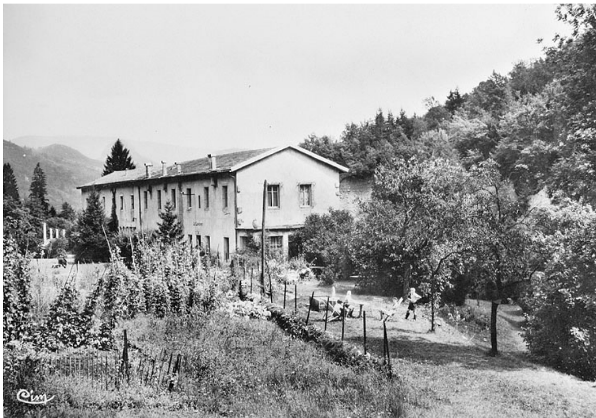
Molinges (Jura) - Le Long Viry.