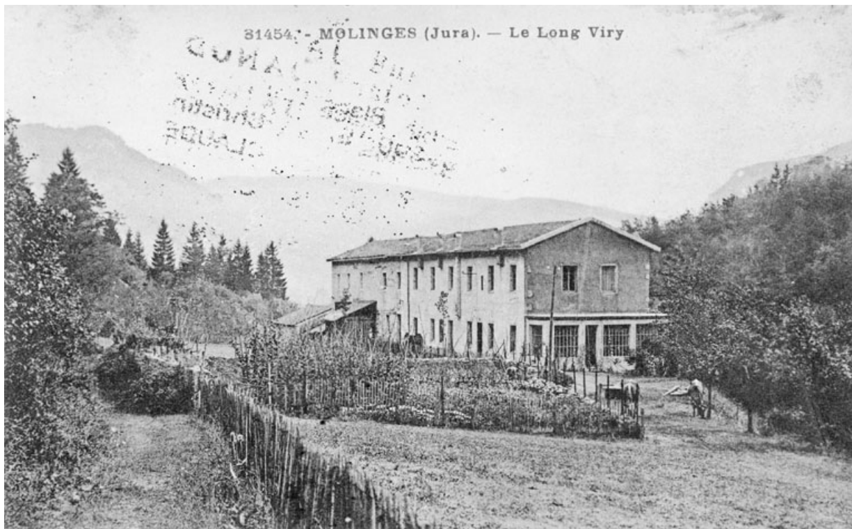
Molinges (Jura). - Le Long Viry.