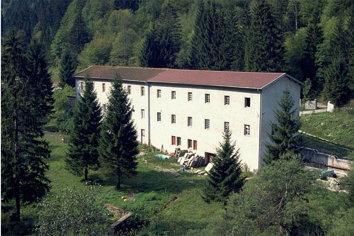
Vue d'ensemble depuis l'est (façade postérieure).