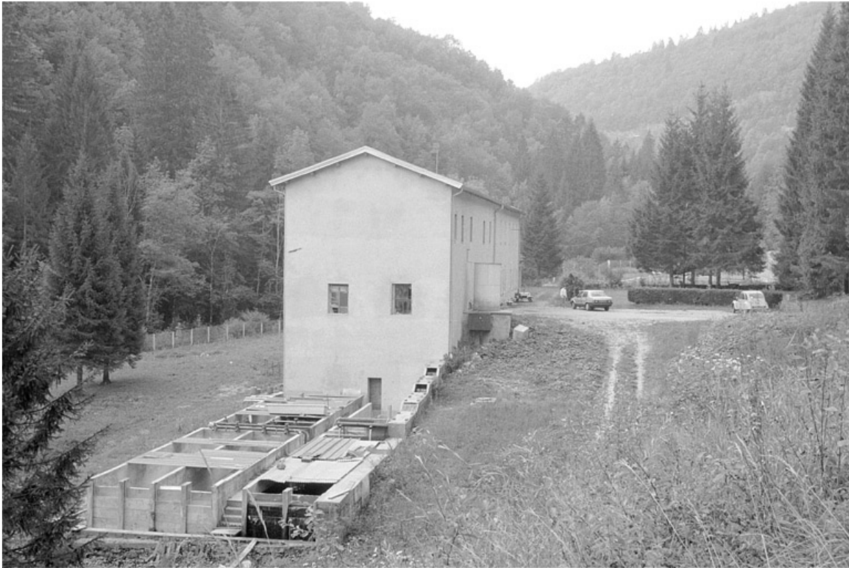
Bâtiment depuis le nord.