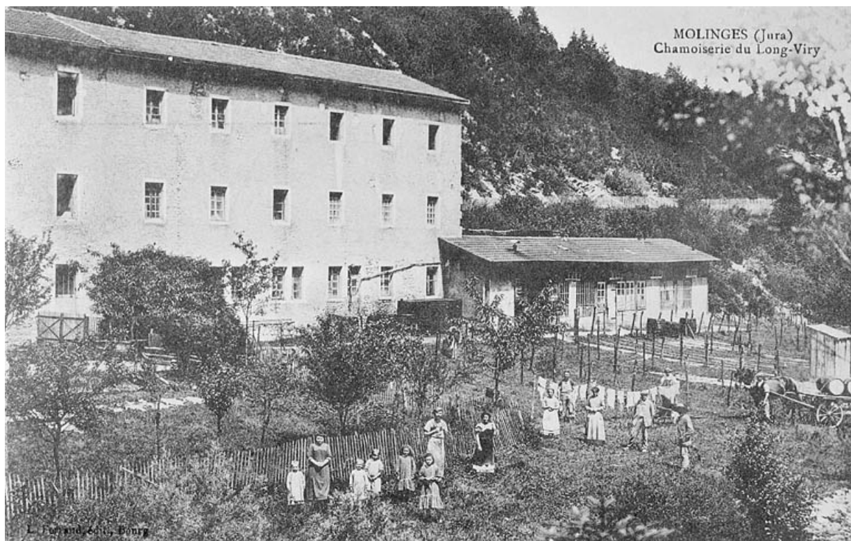
Molinges (Jura) - Chamoiserie du Long-Viry.