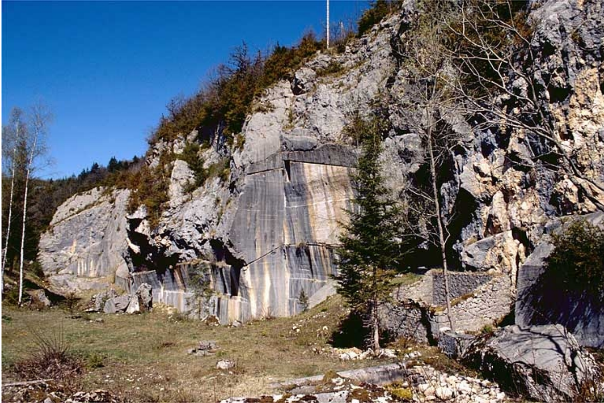
Carrière de Pratz : front de taille.