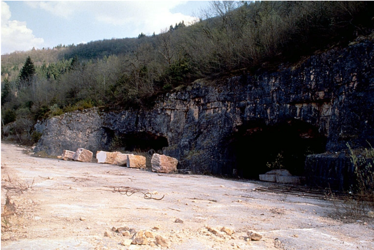
Carrière souterraine de Chassal : entrées. 39, Molinges