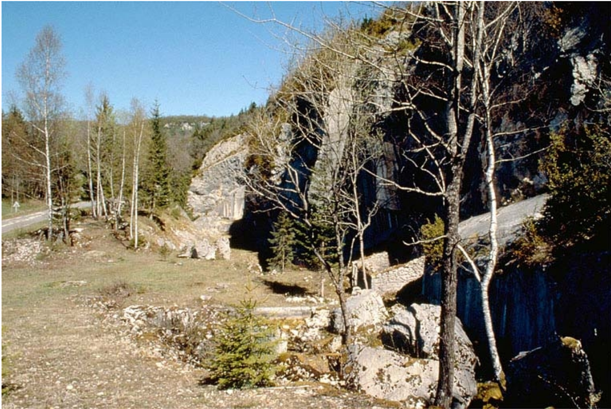
Carrière de Pratz : vue d'ensemble depuis le sud. 39, Molinges