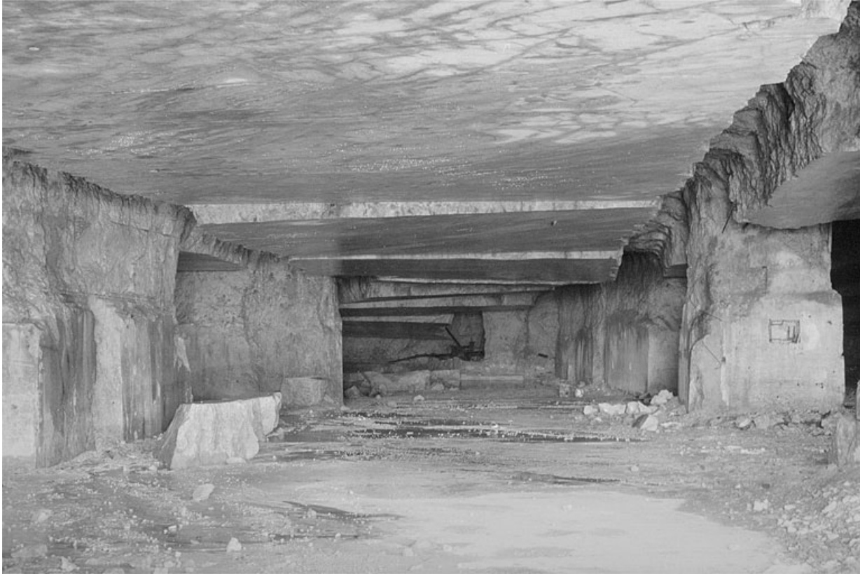
Carrière souterraine de Chassal : intérieur depuis une entrée. 39, Molinges