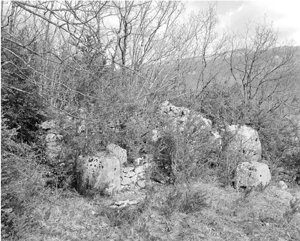
Carrière de Marignat, commune de Chassal : ruines de la forge (et entrepôt d'outils). 39, Molinges