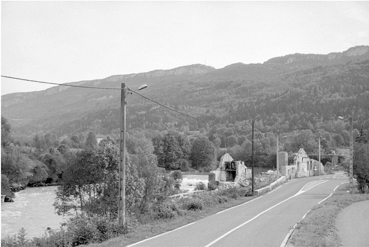
Usine de Molinges : vestiges.