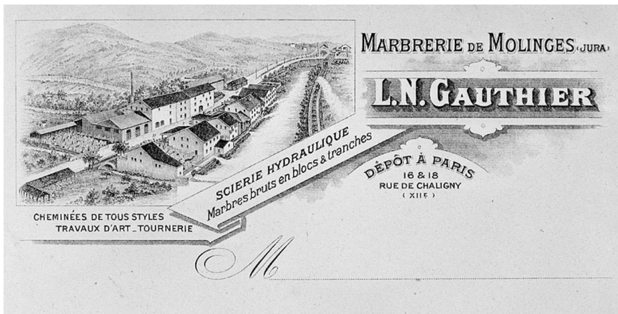
Enveloppe à en-tête de la Marbrerie de Molinges.