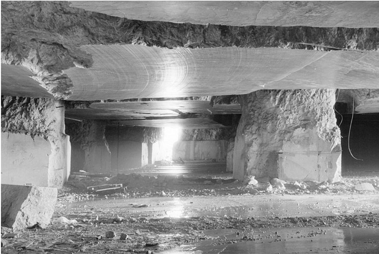
Carrière souterraine de Chassal : galerie latérale. 39, Molinges