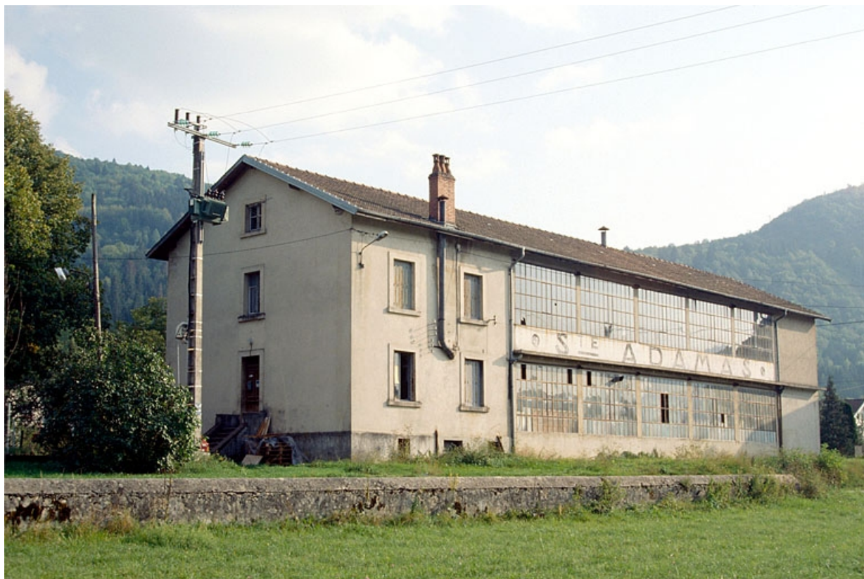
Façade antérieure, de trois quarts gauche. 39, Chassal