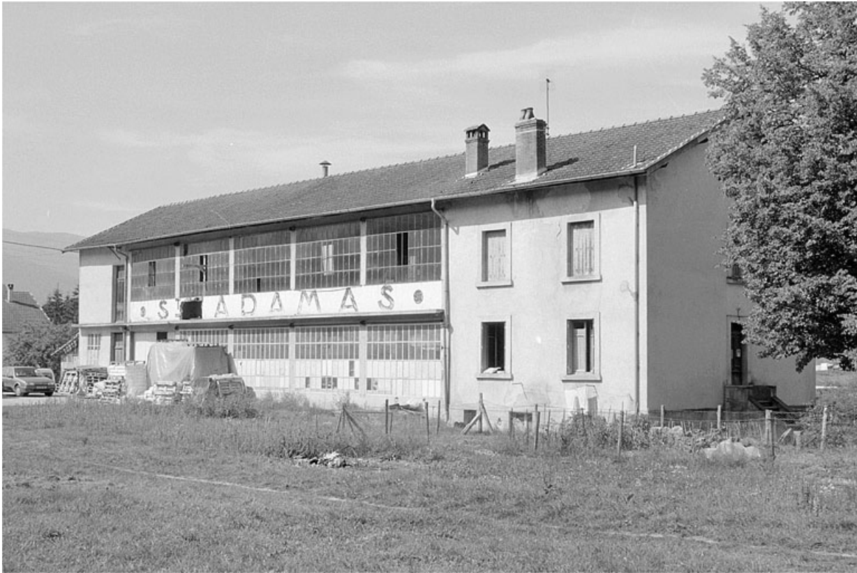
Façade postérieure, de trois quarts droit.