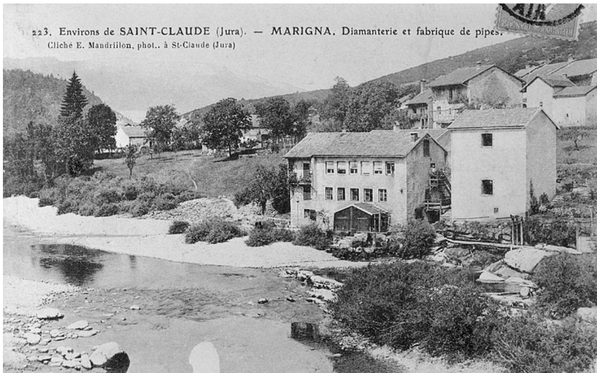
Environs de Saint-Claude (Jura). - Marigna. Diamanterie et fabrique de pipes. 39, Chassal, lieudit : Marnat