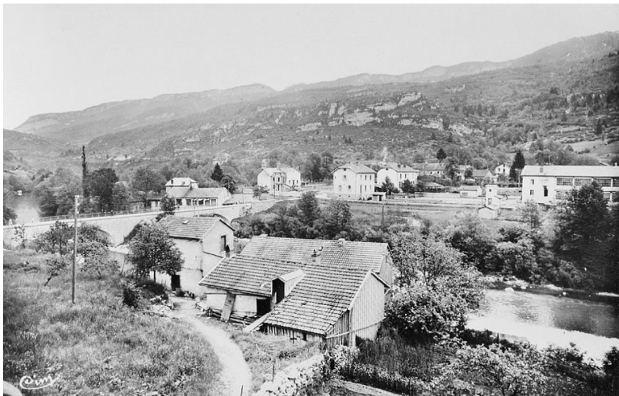
Chassal (Jura). Vue générale.