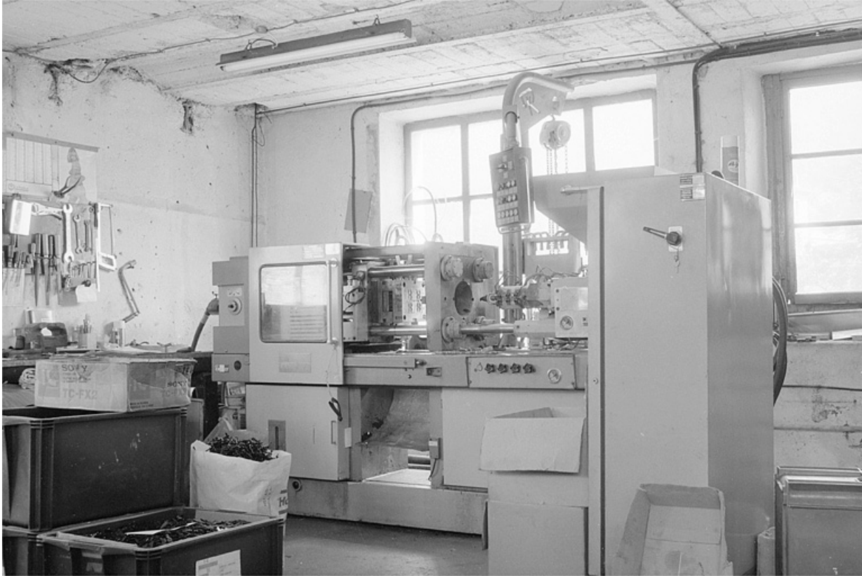
Presse à injecter DK.