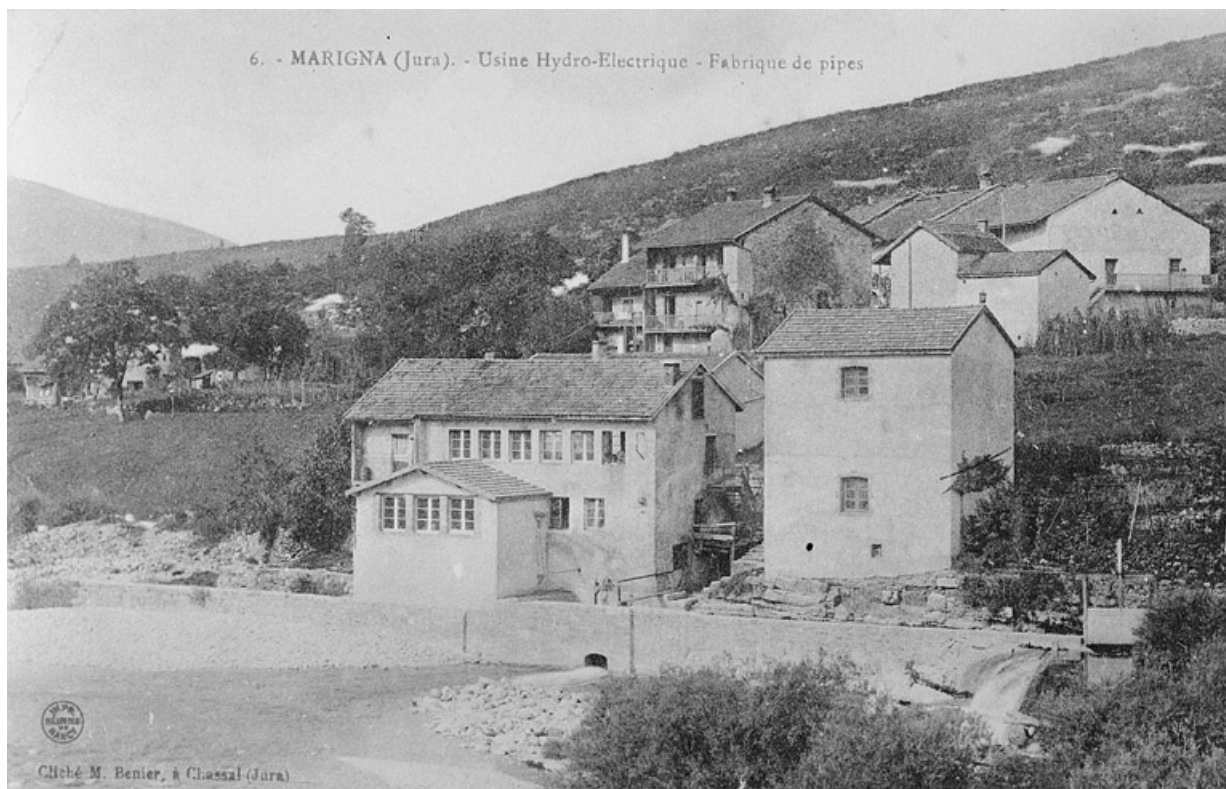
Marigna (Jura). - Usine Hydro-Electrique - Fabrique de pipes.