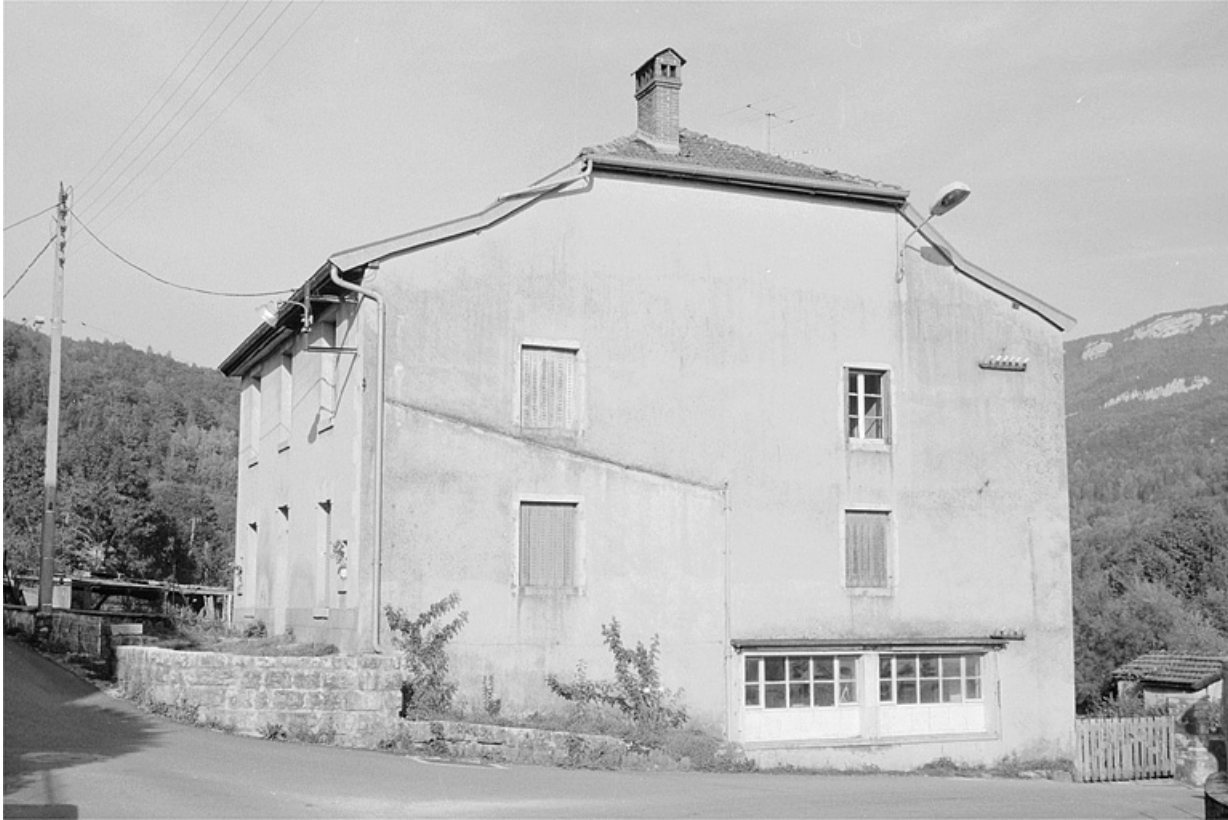
Façade latérale du logement patronal. Les grandes baies horizontales éclairent un atelier de fabrication.