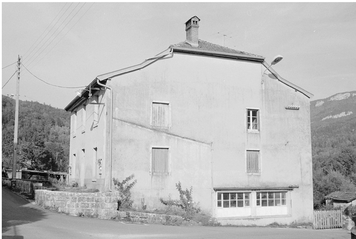
Façade latérale du logement patronal. Les grandes baies horizontales éclairent un atelier de fabrication.