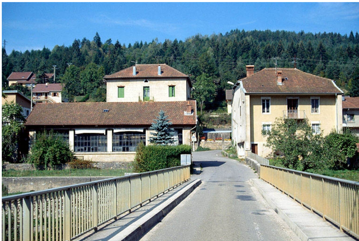
Vue d'ensemble depuis le pont.