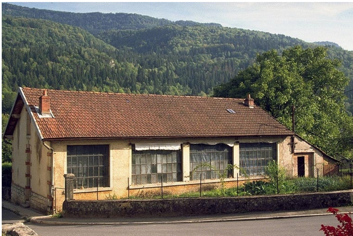
Façade latérale droite de l'atelier de fabrication.