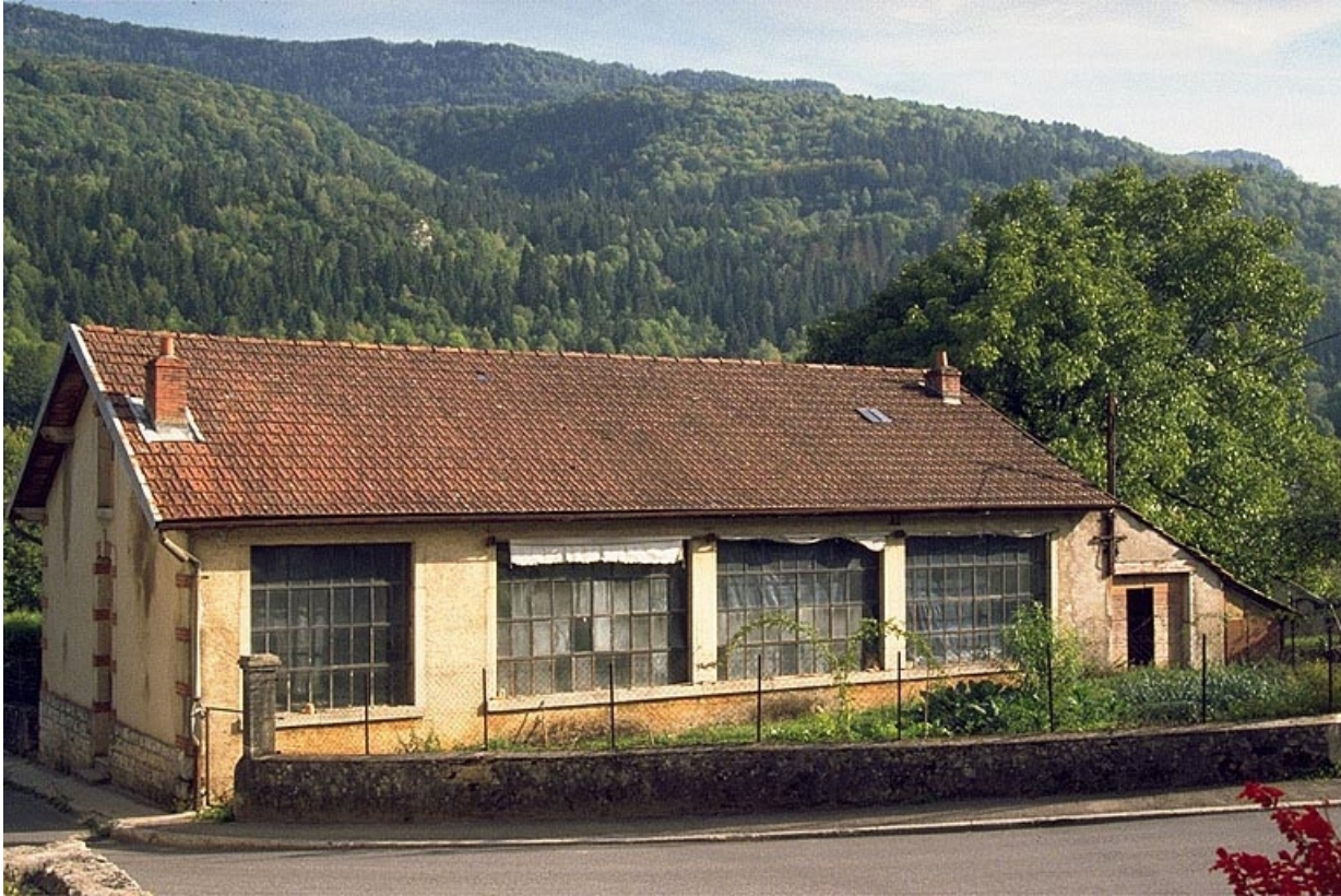
Façade latérale droite de l'atelier de fabrication.