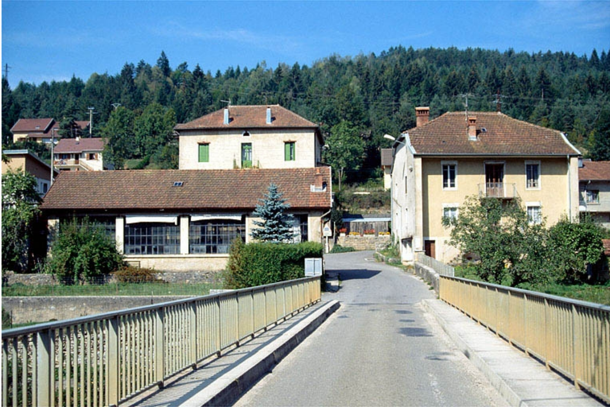
Vue d'ensemble depuis le pont.