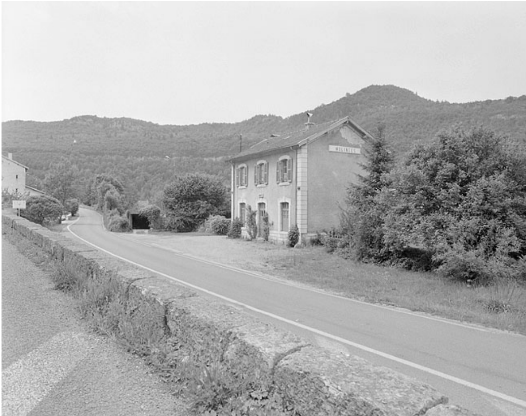
Vue d'ensemble, depuis la route de Lyon (est).