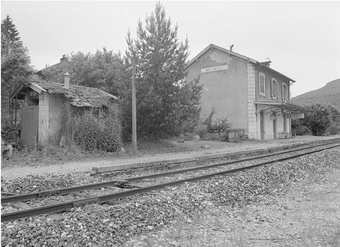
Vue d'ensemble depuis la voie, côté Andelot-en-Montagne (est).