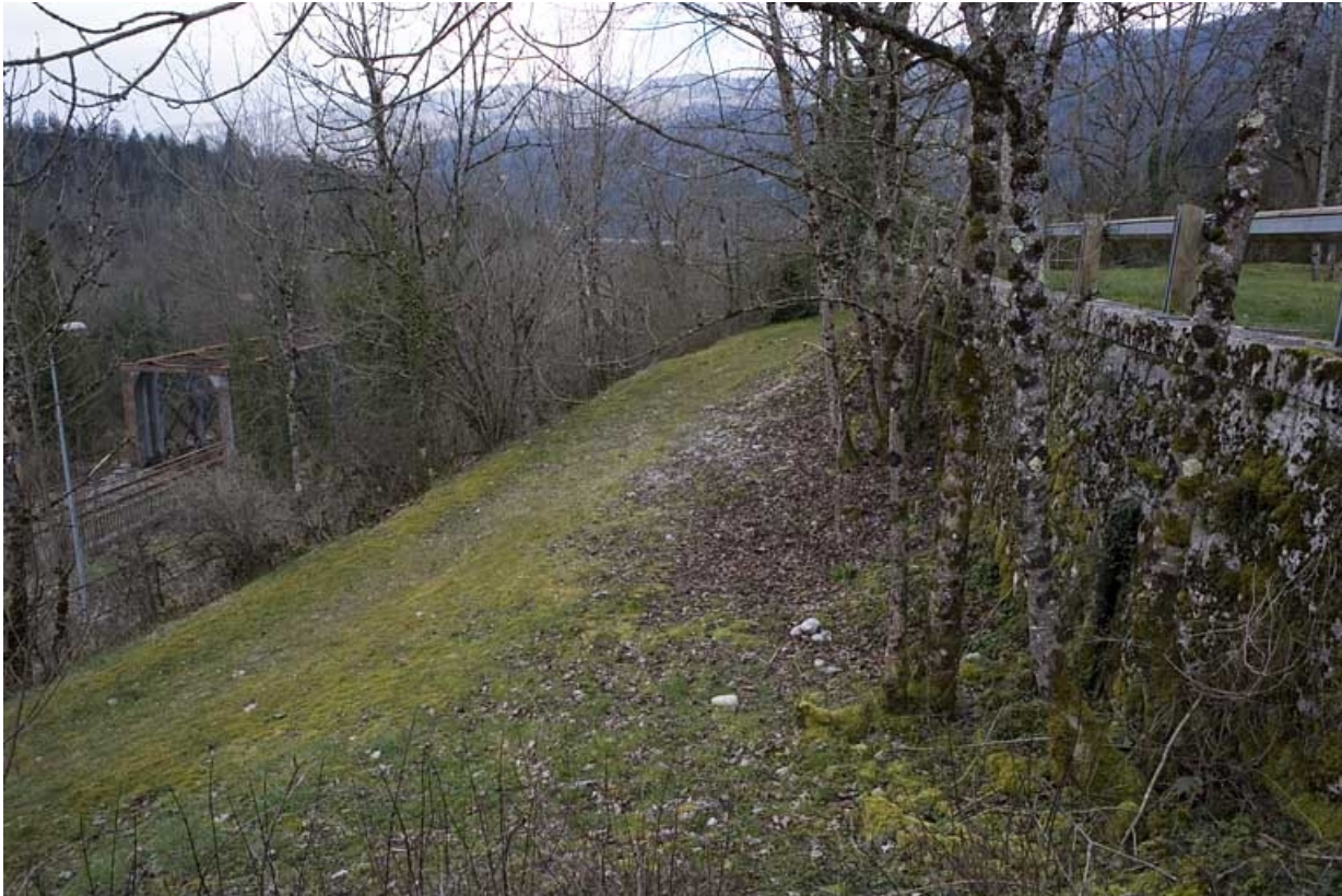
Réservoir (à droite) et son chemin d'accès.