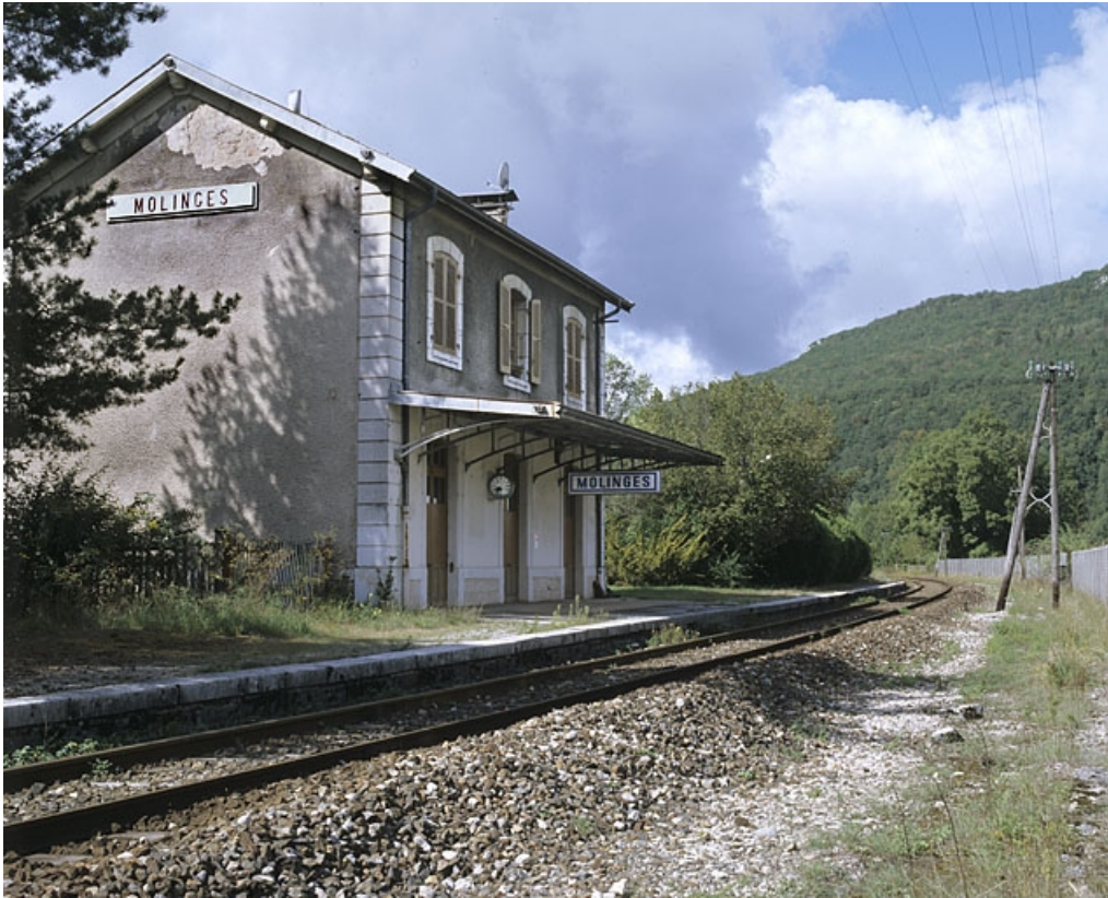
Façade postérieure, de trois quarts gauche.