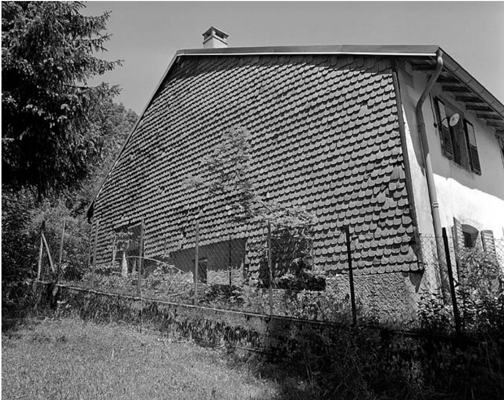
Essentage de tuiles sur un pignon sud-ouest.