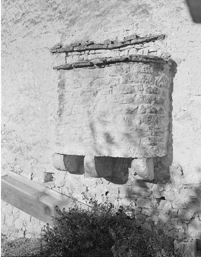
Four accolé en pignon, porté par des consoles en pierres. 39, La Rixouse