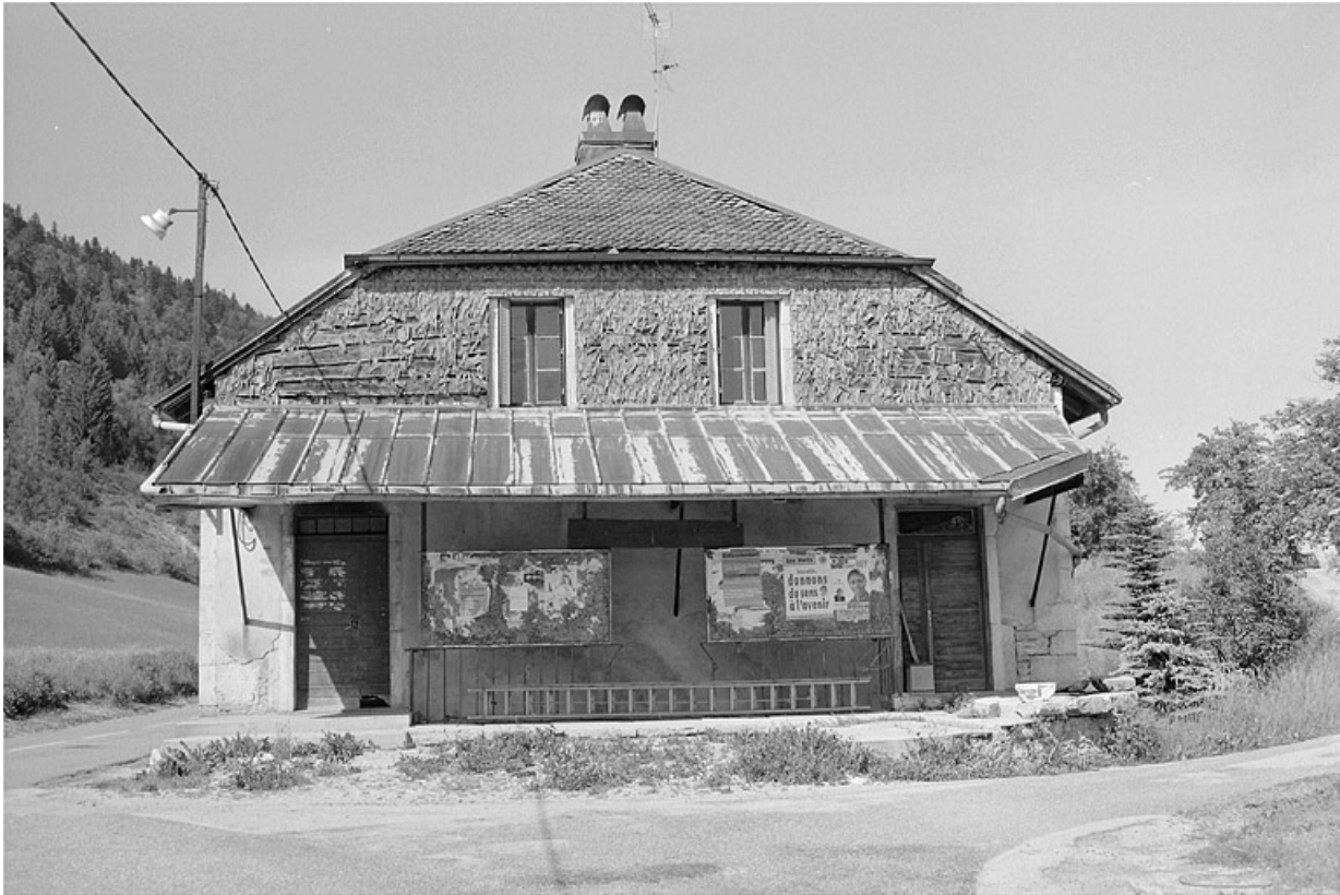
Vue de la façade antérieure.