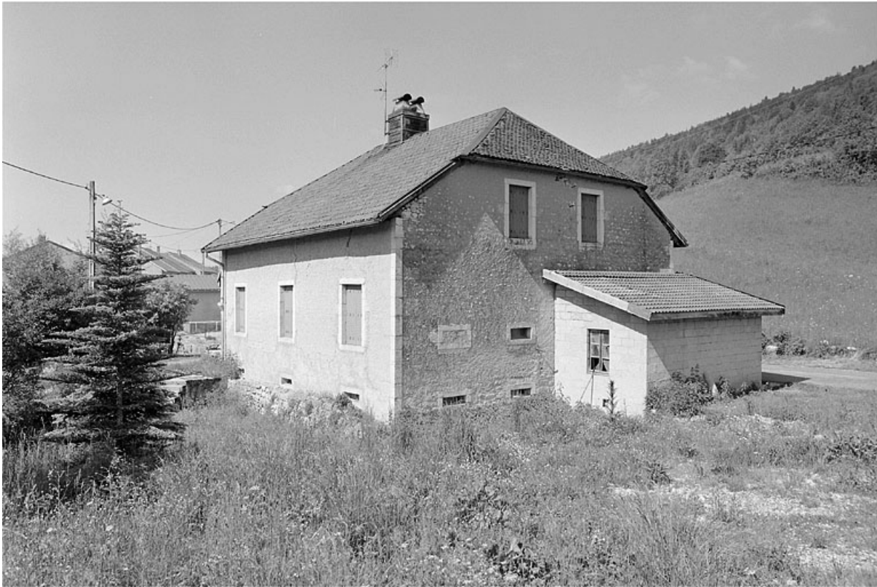
Vue de trois quarts de la façade postérieure et de la face droite.