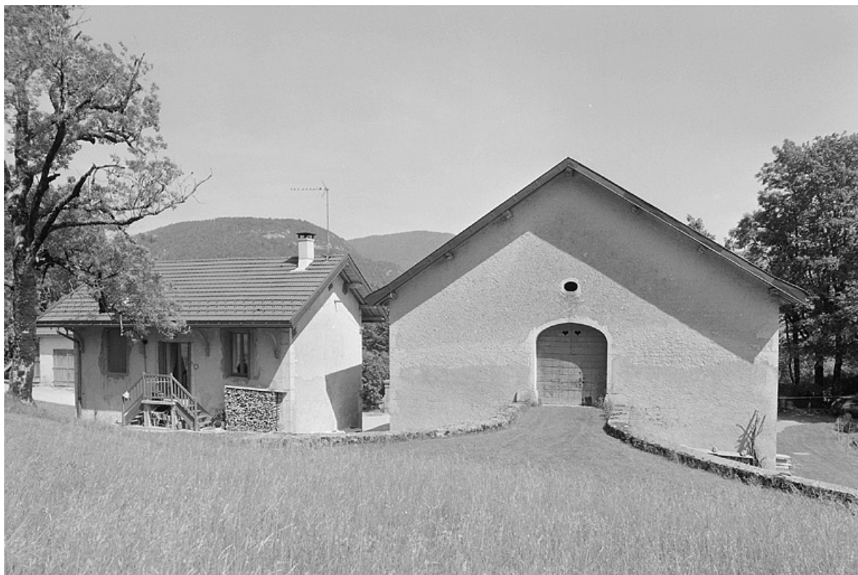
Façade postérieure de la ferme et de la remise à automobile.

39, Avignon-lès-Saint-Claude, lieudit : sous la Goutte