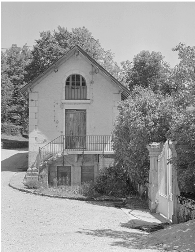
Façade antérieure du logement des jardiniers.

39, Avignon-lès-Saint-Claude, lieudit : sous la Goutte