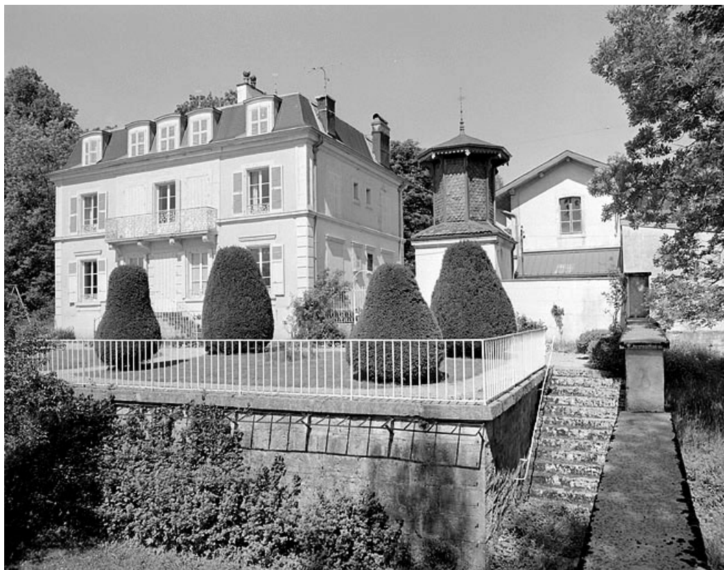
Façade sur jardin de la demeure, pigeonnier et face latérale de l'atelier.

39, Avignon-lès-Saint-Claude, lieudit : sous la Goutte