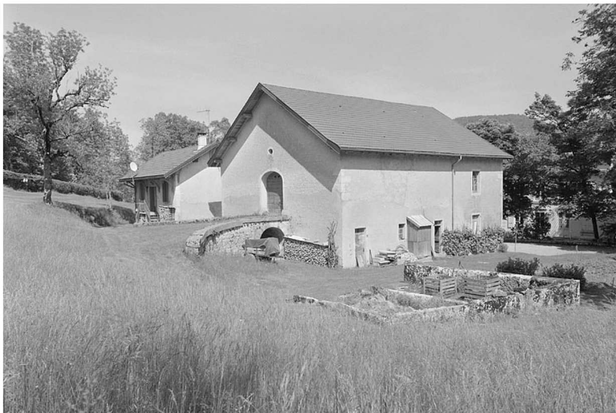
Face gauche et façade postérieure de la ferme.

39, Avignon-lès-Saint-Claude, lieudit : sous la Goutte