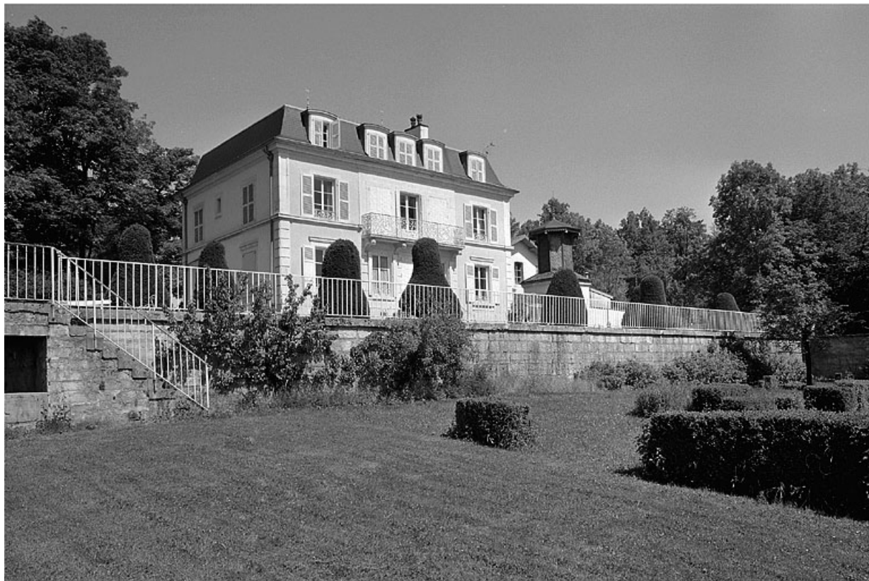
Façade sur jardin de la demeure.

39, Avignon-lès-Saint-Claude, lieudit : sous la Goutte