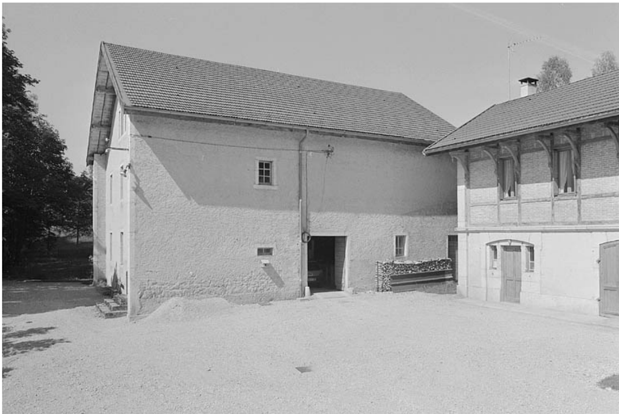
Face droite de la ferme et façade antérieure de la remise à automobile.

39, Avignon-lès-Saint-Claude, lieudit : sous la Goutte