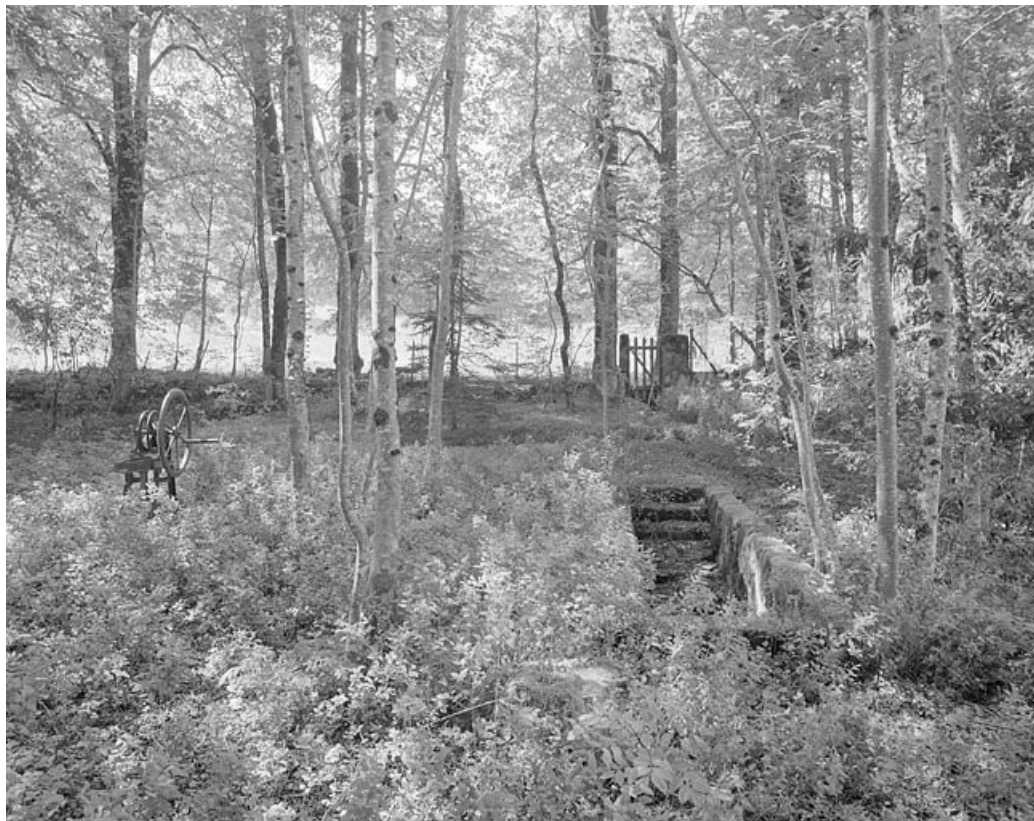
Dans le parc, accès à une citerne enterrée et pompe à eau reliée à cette citerne.

39, Avignon-lès-Saint-Claude, lieudit : sous la Goutte