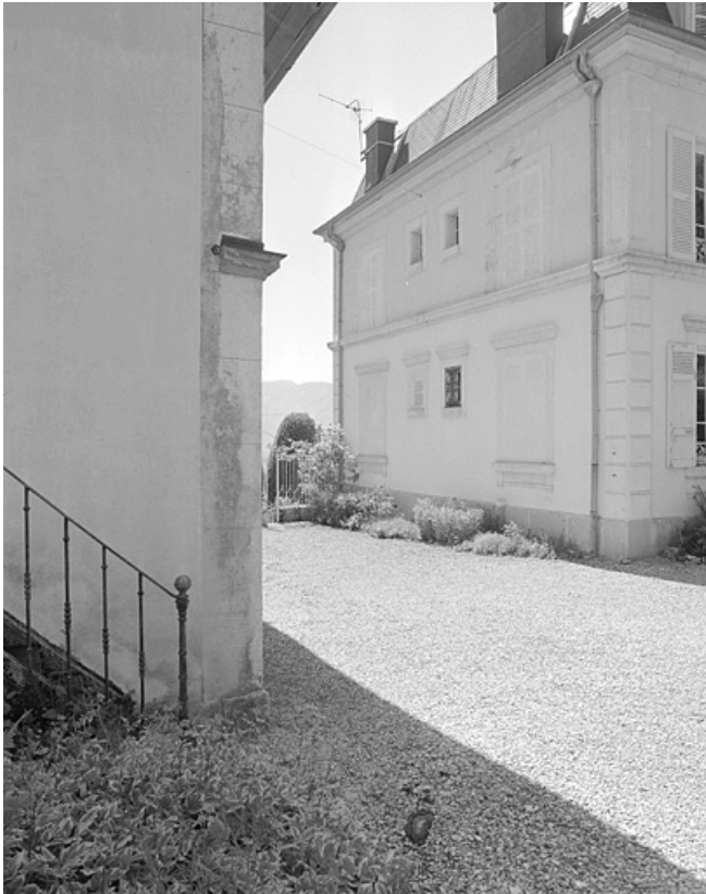
Face gauche de la demeure.

39, Avignon-lès-Saint-Claude, lieudit : sous la Goutte