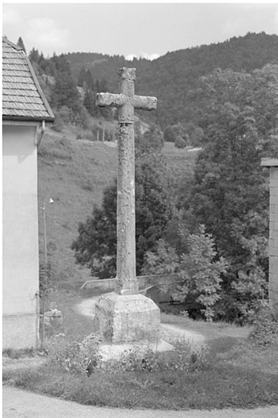
Vue depuis l'ouest.