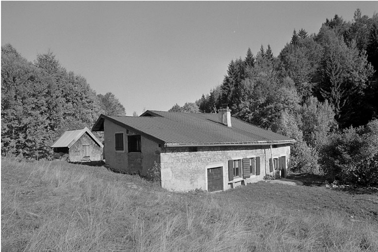
Façade antérieure et face sud-ouest.