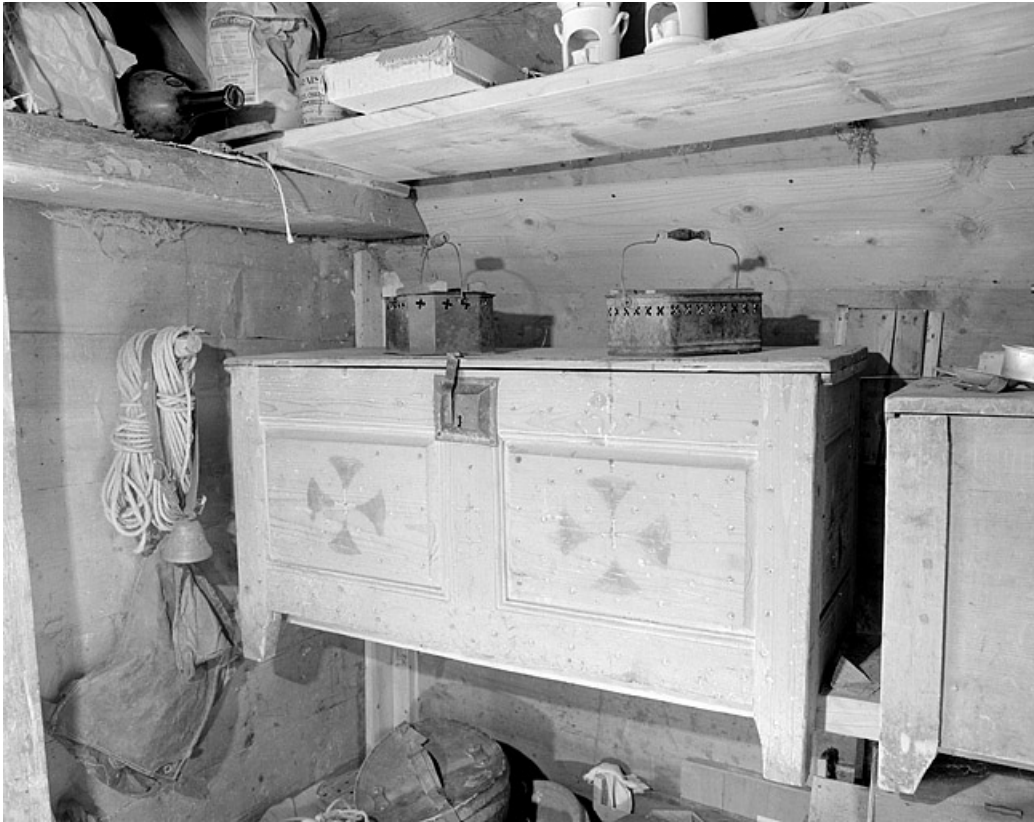
Coffre à vêtement dans le grenier fort.