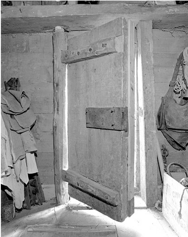
Porte intérieure du grenier fort. 39, Lamoura chemin Sous la Roche