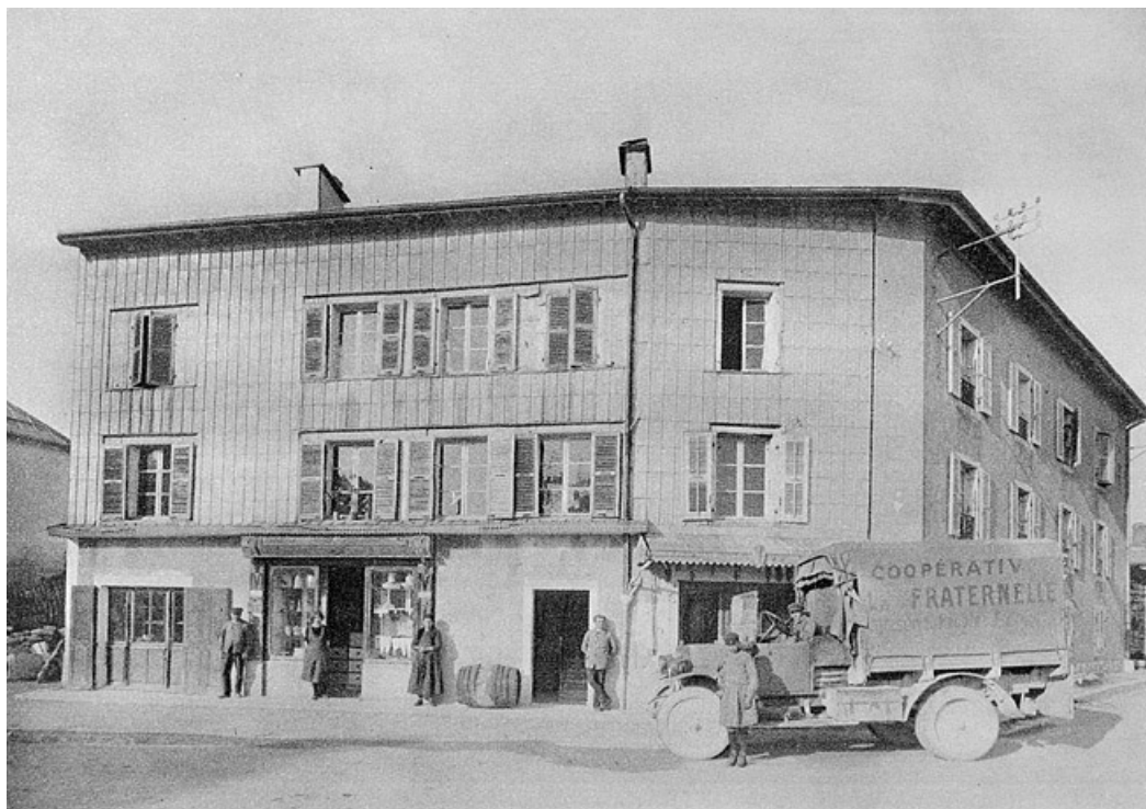
48. — La Fraternelle , Société coopérative d'alimentation; succursale de Septmoncel (Immeubles). (Magasin et cave de gros).

La Fraternelle, Société coopérative d'alimentation ; succursale de Septmoncel (Immeubles). (Magasin et cave de gros). 39, Septmoncel Désiré Dalloz