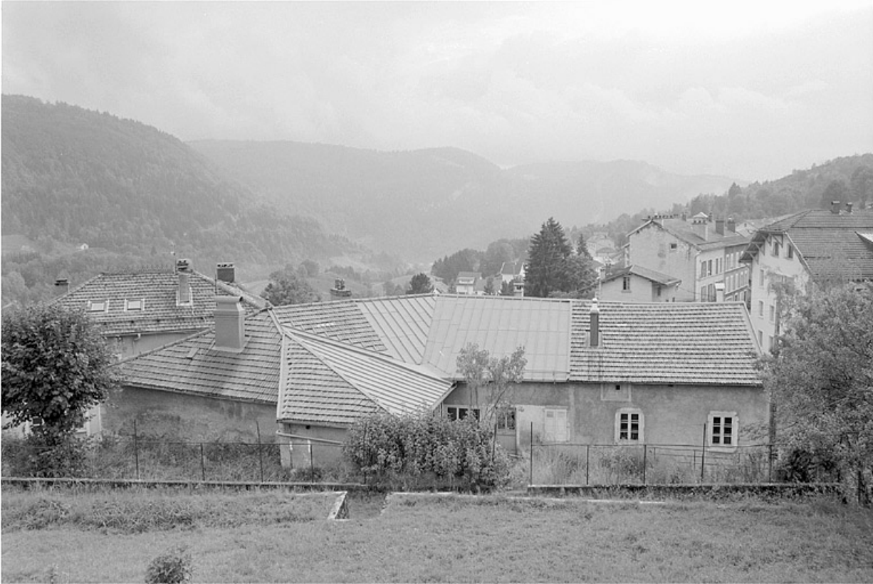
Façade postérieure et toit du bâtiment.